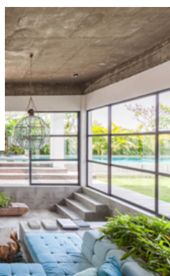
Boven: zitkamer; rechts: badkamer; links: keuken