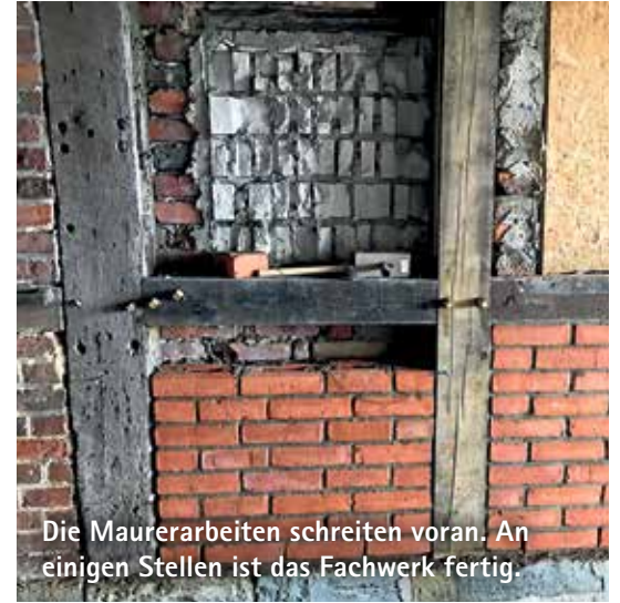
Die Maurerarbeiten schreiten voran. An einigen Stellen ist das Fachwerk fertig.