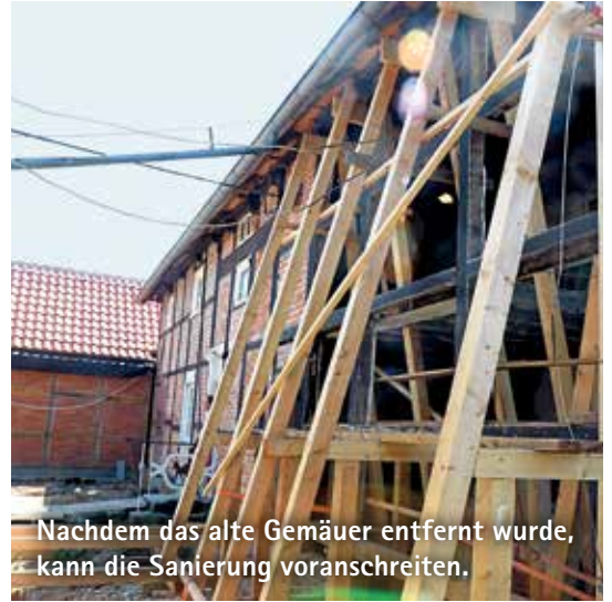
Nachdem das alte Gemäuer entfernt wurde, kann die Sanierung voranschreiten.

Das große Tor wird künftig ein Blickfang im Wohnzimmer.