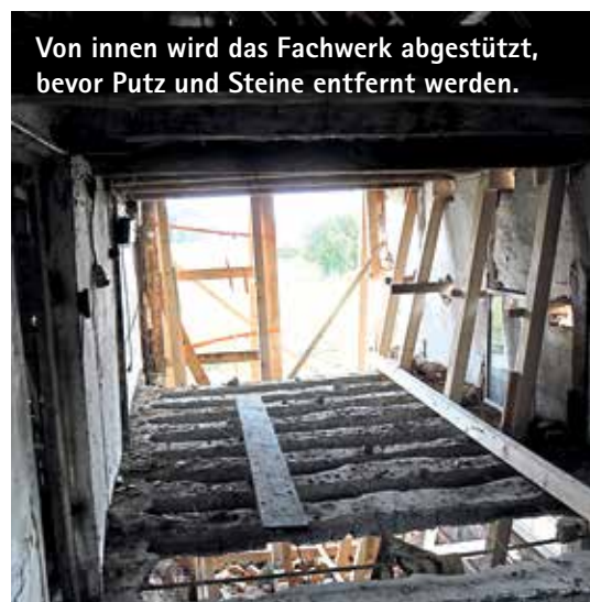
Von innen wird das Fachwerk abgestützt, bevor Putz und Steine entfernt werden.