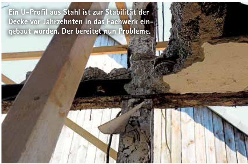
Ein U-Profil aus Stahl ist zur Stabilität der Decke vor Jahrzehnten in das Fachwerk eingebaut worden. Der bereitet nun Probleme.