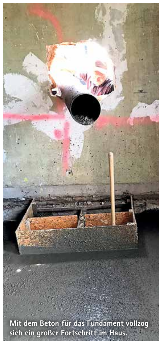
Mit dem Beton für das Fundament vollzog sich ein großer Fortschritt im Haus.