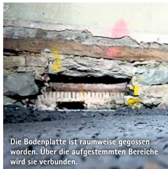
Die Bodenplatte ist raumweise gegossen worden. Über die aufgestemmt Bereiche wird sie verbunden.