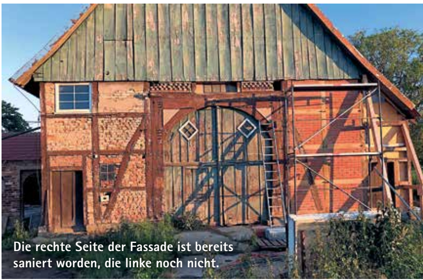
Die rechte Seite der Fassade ist bereits saniert worden, die linke noch nicht.