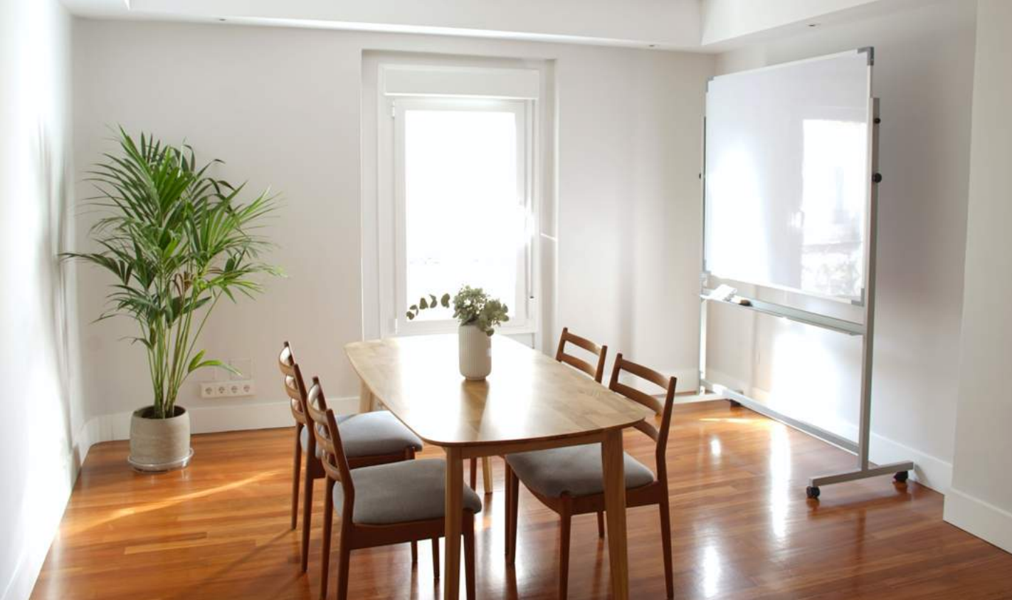
Una de las salas de trabajo