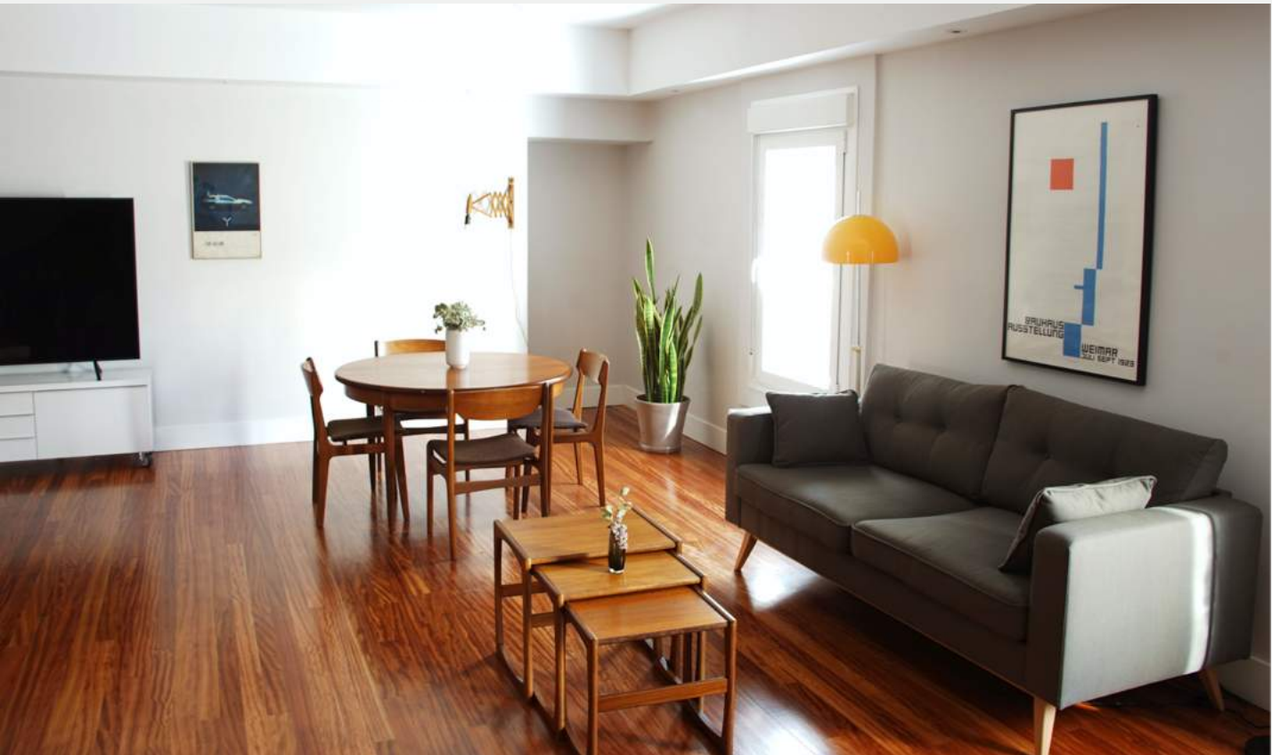
La sala Bauhaus

El espacio del Instituto está disponible para los alumnos que viajen desde fuera, quienes quieran trabajar en sus proyectos o deseen, en algún momento, tomar un café y hacer uso de la biblioteca.