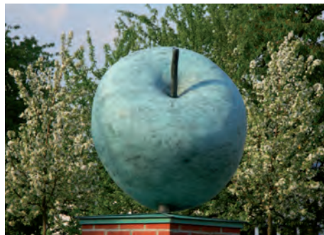
Der Apfelkreisel. Massenheim ist für seinen köstlichen Apfelwein bekannt.

Eine Bereicherung ist der neue Wochenmarkt auf dem Dorfplatz. Die Stadt hat die Marktbesucher im ersten Jahr großzügig von den Standgebühren befreit. Der Markt hat sich inzwischen zu einem beliebten Treffpunkt entwickelt.