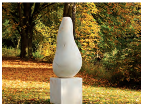
Die Auenkunst. Entlang des Erlenbaches wird zeitgenössische Kunst präsentiert.