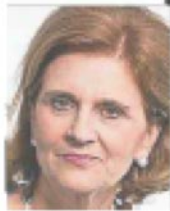
FDP-Nationalrätin Doris Fiala.

Die grünliberale Berner Nationalrätin Kathrin Bertschy (38) sagt es am deutlichsten: «Wenn der Bundesrat in der Schweiz Parteien und Regionen repräsentieren soll, warum soll das nicht auch für Geschlechter möglich sein?», fragt sie rhetorisch.