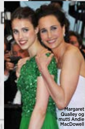
Margaret Qualley og mutti Andie MacDowell