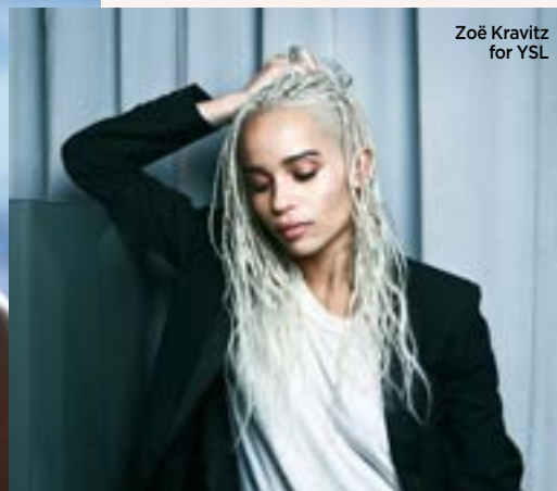
Zoë Kravitz for YSL