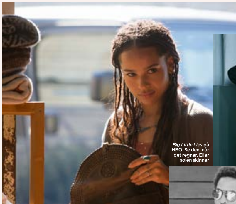
Big Little Lies på HBO. Se den, når det regner. Eller solen skinner