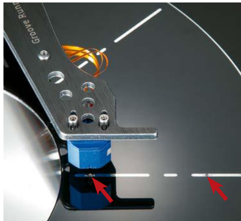
Eine klasse Idee sind die zwei Messpunkte (Pfeile) für den Überhang auf dem Teller. Korrekt eingestellt fluchtet die Headshell mit dessen Hilfslinie.

Zum Lieferumfang gehört eine Staubschutzhaube aus Polystyrol, die über anzuschraubende Halter mit der Zarge verbunden wird und sich so auf- und zuschwenken lässt.