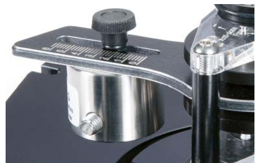
Das Gegengewicht ist über einen Gummipuffer vom Arm entkoppelt und lässt sich deshalb nur mit Fingerspitzengefühl fein verschieben.

Pure Spielerei? Gewiss! Doch zugleich eine optische Finesse, die zum raffinierten Technikkonzept passt. Statt fest, ehern und unverrückbar ist am DG-1 vieles flexibel und elastisch. Dieser entfaltet sich sozusagen im freien Spiel seiner Kräfte. Und dies in geradezu mitreißender Art. Egal, welchen Tonabnehmer wir justiert hatten – im Laufe des Tests spielte ein halbes Dutzend am Groove Runner – zeigte sich ein wunderbar gelöstes,