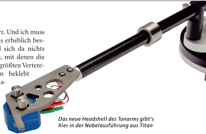
Das neue Headshell des Tonarms gibt's hier in der Nobelausführung aus Titan