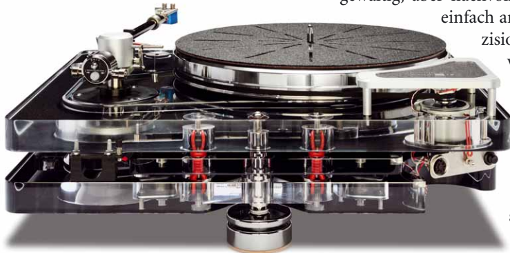
Von der Rückseite sind die Elastomerdämpfer gut zu erkennen

einfach am meisten Basspräzision. Der Supergroove macht es einem leicht, solcherlei Dinge nachzuvollziehen. Er ist ein extrem transparenter und neutraler Vertreter seiner Zunft, was das stolze Preisschild etwas rela-