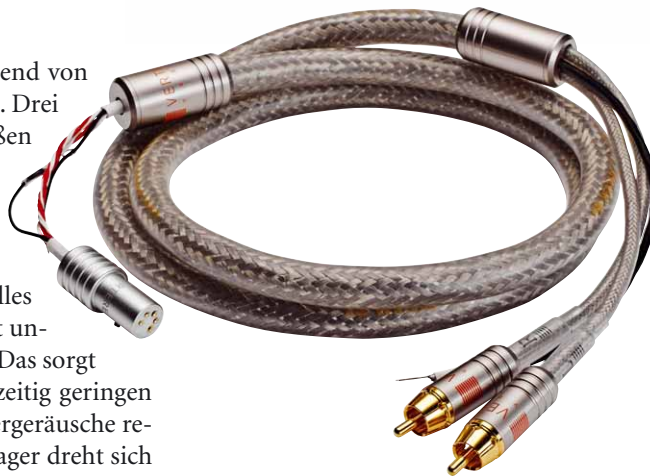
Auch das Tonarmkabel ist eine Neuentwicklung

Der Plattenteller wird am Außenrand von einem Gummi-Flachriemen angetrieben, der wiederum von einem Synchronmotor in Schwung versetzt wird. Jener hängt aufwändig elastisch gelagert links hinten in der Zarge. Jener Motor wird neuerdings von der sündteuren Motorsteuerung namens „Imperium“ in Bewegung versetzt. Im Inneren des schmucken aus dem Vollen gefrästen Kästchens sorgt nunmehr ein Mikrocontroller für die quatzgenaue Generation der steuernden Sinussignale, die dann, frisch über diskrete Endstufen in SMD-Bauweise gestärkt, ihren Weg zum Motor antreten. Ein zentraler Drehschalter erlaubt die Geschwindigkeitsvariation um 0,25 oder 0,75 Prozent in beide Richtungen. Jenes hat sich bei uns nicht als er-