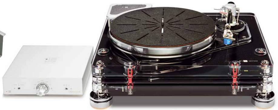
Der SG-1 Supergroove in dieser Ausbaustufe ist eine ausgesprochen ernste Angelegenheit

und Tonarm sitzen, weitgehend von Umwelteinflüssen isoliert ist. Drei dieser Basen sind von außen als „Ebenen“ zu erkennen, die vierte sitzt innen in einem Ausschnitt in der obersten Platte. Dort arbeitet ein ziemlich spezielles Tonarmlager: Die Spindel ist ungewöhnlich lang und dünn. Das sorgt für Kippstabilität bei gleichzeitig geringen reibenden Flächen, was Lagergeräusche reduzieren hilft. Auf diesem Lager dreht sich ein rund drei Kilogramm schwerer Aluminiumteller mit am Rand konzentrierter Masse, der mit einer dünnen Acrylplatte verklebt ist. Bei unserem Testgerät gesellte sich noch eine „Techno Mat“ getaufte Tellerauflage hinzu. Bei ihr sorgt ein zweischichtiger Aufbau (oben Filz, unten eine Mischung aus Gummi und Kork) für eine „luftkissenartige“ (Zitat vom Hersteller) Lagerung der Schallplatte.