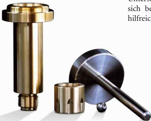
Das Tellerlager ist betont dünn und lang gehalten