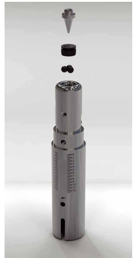
Das Einpunktlager des Tonarms ist eigentlich keins, die Spitze wird von drei Kugeln an Ort und Stelle gehalten