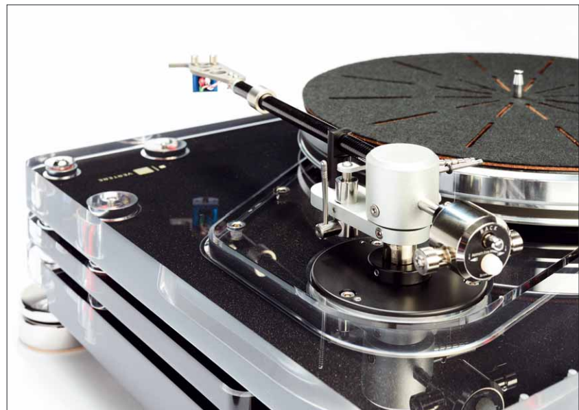
Das hängende Tonarm-Gegengewicht erlaubt nunmehr eine komfortable Azimuteinstellung