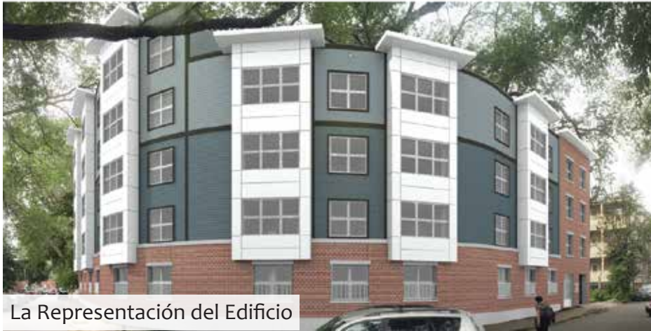
La Representación del Edificio

Apartamentos para rentar en South Boston, para personas de bajo ingresos y de 62 años o más