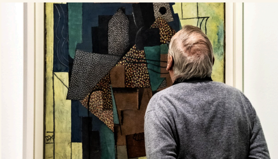
Picasso est à l'honneur toute l'année.

La BRAFA, Brussels Photo Festival, de nombreux rendez-vous attendus autour de Picasso, pour "fêter" les 50 ans de sa disparition.