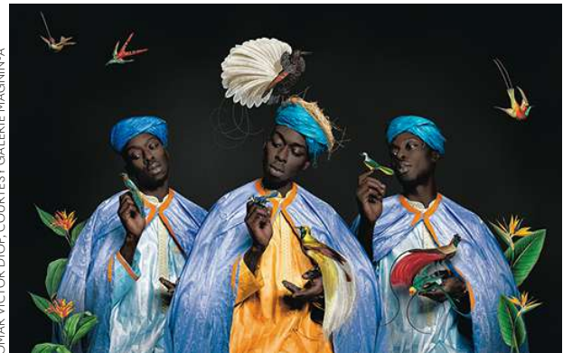
OMAR VICTOR DIOP, COURTESY GALERIE MAGNIN-A