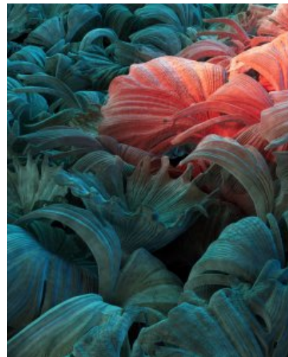
"Oyster Mushroom Orchestra", 2022.