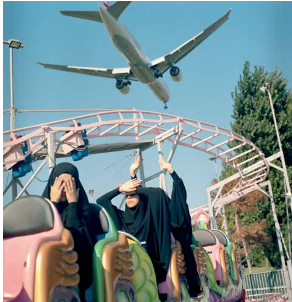
A plane flies low over students riding a train at a funfair over the weekend. Istanbul, 2018.