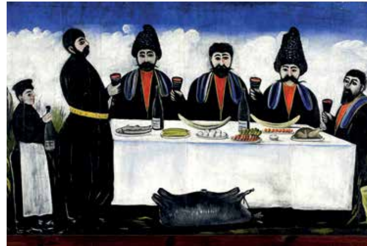
Niko Pirosmani, The feast of four citizens © National Museum of Georgia.

Close Enough, New Perspectives from 12 Women Photographers of Magnum, tot 16 december in Hangar Photo Art Center in Brussel. hangar.art