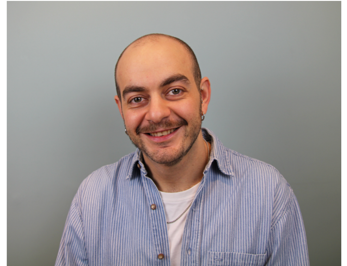
Bilde av styreleder tatt av Paulina Dubkov

Skeiv Verden går inn i en ny strategiperiode dette året, med mange spennende mål på agendaen. Den nye strategien for 2022–2024 har blitt skapt i samarbeid mellom lokallagene, sentralledet og sekretariatet i Oslo. Ved et helgeseminar har Skeiv Verden jobbet frem en ny strategi som vil sette agendaen for arbeidet de neste tre årene.