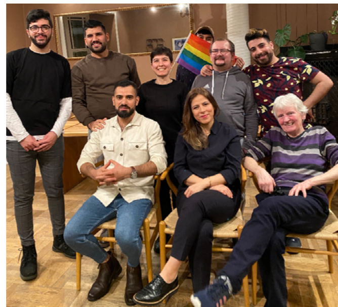
Bilde over er fra stiftelsesmøte til Skeiv Verden Midt-Norge