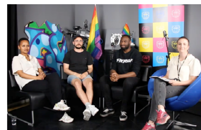
Bilde av medlemmer i Skeiv Verden