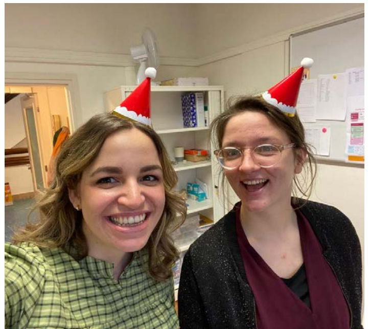
Kerst vieren op de opvang