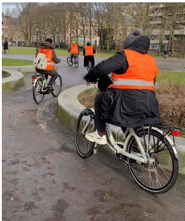
Fietsles van BOOST