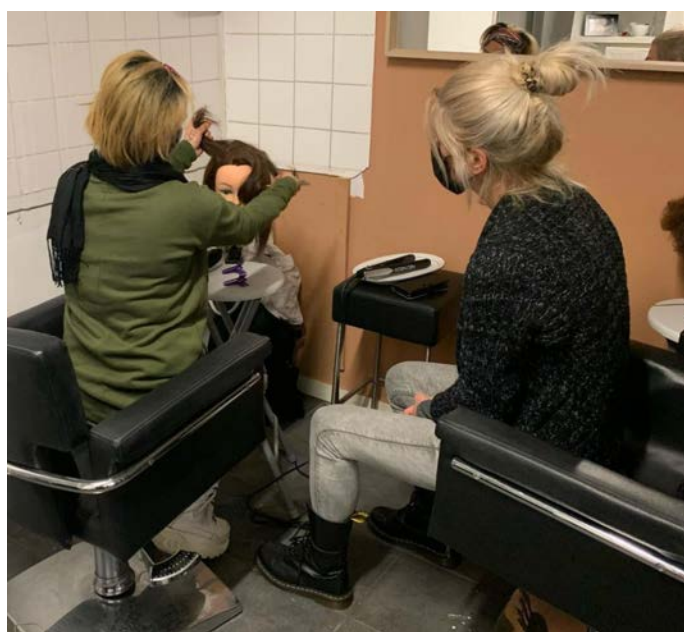
Kapperscursus bij PAO van ASKV