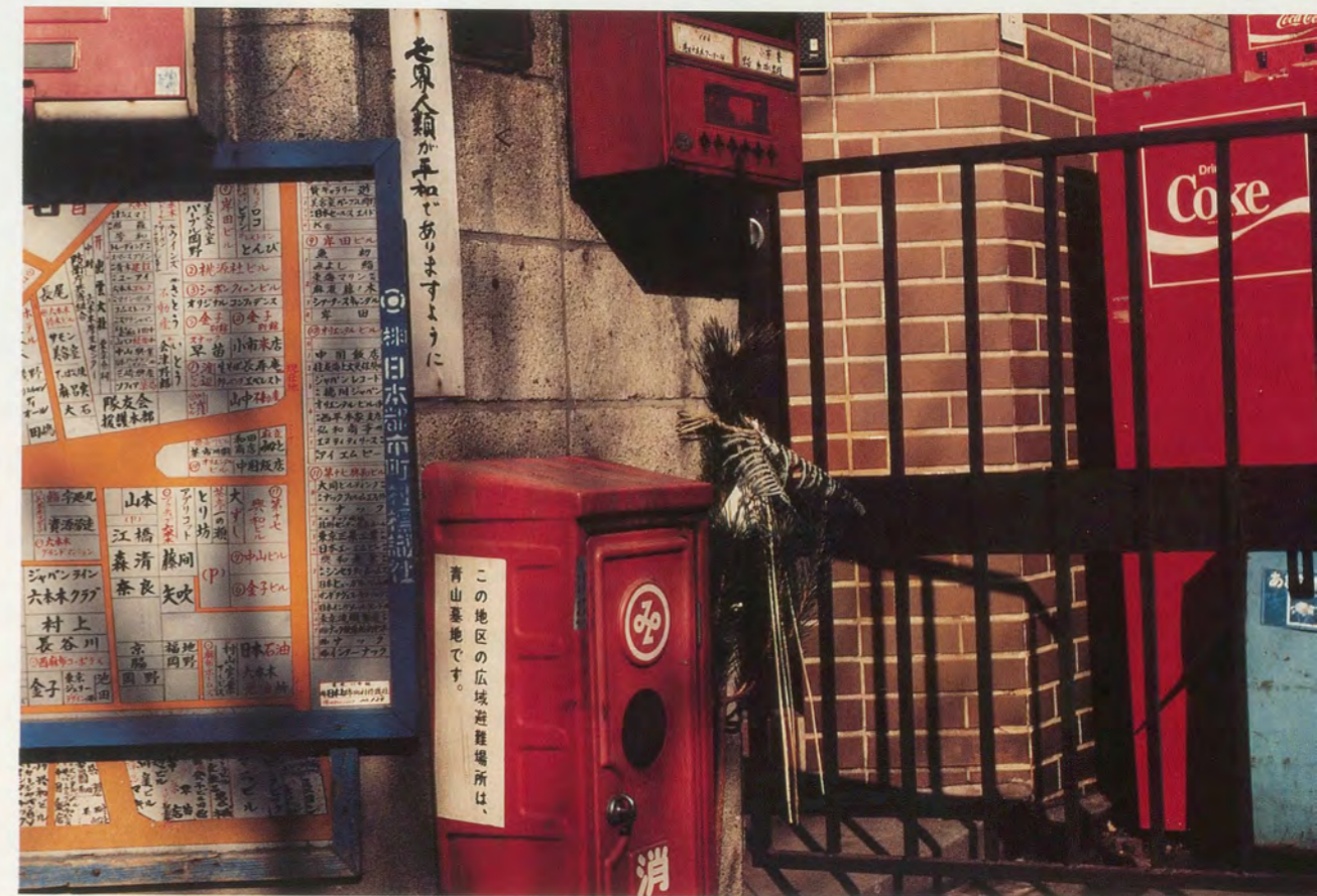
NEIGHBORHOOD MAP AND COKE MACHINE, TOKYO

There are no esthetic accidents... even the seeming chaos on the streets is intentional... the resulting complaints and criticisms of our urban environment are, in turn, also part of that environment. The occasional rupture is part of the texture. · Es gibt keine ästhetischen Zufälle... selbst das scheinbare Chaos auf den Strassen ist beabsichtigt... Klagen und Kritik über unsere urbane Umwelt sind ihrerseits auch Teil dieser Umwelt. Der gelegentliche Bruch ist Teil der Struktur.