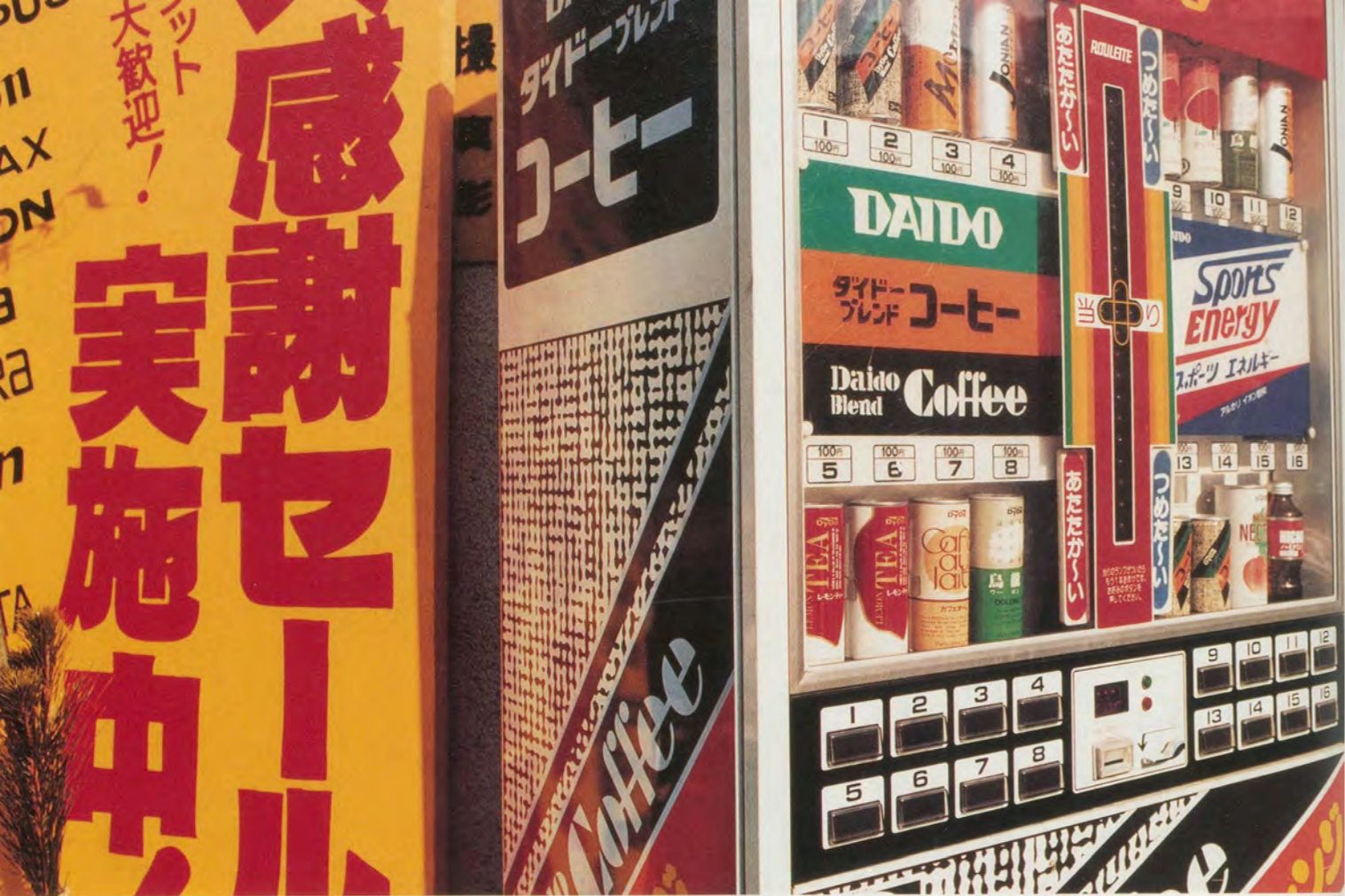
VENDING MACHINES ON THE STREET CORNER, TOKYO