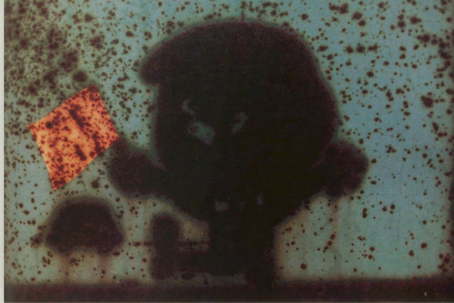
WARNING SIGN, CONSTRUCTION SITE, TOKYO