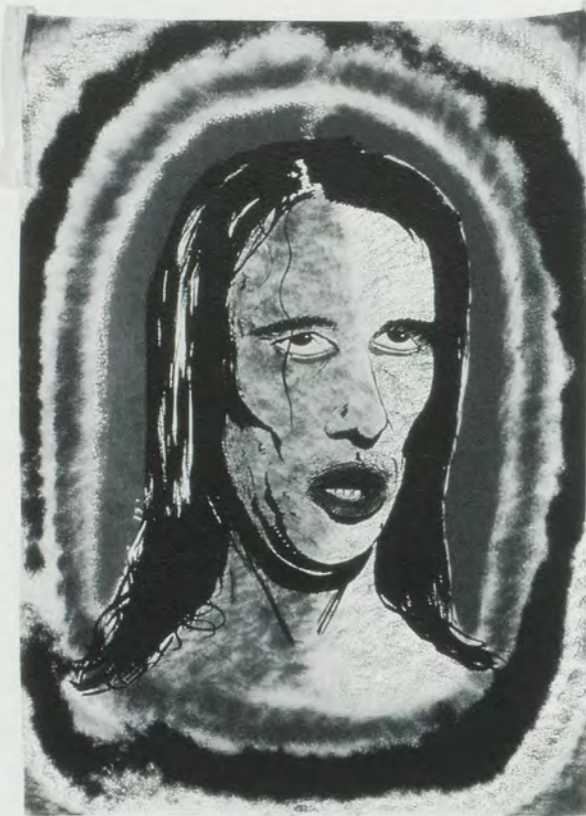
MIKE KELLEY, THE ORANGE & GREEN (from the series PANSY METAL/CLOVERED HOOF), 1989, silkscreen on silk, 53 x 38"/Siebdruck auf Seide, 135 x 96 cm.