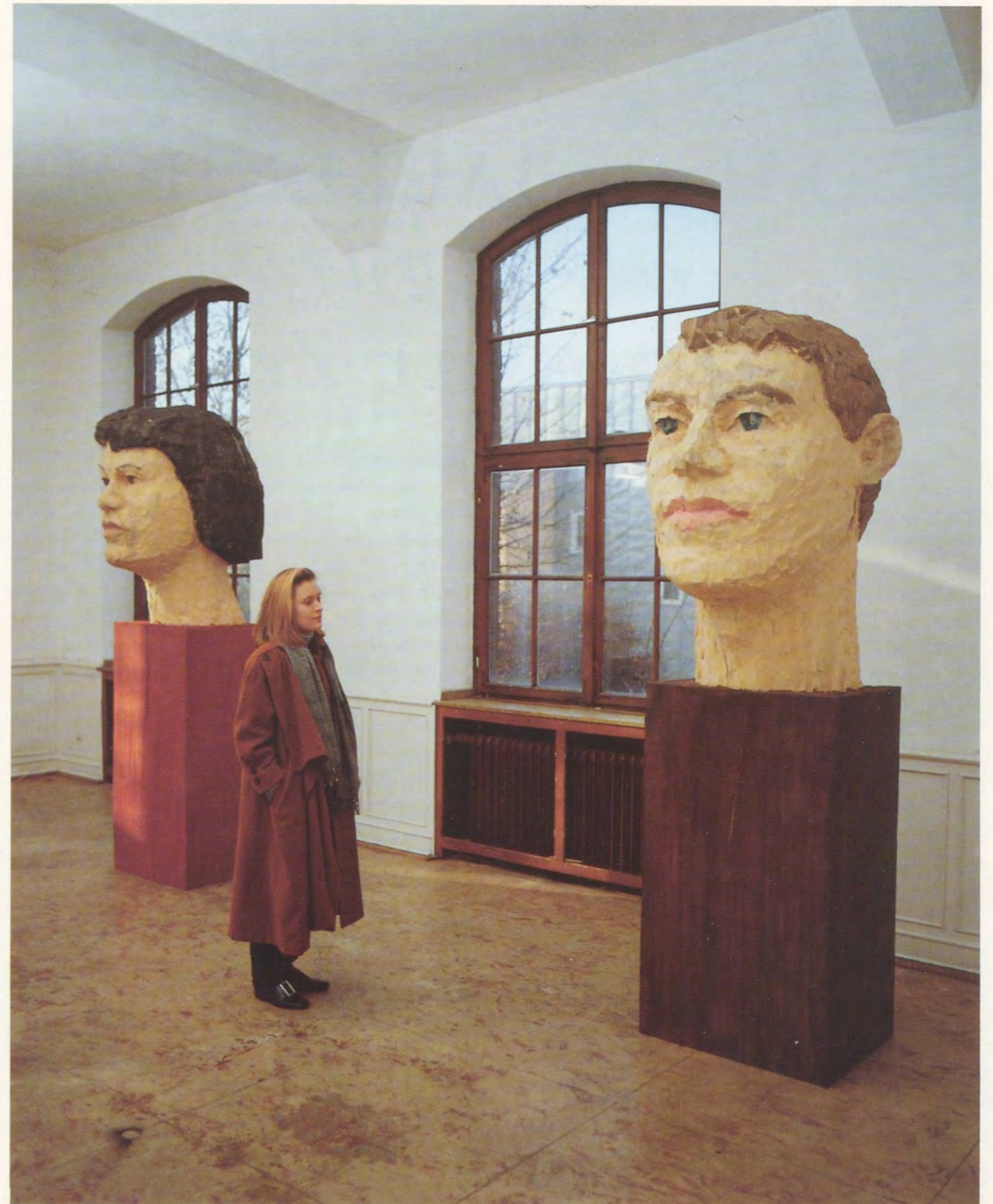
STEPHAN BALKENHOL, ZWEI GROSSE KÖPFE / TWO BIG HEADS, 1991. (INSTALLATION GALERIE LÖHRL, MÖNCHENGLADBACH)