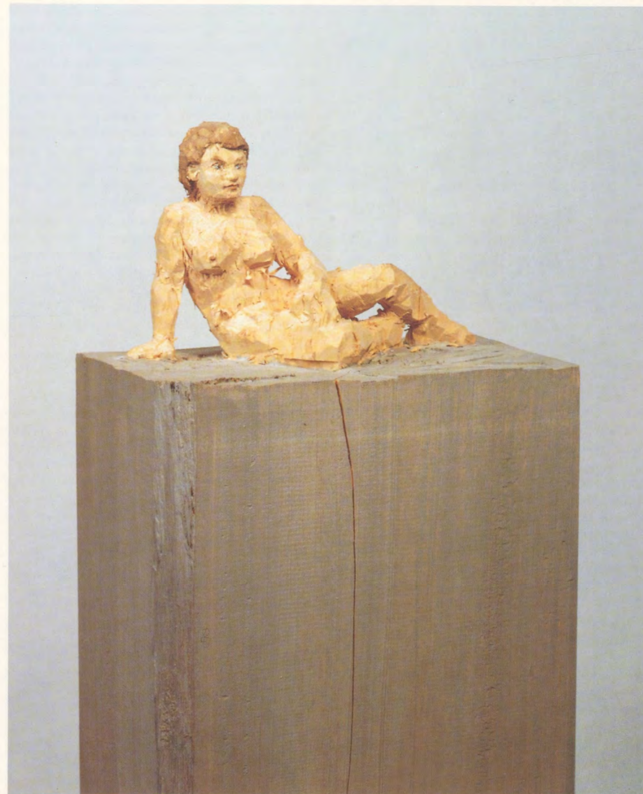
STEPHAN BALKENHOL, LIEGENDE FRAU aus einer Gruppe von 10 Skulpturensäulen, 1992, Wawaholz gefasst, ca. 150 cm / RECLINING WOMAN out of a group of 10 sculpture columns, 1992, polychromed wawua wood, ca. 59".

Balkenhol's small-scale work suggests contemporary practice in surprising ways, but it may be public sculpture which provides the most compelling format for his vision. Although (or perhaps because) his subjects are so ordinary, Balkenhol prefers to place his sculpture in close proximity to architecture. Invited to contribute outdoor sculptures to the Stadelgarten in Frankfurt in 1991, he placed three figures on public view, two of them—a man and a woman—in small, tightly enclosed stone cells in the center of