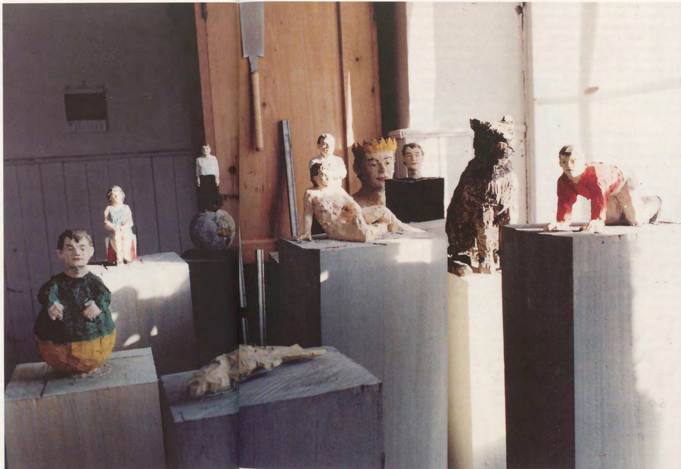
STEPHAN BALKENHOL, 10 SKULPTURENSÄULEN, 1992,

Balkenhol's Tierskulpturen wirken auf viele besonders verstörend. Er hat eine ganze Menagerie fast ausschliesslich miniaturisierter Tiere geschaffen: Bären, Giraffen, Pferde, Löwen, Pinguine und Schnecken. Balkenhol's Tiere erinnern an das Schaffen akademischer animaliers, Bildhauer, die sich