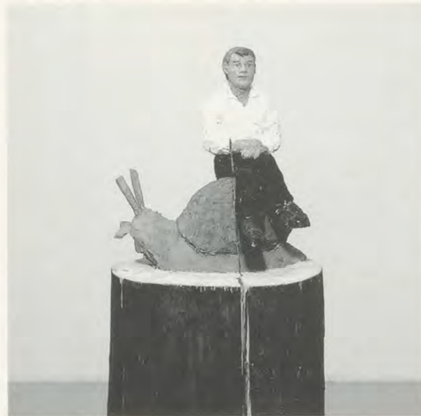
STEPHAN BALKENHOL, MANN MIT SCHNECKE, 1991, Nadelholz gefasst, 157 cm / MAN WITH SNAIL, 1991, polychromed soft wood, 61 7/8".

the garden, and the third—another man—in one of four blank niches on the rear facade of the Städtische Galerie. Unencumbered by the age-old expectation that only celebrated historical figures—actors on the world's stage—may be enshrined in prominent public sculptures, Balkenhol's red-shirted man in the street stands with characteristic modesty, hands at his sides, a simple witness. The result is a fascinating combination: On the one hand, Balkenhol engages in a lively dialogue with sculpture's history, submitting himself and his work to this most time-honored of sculptural tasks; on the other, he good-naturedly retires the idea that figurative outdoor sculpture must possess an active public purpose. 9)