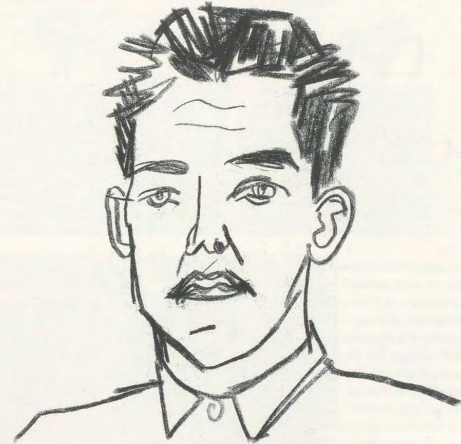
STEPHAN BALKENHOL, OHNE TITEL, 1989, Farbstiftzeichnung. Originalgröße / UNTITLED, 1989, pencil drawing, original size.