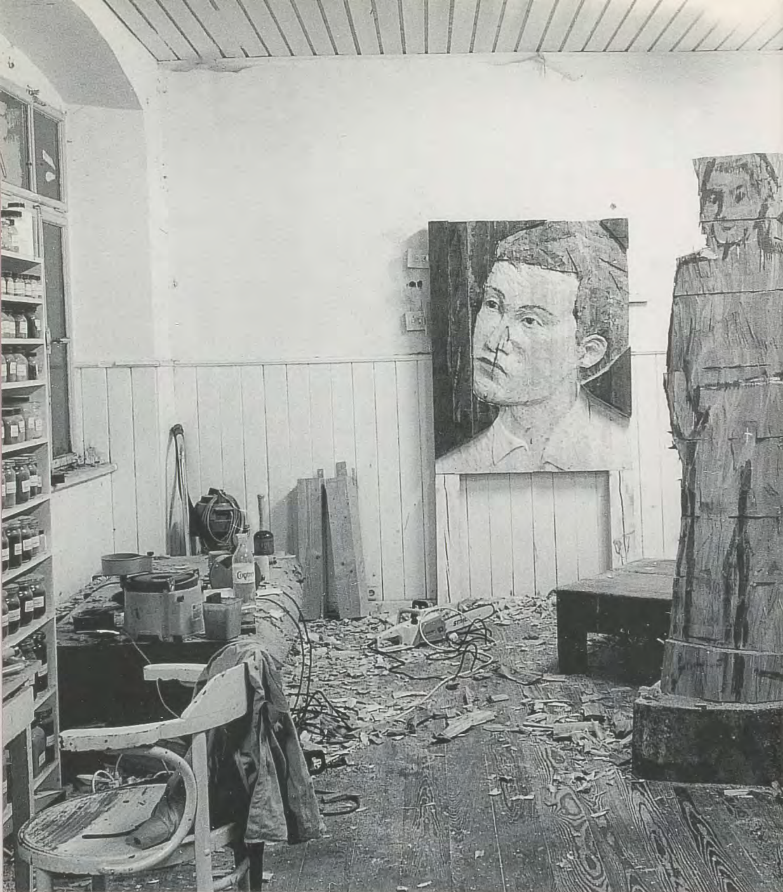
STEPHAN BALKENHOLS ATELIER IN EDELBACH, 1991.

Since 1983, Balkenhol has developed the approach that has characterized his work of the past decade. Initially he made wood sculptures that were rough-