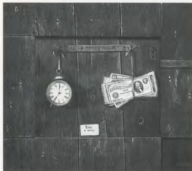
FERDINAND DANTON JR., TIME IS MONEY , 1894, oil on canvas, 16 7/8 x 21 1/8" / Öl auf Leinwand, 42,9 x 53,7 cm.

In Artschwager's paintings scratches or squiggles of tone hover on textured Celotex panels, forming a static of lines—as if one could draw just as well with wire brush or steel wool as with an artist's brush or a crayon. The texture is not really part of the drawing but of the ground. Where Max Ernst once rubbed