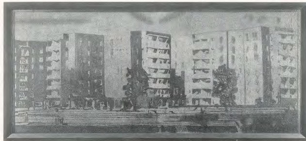
RICHARD ARTSCHWAGER, LEFRAK CITY, 1962, acrylic on Celotex, Formica frame, 44½ x 97½" / Acryl auf Celotex, Formicarahmen, 113 x 248 cm.

Dieses Beispiel illustriert nicht nur das Schicksal aller Statussymbole, sondern auch unseren Appetit auf Farb- und Berührungsflächen. Sie gehören inzwischen so vollständig zum Charakter industrieller Produkte, dass Textur und Farbton selber kaum mehr als Pfande natürlicher Materialien, sondern eben gerade als industrielle Reproduktionen ihrer Texturen erscheinen. Ihre Wirkung ist ebenso berechnet wie die Verwendung irgendeines anderen Bestandteils, ja über die Jahrzehnte sind die Repro-