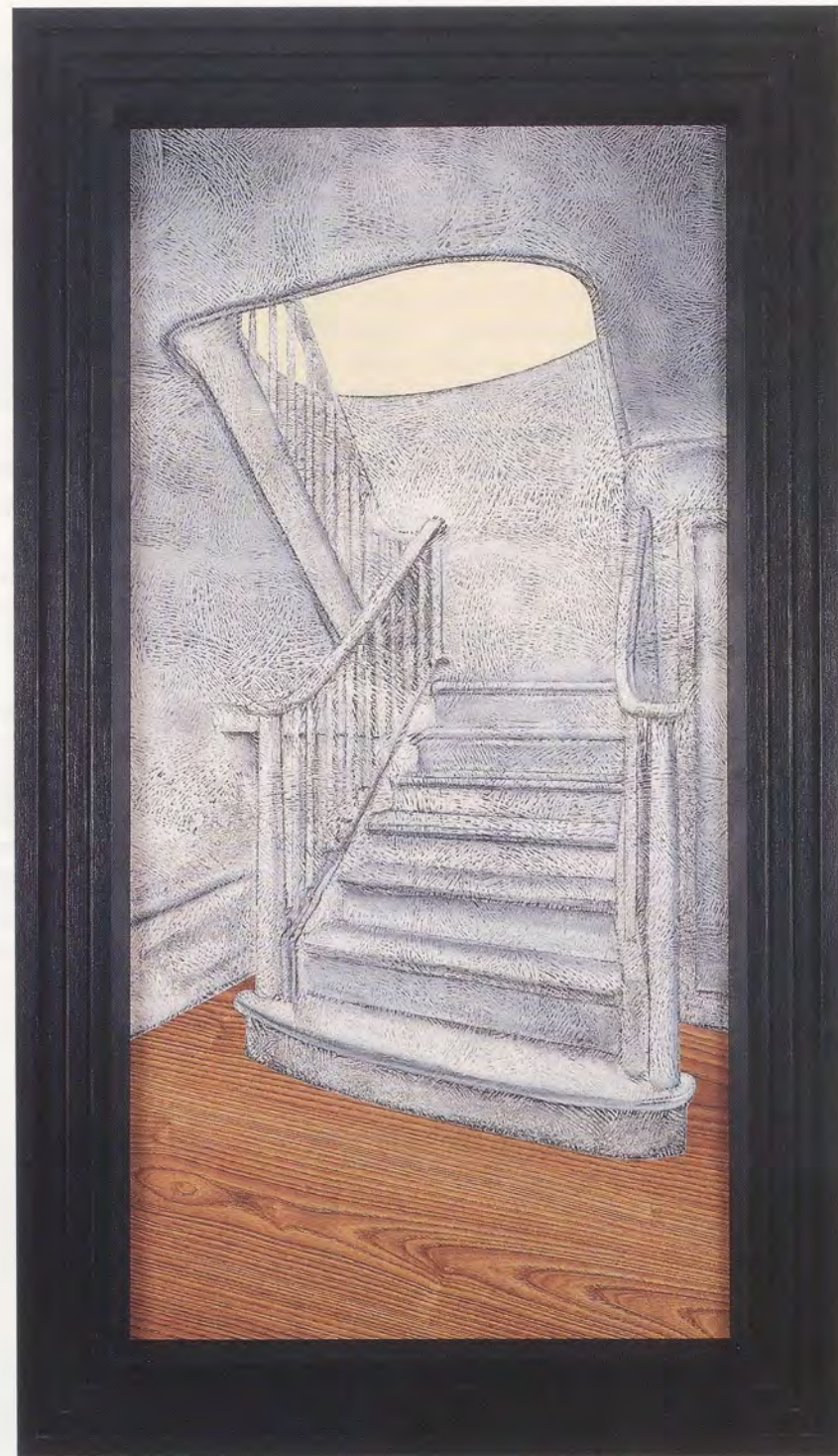
RICHARD ARTSCHWAGER, EXIT, 1993-94, final state, acrylic on Celotex, wood, 55½ x 32" / AUSGANG, Endzustand, Acryl auf Celotex, Holz, 141 x 81,3 cm.