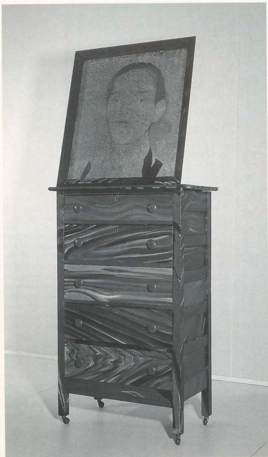
RICHARD ARTSCHWAGER, PORTRAIT I, 1962, acrylic on wood and Celotex, 74 x 26 x 12" / Acryl auf Holz und Celotex, 188 x 66 x 30,5 cm.

their imitations. For it is in the nature of reproductions that—paradoxical though it may seem—they display the features of their originals more pithily, more selectively, and more purposefully than the originals themselves. For many centuries, painting aimed to imitate optical appearances, so it ought to come as no surprise to find that something of the depiction has rubbed off on the objects depicted. An unbroken tradition of simulated material textures runs from the painted, fictive architecture on the facades of Renaissance buildings to the Baroque marbling effects on eighteenth-century wooden farmhouse furniture.