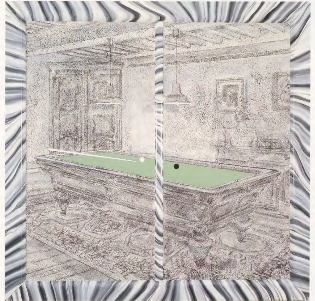
RICHARD ARTSCHWAGER, POSSIBLE SCRATCH, 1993, acrylic on Celotex, Formica on wood, 54 x 56" / MÖGLICHER FEHLSTOSS, 137,2 x 142,2 cm.