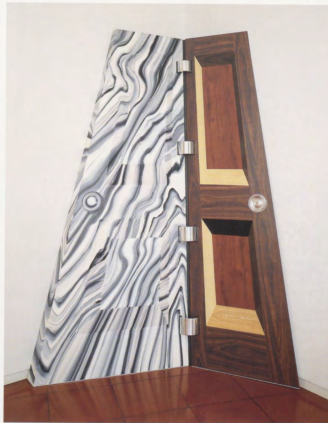
RICHARD ARTSCHWAGER, DOOR , 1992, Formica and acrylic on wood, 95 x 74 x 4 1/2" / TÜR , Formica und Acryl auf Holz, 241 x 188 x 11,4 cm.