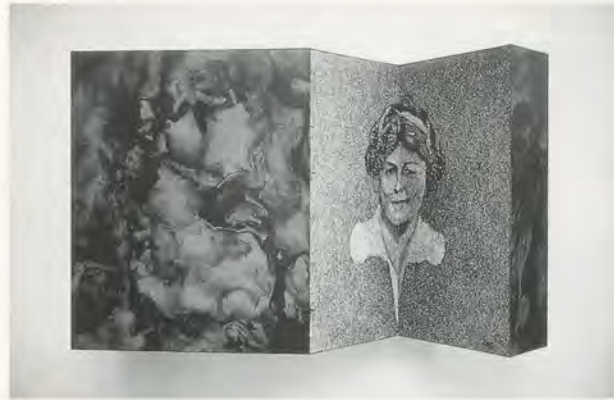
RICHARD ARTSCHWAGER, DIPTYCH II, 1967. acrylic, Celotex, Formica, wood, 20 x 32½ x 9½" / Acryl, Celotex, Formica, Holz, 51 x 82,5 x 24 cm.

eine Weckuhr und ein Bündel Banknoten an zwei Nägeln baumeln lässt, so fordert er mit Hilfe des eingekerbten Wortes «is» zum Entziffern des Rebus 3) «Time is Money» heraus.