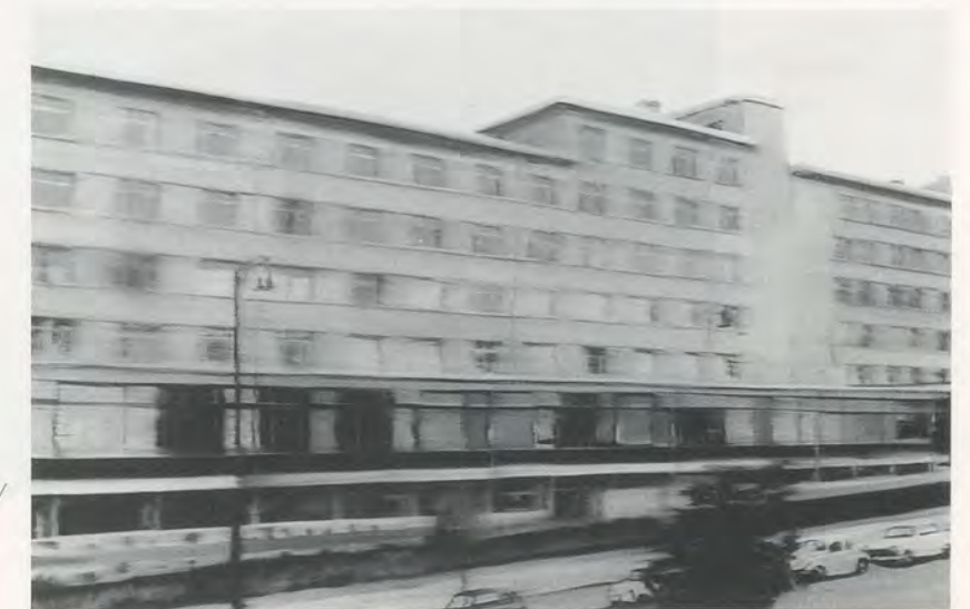
GERHARD RICHTER, ADMINISTRATION BUILDING, 1964, oil on canvas, 38⅞ x 59" / VERWALTUNGSGEBÄUDE, Öl auf Leinwand, 98 x 150 cm.