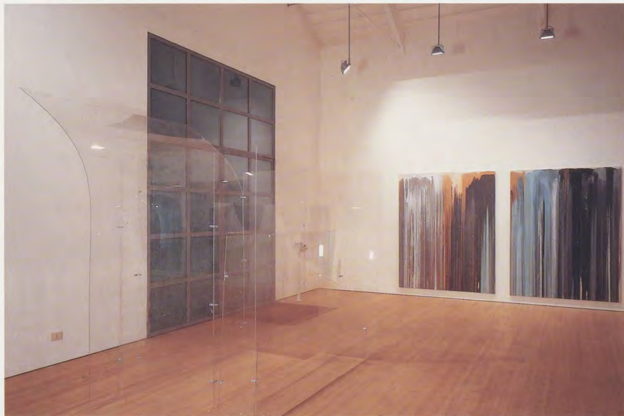
JOHN M ARMLEDER, LABYRINTH, 1995, Perspex sculpture, ca. 157½ x 157½ x 118⅛" / 400 x 400 x 300 cm; POUR PAINTINGS, 1995, mixed media, 98⅞ x 78¾" each / je 250 x 200 cm. Massimo de Carlo, Milano, 1995.

so in Widerspruch zum scheinbaren Formalismus der neuen FURNITURE SCULPTURES. Eine andere, speziell für diese Ausstellung entstandene Arbeit ohne Titel bestand aus mehreren, an Deckenbalken befestigten Schaukelstangen, an denen noch Erd- und Zementbrocken hingen; auch sie erinnerte nur noch vage an die geometrische Eleganz seiner Werke der 80er Jahre, eine Erinnerung, die zusätzlich erschwert wurde durch den bedrohlichen Aspekt des Werkes (der Betrachter musste ständig fürchten, sich an der verwirrenden Konstruktion den Kopf zu stossen). Die Arbeit schien dafür die angesprochene Entwurzelung zu thematisieren. In Wirklichkeit stehen diese «anderen» Skulpturen in engem Zusammenhang mit einem weniger bekannten Ausschnitt aus John Armladers Schaffen, jenem der Ecart-Gruppe, in deren Arbeiten solche «anti-formalistischen» Grund-