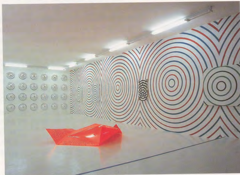
JOHN M ARMLEDER, exhibition views at Art & Public, Geneva, 1996/97, including: LIBERTY DOME (FURNITURE SCULPTURE), 1996, reflecting Perspex installation; UNTITLED, 1996, red Perspex sculpture, 46 7/8 x 38 7/8"; UNTITLED, 1996, painted wall with acrylic paintings on canvas / Ausstellung bei Art & Public, Genf 1996/97, u. a. mit: FREIHEITSKUPPEL (FURNITURE SCULPTURE), spiegelnde Perspex-Installation; OHNE TITEL, rote Perspex-Skulptur, 119 x 98 cm; OHNE TITEL, Wandmalerei und Acrylbilder auf Leinwand.