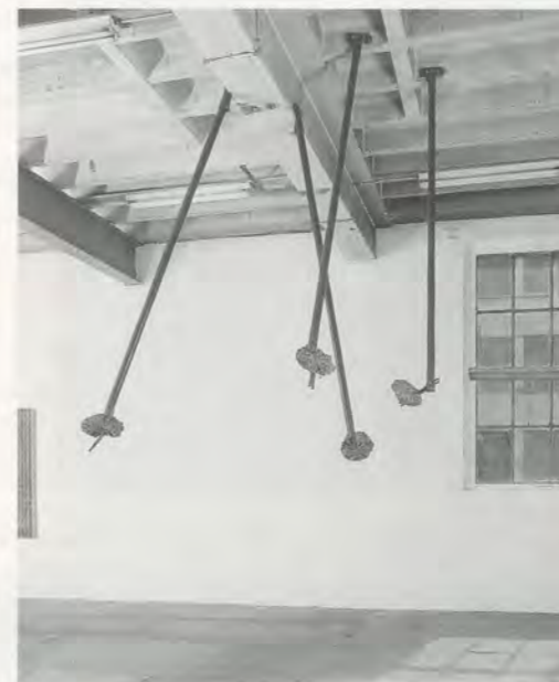
JOHN M ARMLEDER, UNTITLED (FURNITURE SCULPTURE), 1994, iron and mortar, dimensions variable / OHNE TITEL (FURNITURE SCULPTURE), Eisen und Mörtel, Grösse variabel, Installation bei Art & Public, Genf.

und dabei verschiedene Werke entdecken sollte. Für die Ausstellung in Dijon erhielten die mit der Realisation beauftragten Angestellten der Stadt Tatlins Pläne und Armladers Projektskizze, um so das Turmgerüst aus Stahlrohren zu erstellen. Das Programm wurde so zu einer realen Skulptur mit übertragener Bedeutung, einem Gestell zur Präsentation von Werken und einem die Wahrnehmung des Betrachters konditionierenden Apparat. Von Tatlin war nur die Schräglage und der seitliche Eingang geblieben sowie die sich nach oben verjüngende Dreistöckigkeit. Von ganz oben, etwa aus vier Meter Höhe, sah der Betrachter auf ein Bild aus der Serie POUR PAINTINGS (Schüttbilder) hinunter. Ähnliche Bilder befanden sich auch beidseitig entlang den Geländern des Gerüsts. Nur ein paar Neonröhren störten die geradlinige Ausrichtung des Ganzen, eine Reminiszenz an