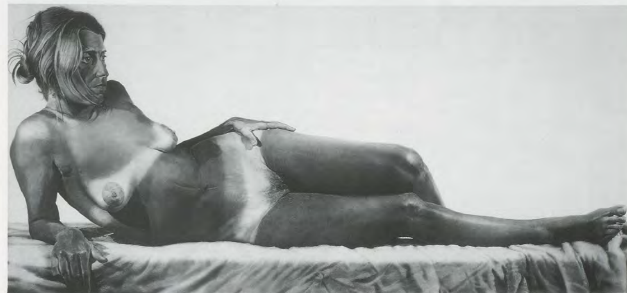
CHUCK CLOSE, BIG NUDE , 1967, oil on canvas, 117 x 253" / GROSSER AKT , Öl auf Leinwand, 297,2 x 642,6 cm.

E P: I saw this in the background of a photo of you and I was trying to figure