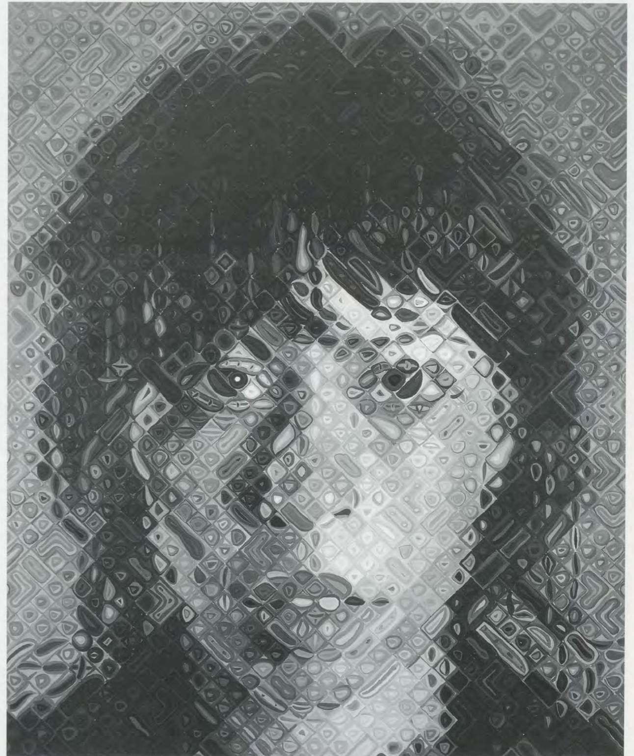
CHUCK CLOSE, CECILY, 2000, oil on canvas, 112 x 84" / Öl auf Leinwand, 284,5 x 213,4 cm.

CC: Well, paintings have changed my life. I don't think art is a very good propagandizing tool or educational tool. We no longer fill churches with imagery to make people feel closer to their God. But art is my religion; it's the thing that matters to me. Of course, as an artist, you have to be arrogant enough to think that you have something to say that somebody else might