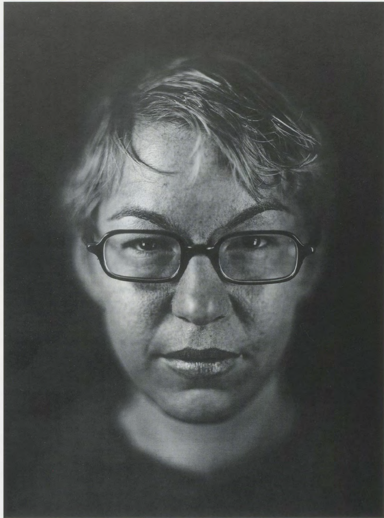
CHUCK CLOSE, ELIZABETH PEYTON, 2000, daguerreotype, 15 1/2 x 12" / Daguerrreotypie, 39,4 x 30,5 cm.