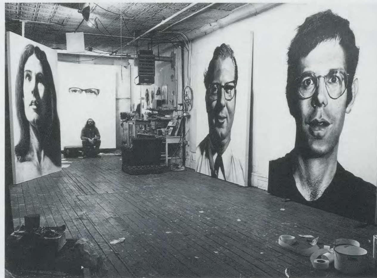
Chuck Close in his Greene Street studio in 1970 with paintings of NANCY, 1968, KEITH (unfinished), JOE, 1969, and BOB, 1969–70 / Chuck Close mit Bildern im Atelier an der Greene Street, 1970.

EP: I've always thought about how they will never be like that again. There's a huge loss in that moment's passing. I wonder if I'll be painting wrinkles. They've gotten in there just by chance, by moving the brush the