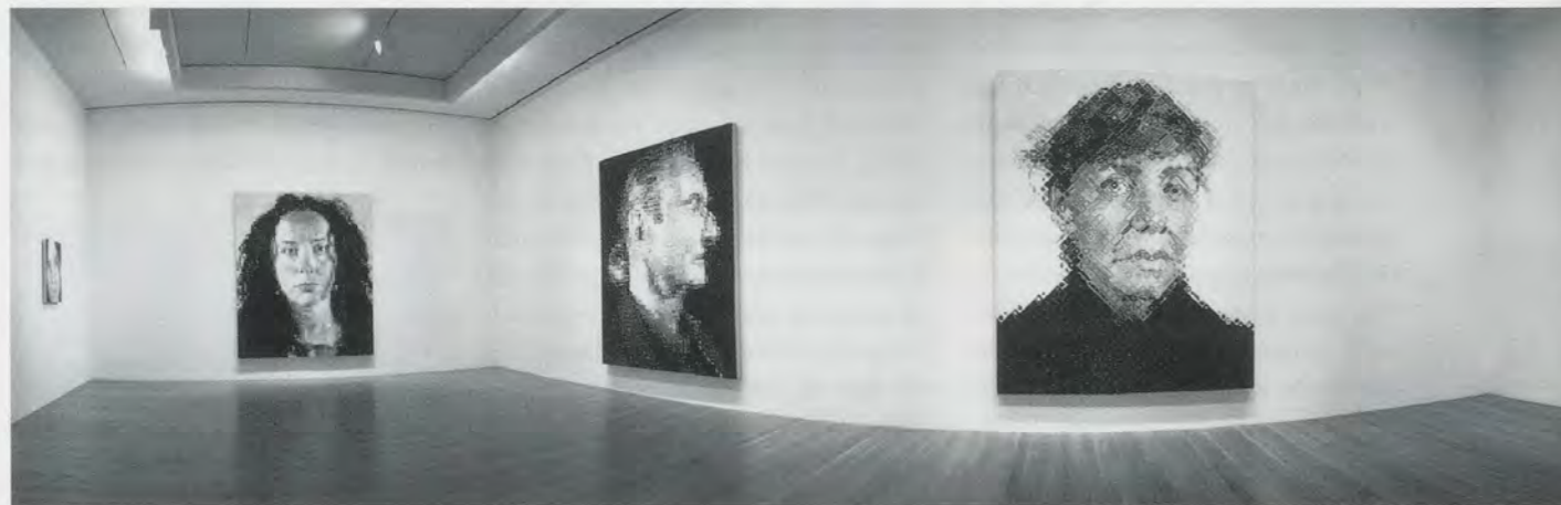
Chuck Close at his retrospective, Museum of Modern Art, New York, 1998. /