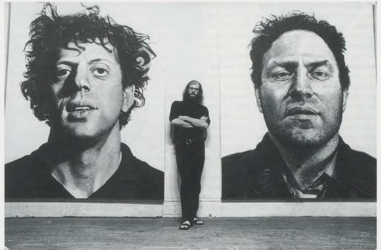
Chuck Close in his Greene Street studio, 1969, with PHIL and RICHARD, both 1969/ im Atelier an der Greene Street mit den Bildern PHIL und RICHARD.

CC: Mir war immer das gründliche Durcharbeiten des Ganzen wichtig, das ganze Rechteck. Das führte zu dieser Arbeit mit Punkten, Strichen und seltsamen Formen, zu Flächenteilen, die psychologisch völlig unbelastet sind.