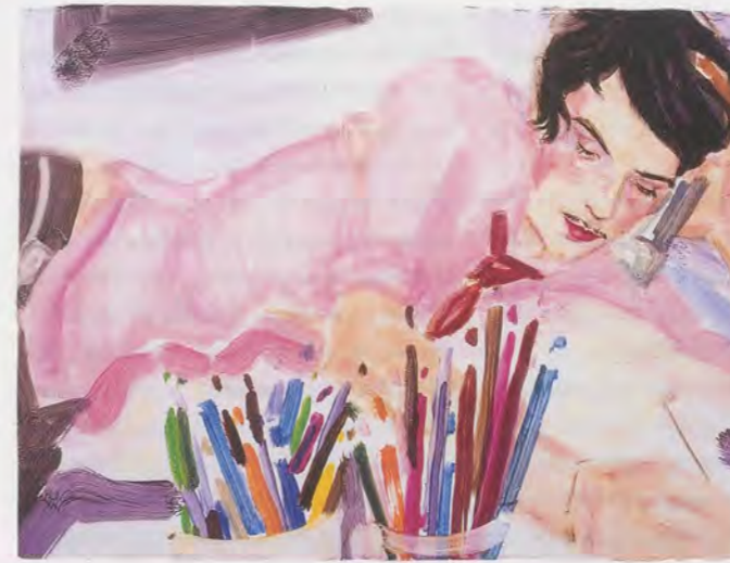
ELIZABETH PEYTON, SPENCER DRAWING, 1999, oil on MDF, 9 1/4 x 12" / SPENCER BEIM ZEICHNEN, Öl auf MDF, 23,5 x 30,5 cm.