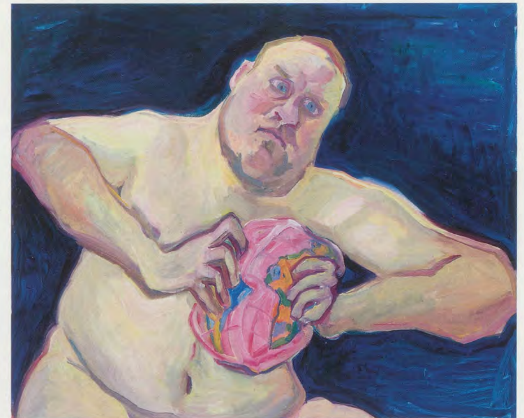
MARIA LASSNIG, THE WORLD DESTROYER , 2001, oil on canvas, 39 1/4 x 49 1/4" / DER WELTZERTRÜMMERER, Öl auf Leinwand, 100 x 125 cm.