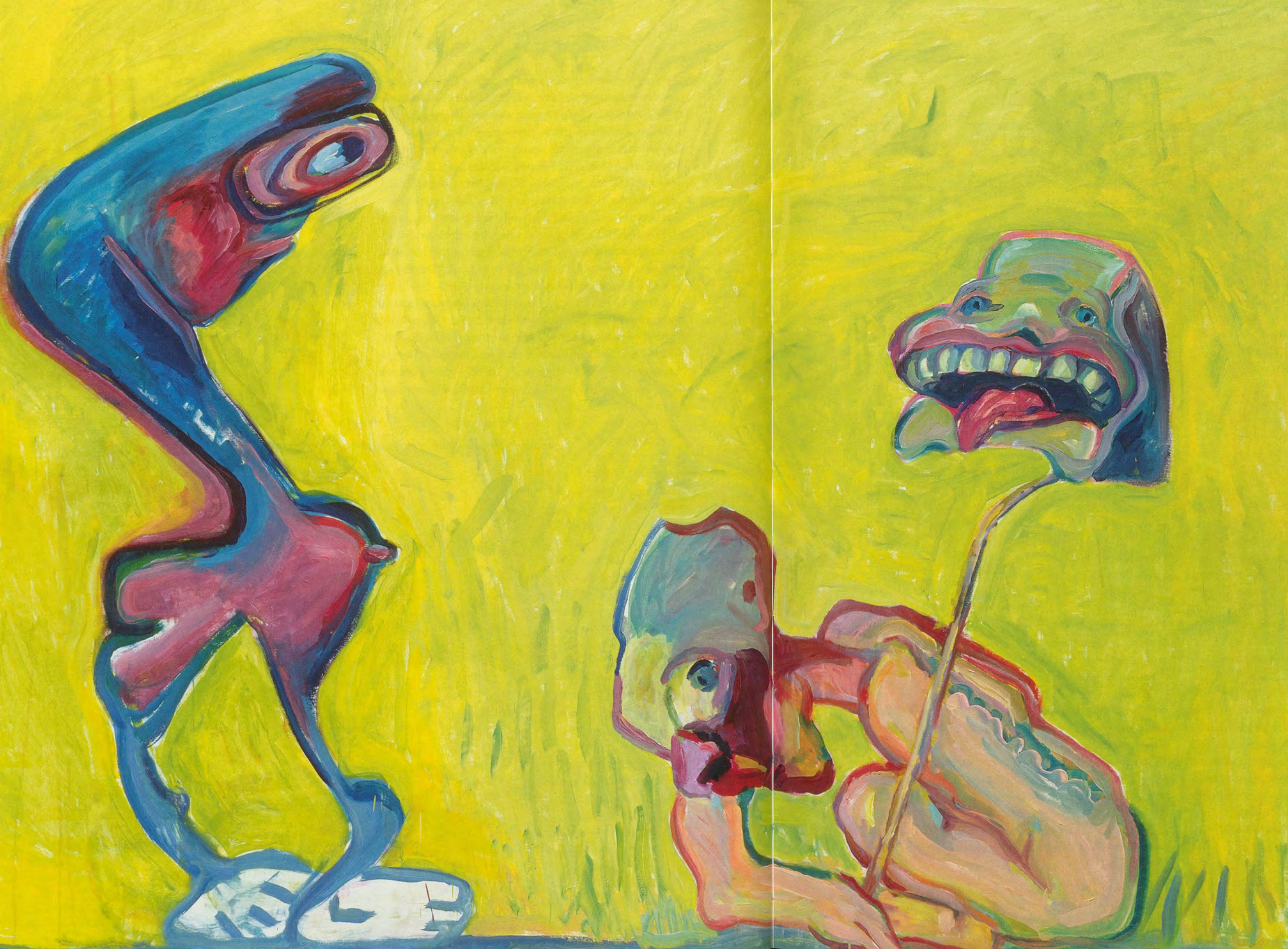
MARIA LASSNIG, PHOTOGRAPHY AGAINST PAINTING, 2005, oil on canvas, 59 x 78 3/4" / PHOTOGRAPHIE GEGEN MALEREI, Öl auf Leinwand, 150 x 200 cm.