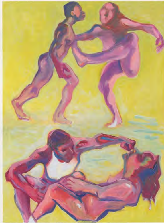
MARIA LASSNIG, ADAM AND EVE IN QUARREL, 2005, oil on canvas, 80 1/4 x 60 1/2" / ADAM UND EVA IM ZWIST, Öl auf Leinwand, 204 x 154 cm.

In den 50er-Jahren experimentierte Lassnig durchgehend mit sehr lebendigen, aufs Wesentliche