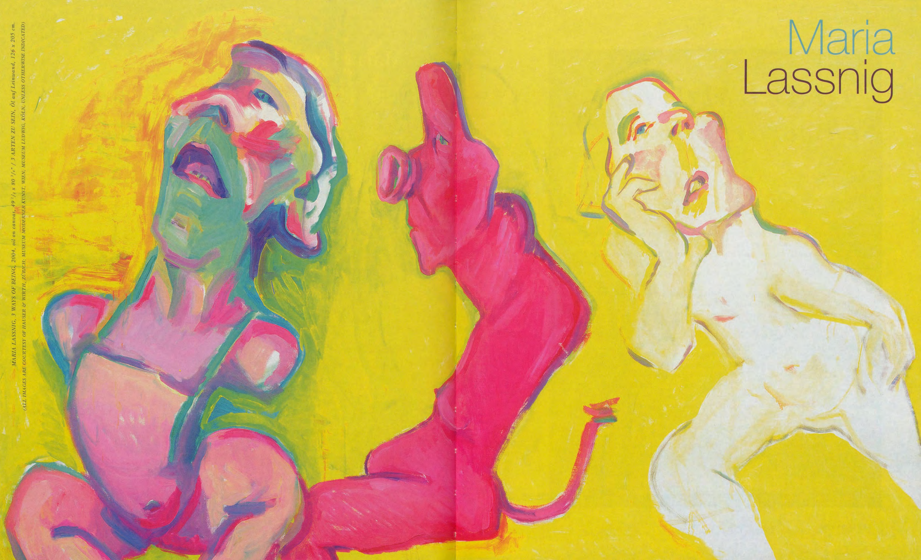
MARIA LASSNIG, 3 WAYS OF BEING, 2004, oil on canvas, 49 1/2 x 80 3/4" / 3 ARTEN ZU SEIN, Öl auf Leinwand, 126 x 205 cm.