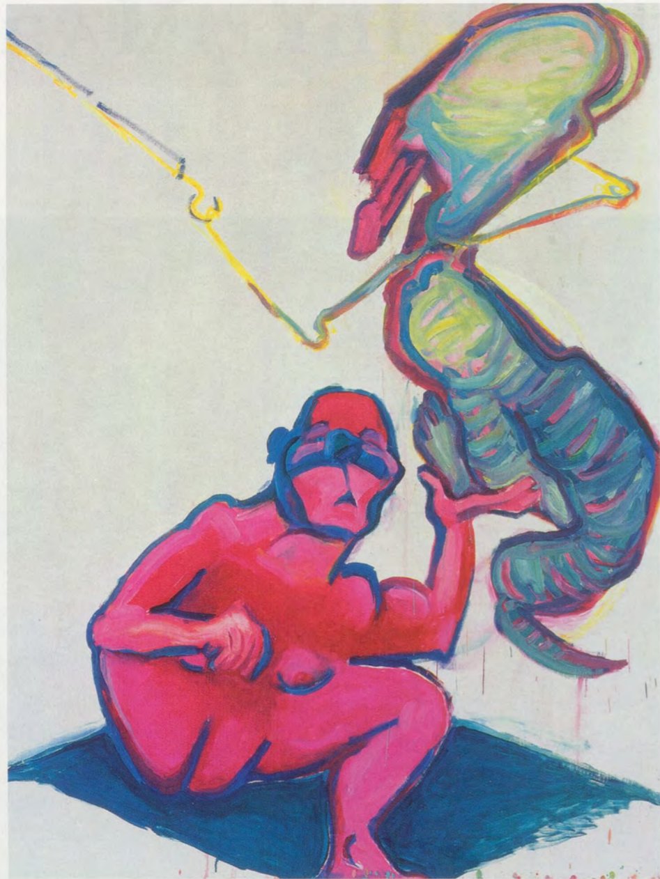
MARIA LASSNIG, SELF WITH DRAGON , 2005, oil on canvas, 78 3/4 x 59" / SELBST MIT DRACHEN, Öl auf Leinwand, 200 x 150 cm.

doux and Brecht created remains the final obstacle. That Lassnig is indeed charming and frequently coquettish compounds the problem to the extent that inattentive observers may be tempted to underestimate both her humor and her fury, not to mention an unabated anguish that is palpably embodied in her work though often whimsically expressed.