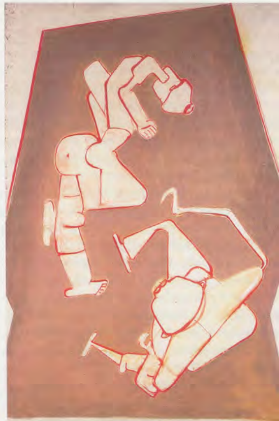
MARIA LASSNIG, SCIENCE-FICTION, 1963, oil on canvas, 76 1/4 x 51 1/4" / Öl auf Leinwand, 194 x 130 cm. (COLLECTION DR. KOSAK, BADEN)

konfrontiert waren, noch zusätzlich.) Doch selbst die beinahe schmerzhaft einfachen Bilder dieser Zeit haben etwas Unheimliches. Wenn Lassnig mit einer Hand-Filmkamera posiert, die jeden Moment zur Prothese zu werden droht, vollziehen unsere kinomentalen Synapsen gleich den sprunghaften Schnitt zu David Cronenbergs Videodrome , obwohl der biotisch malträtierte Protagonist, den James Wood in diesem Film spielt, bewegte Bilder konsumiert, während Lassnig als lebendes Stativ ihrer Bolex Bilder produziert.