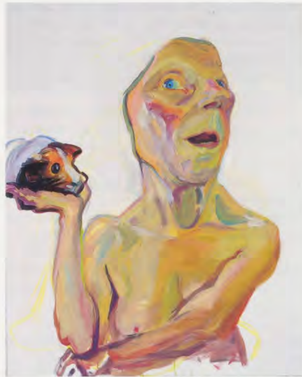
MARIA LASSNIG, SELF WITH GUINEA PIG , 2000/2001, oil on canvas, 49 1/4 x 39 1/4" / SELBST MIT MEERSCHWEINCHEN, Öl auf Leinwand, 125 x 100 cm.

Science fiction, by contrast, was able to imagine the species as one of many, and perhaps the least likely to endure in any contest for survival among the fittest that allowed mutants and robots to participate. Not the least of the harbingers of the art world vogue for sci-fi was the appearance of Robby the Robot—pseudo-mechanical “star” of the outer space thriller Forbidden Planet —in the seminal proto-pop exhibition “This is Tomorrow” at the Whitechapel Art Gallery in London in 1956. Organized by the Independent Group, which included architectural theorist Reyner Banham, curator and critic Lawrence Alloway, and artists Richard Hamilton and Eduardo Paolozzi, “This is Tomorrow” was among the rare avant-garde shows that actually foresaw the future—albeit the future of art as a product of commodity culture rather than the future of mankind as machine. Of course, Paolozzi’s sculptures of the late fifties and early six-