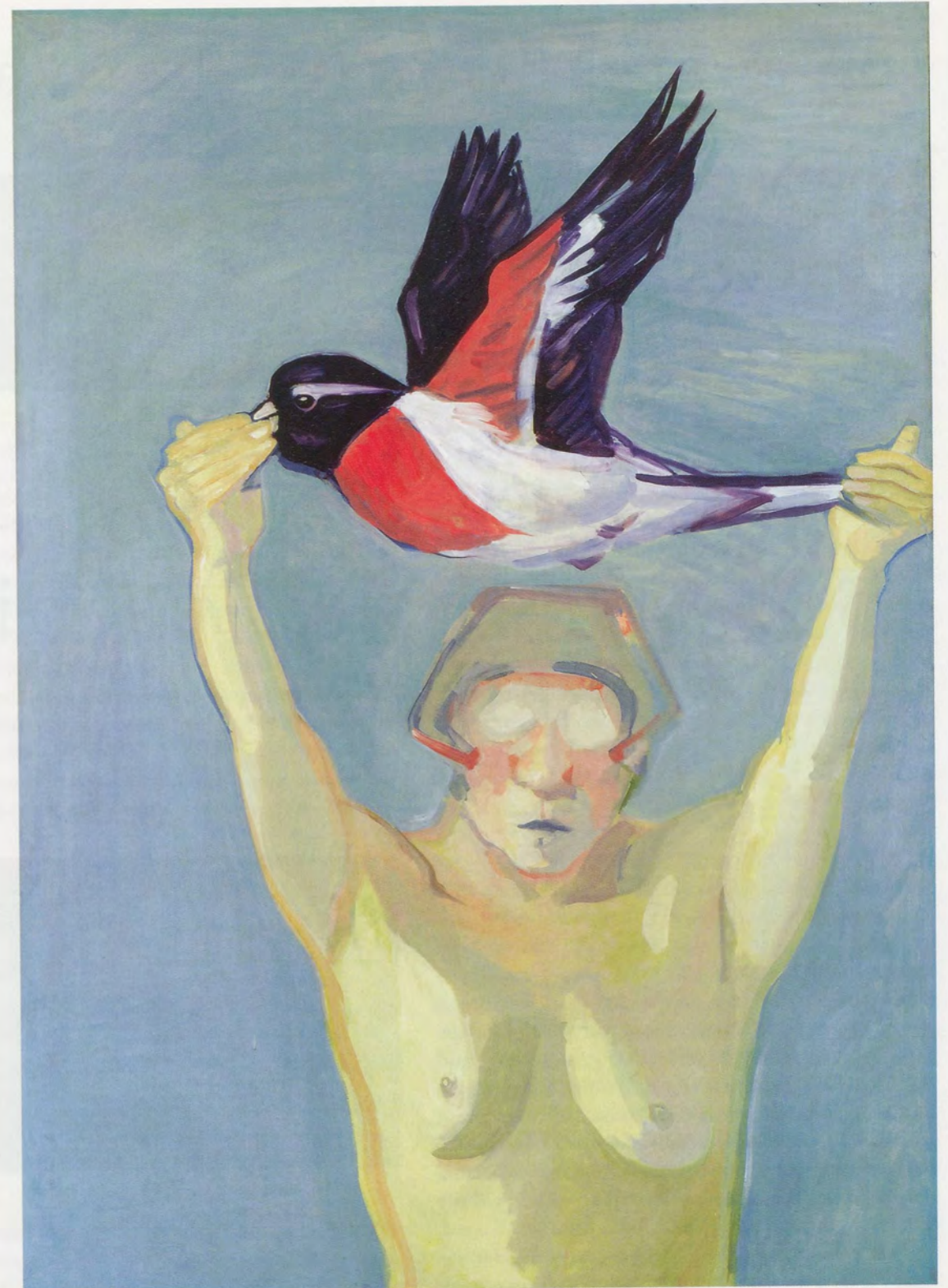
MARIA LASSNIG, LEARNING TO FLY, 1976, tempera on canvas, 69 3/4 x 67 1/4" / FLIEGEN LERNEN, Tempera auf Leinwand, 177 x 172 cm.