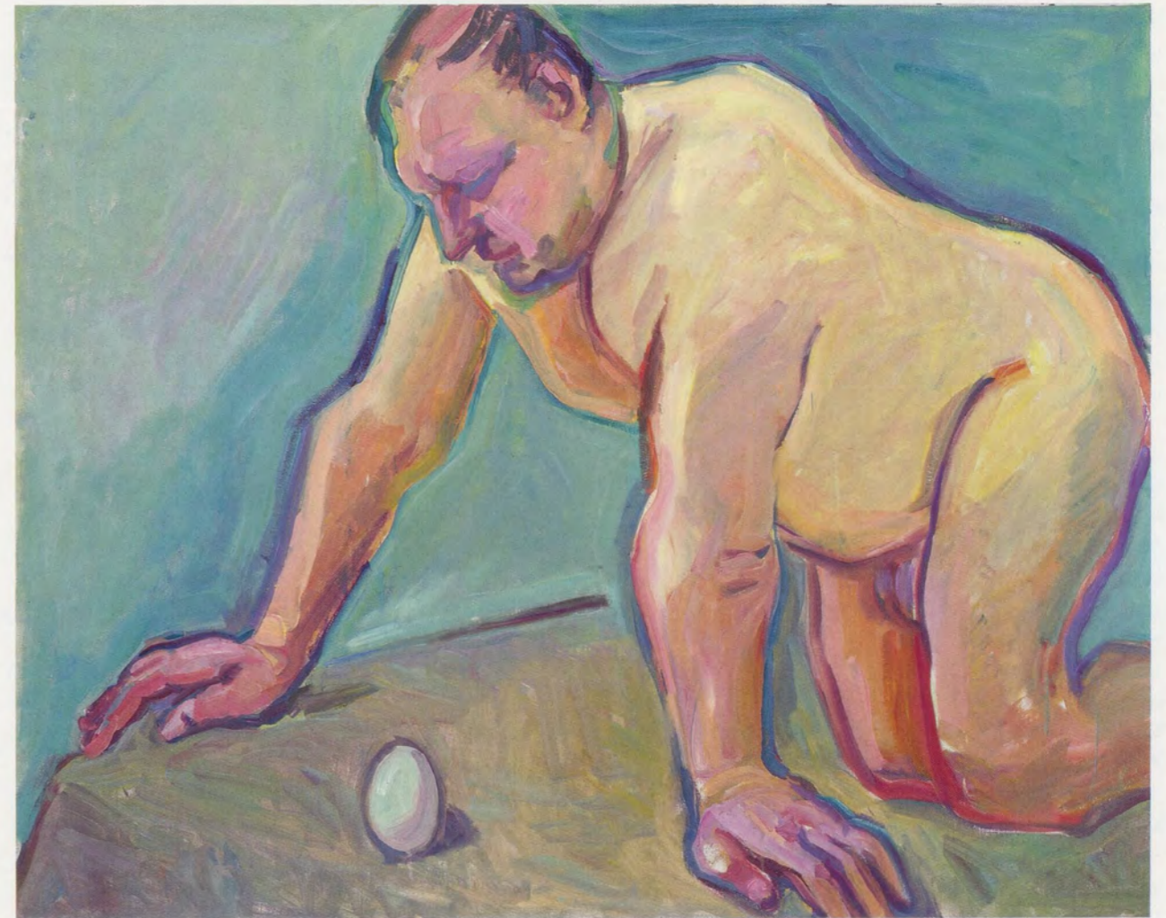
MARIA LASSNIG, THE BIOLOGIST, 2003, oil on canvas, 39 1/4 x 49 1/4" / DER BIOLOGE, Öl auf Leinwand, 100 x 125 cm.