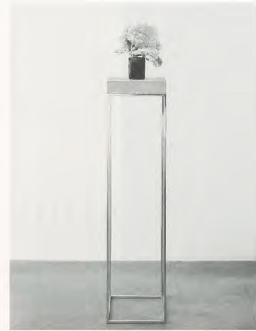
CAROL BOVE, CORAL SCULPTURE, 2008, coral, driftwood, concrete, bronze, 61 x 12 x 12" / KORALLENSKULPTUR, Koralle, Treibholz, Beton, Bronze, 154,9 x 30,5 x 30,5 cm.