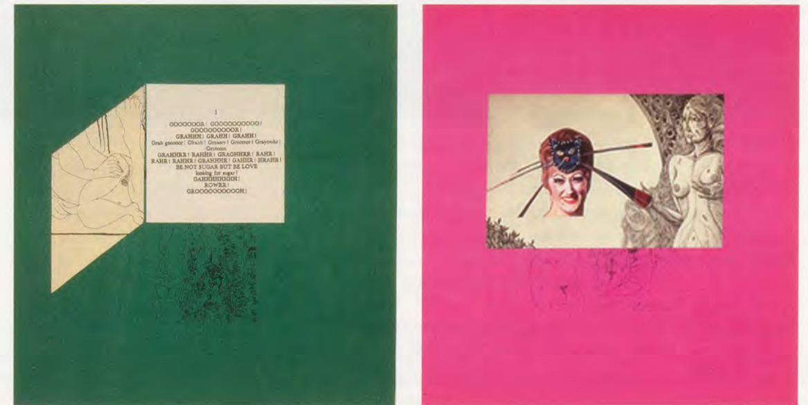
CAROL BOVE, GOOOOOOR! GOOOOOOOOO! GOOOOOOOO!, 2009, collage, 11 x 10 1/2" / Collage, 28 x 26,7 cm.

For Bove, you suspect, it is Surrealism's latency (not to mention its forbidden-fruit, démodé aspect, which also applies to her driftwood work) that is appealing—its capacity to serve as an optic reframing for times we think that we know. She is not alone in noting the movement's covert extension through the twentieth century: Alyce Mahon's 2005 book, Surrealism and the Politics of Eros, 1938–1968 , thoroughly unpacks the notion, going so far as to suggest that "the Surrealists' battle for revolutionary desire was recognized by those students who painted graffiti on the walls of the Sorbonne which echoed Surrealist manifestos." 4 Surrealism is also, of course, the movement of the unconscious and Bove's art concerns itself deeply with the repercussions of preconscious thought. Bove's deployment of driftwood—generally in long, spindly forms on mounts—suggests a leveling rapprochement between Minimal form and a more widespread period taste from the late hippie era; but it is more. Looking at antique décor magazines, Bove noticed a sudden prevalence of driftwood addenda in interior design. All of a sudden, it's acceptable to have a chunk of worm-nibbled wood in your lounge, something like the ones that appear in Bove's floor-bound composition THE NIGHT SKY OVER BERLIN, MARCH 2, 2006, AT 19.00 (2006) alongside concrete, Perspex