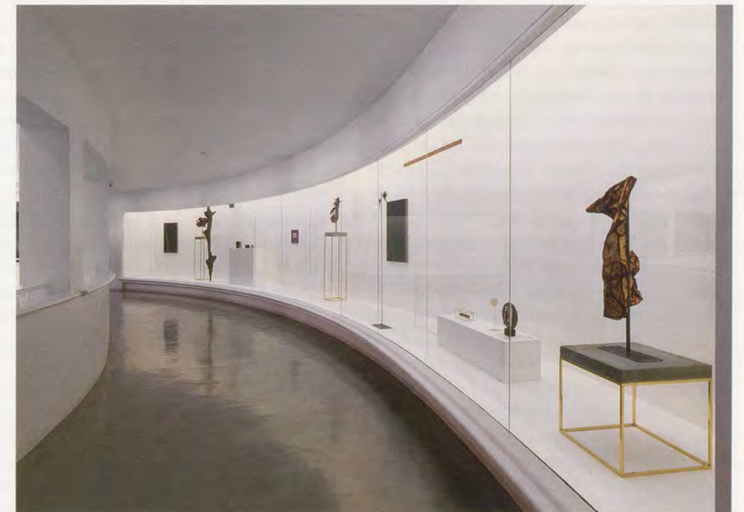
CAROL BOVE, Tate St. Ives, Cornwall, 2009 , exhibition view / Ausstellungsansicht.

Bove scheint von der Idee des Surrealismus und seinen Innovationen fasziniert zu sein, besonders wenn er als eine Art unterschwelliger Impuls auftritt – wie in den 60er-Jahren und ganz allgemein im letzten Jahrhundert. «SETTING» FOR A. POMODORO («Szenischer Rahmen» für A. Pomodoro, 2005–2007) – ein typisches Beispiel für die jüngst entstandenen, umfassenderen Objektarrangements am Boden oder auf einer Bühne – ist eine ausladende Komposition aus Bahnschwellen, spindeldürrer Treibholz, massigen Betonklötzen, der Miniaturversion einer Kugelskulptur von Arnaldo Pomodoro und – in einer späteren Version