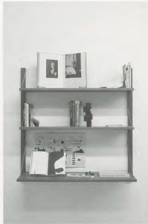
CAROL BOVE, INNERSPACE BULLSHIT , 2007, wood and metal shelves, 14 books, comic book, bronze sculpture, stone, sea shell, seeds, mirror, pamphlet, 42 x 35 x 12" / INNENRAUM-UNSINN , Holz- und Metallregale, 14 Bücher, Comic-Album, Bronzeskulptur, Stein, Muschel, Samen, Spiegel, Broschüre, 106,7 x 88,9 x 30,5 cm.

McClure ist eine Art Ikone der 60er-Jahre, aber eine in der sehr viel Beat steckt – also viele Züge der 40er- und 50er-Jahre: Er las am legendären Poesie-Abend der Gallery Six 1955 in San Francisco, wo die Beatniks zusammenfanden. (Die Drogenfreiheiten der 60er-Jahre wurden schon um die 10 Jahre früher von dieser Gruppe eingeübt, der es gelang, ihren Einfluss bis ins folgende Jahrzehnt hinein zu verlängern: nicht zuletzt durch Jack Kerouacs Muse Neal Cassady, der auch Ken Kesey's LSD-Pioniere, The Merry Pranksters, in ihrem Bus durchs Land chauffierte.) McClure weist den Leser darauf hin, dass der Zweck der fröhlichen, lautmalerschen, fast vorsprachlichen Gedichte in Ghost Tantras der sei, «Schönheit zu verbreiten und die Gestalt des Universums zu verändern», bemerkt dann aber, dass er sich unter anderem von William Blake und «den visionären Surrealisten» habe inspirieren lassen. 2) Derweil ist die in die Jahre gekommene kubistische Skulptur nicht weniger unzeitgemäss und schlüpfrig: Hier sind die 60er- von den 1910er-Jahren durchdrungen, so wie sie durch McClures klar benannte Vorgänger mit der Romantik und den surrealistischen 30er-Jahren verflochten sind; in jedem Fall sind es die Taten älterer Vorläufer, die in den 60er-Jahren weiterwirken und dafür sorgen, dass diese Zeit für frühere Perioden offen ist.