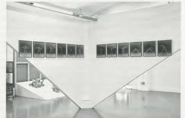
HAEGUE YANG, GYMNASTICS OF THE FOLDABLES, 2006, installation view, Modern Art Oxford / GYMNASTIK DER FALTBAAREN, Installationsansicht, 2011.

Although Yang's recent works reference art history—specifically, early twentieth-century European modernism and the avant-garde—her primary sympathy, in the instance of the Oxford exhibition, lies outside the perimeter of the discipline, in the realm of the amateurish and even dubious. The title "Teacher of Dance" (2011) is derived from the self-anointed moniker of G. I. (George Ivanovich) Gurdjieff (ca. 1866–1949), the mystic and spiritual guru who was born in Alexandropol (the then Russian Empire) at the crossroads of Russian, Greek, Armenian, Georgian, and Turkish cultures. 14 Early in life, Gurdjieff traveled throughout the Near East and Central Asia as far as Tibet and the edge of China, staying at all different kinds of religious monasteries absorbing doctrines, music, and dances. After this extensive period of travel, Gurdjieff arrived in Moscow in 1912 and started gathering students. In 1922 in Paris he founded the Institute for the Harmonious Development of Man to teach his concept called "The Fourth Way"—an allegedly balanced way to cultivate and harmonize the body, heart, and mind so as to awaken the self. He composed from memory the music he heard during his travels and also choreographed "Movements" based on the sacred dances he saw, some of which were performed from the twenties on in European