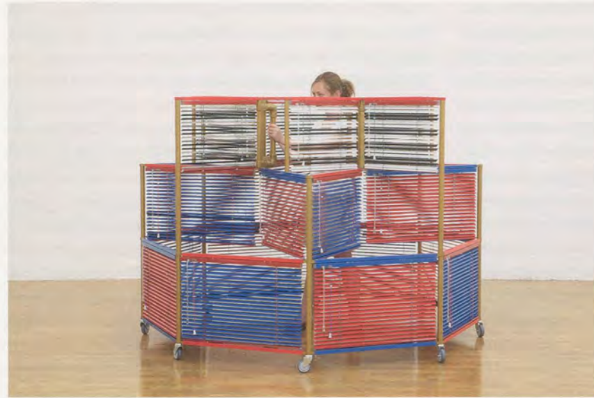
HAEGUE YANG, GOLDEN CLONING , Dress Vehicle, 2011, mobile performative sculpture, aluminum Venetian blinds, powder-coated aluminum frame, casters, magnets 59 1/4" high, 84 3/8" diameter / Kleider-Vehikel, mobile performative Skulptur, Aluminium-Jalousien, pulverbeschichteter Aluminiumrahmen, Rollen, Magnete, Höhe 150,5 cm, Durchmesser 215 cm.

begann Schüler um sich zu scharen. 1922 gründete er in Paris das Institut für die harmonische Entwicklung des Menschen , um eine Philosophie zu lehren, die er als «Vierten Weg» bezeichnete, ein angeblich ausgewogener Weg zur Kultivierung und Harmonisierung von Körper, Seele und Geist, der zur Erweckung des Selbst führen sollte. Die Musik, die er auf seinen Reisen gehört hatte, schrieb er aus der Erinnerung heraus nieder und schuf Choreographien, die auf den gesehenen sakralen Tänzen beruhten. Diese «Movements» gelangten von den 20er-Jahren an in europäischen Grossstädten und den Vereinigten Staaten zur Aufführung. Nachdem Diaghilew sie in Gurdjieffs Institut gesehen hatte, war er davon dermassen begeistert, dass er sie in die Ballets Russes aufnehmen wollte. Bei Gurdjieffs letztem Besuch in New York, 1948, sollen seine «Movements» sogar Balanchine und das New York City Ballet beeinflusst haben.