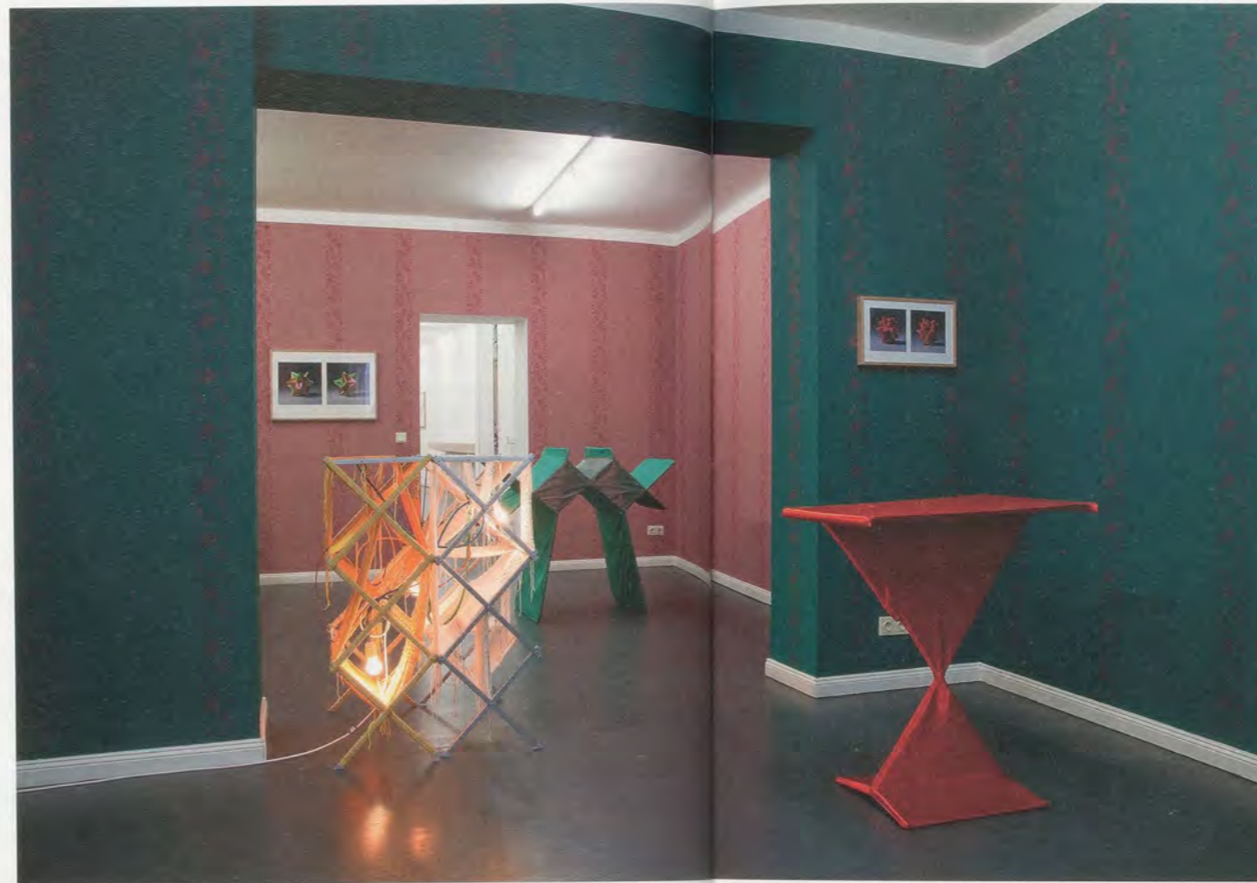
HAEGUE YANG, "Closures," 2010, exhibition view / Ausstellungsansicht Galerie Wien Lukatsch, Berlin.

With intimated themes like "kinship" of male and female, the "cycle of life," and "evolution," the previously discussed works may be seen to have an anthropological or ethnological effect. A smaller group of sculptures within the Kunsthaus Bregenz exhibition, TOTEM ROBOTS (2010), also alludes to anthropology and offers an almost structuralist binary: robot vs. human (like raw vs. cooked). Anthropology is a study of cultural expressions, dance being one of