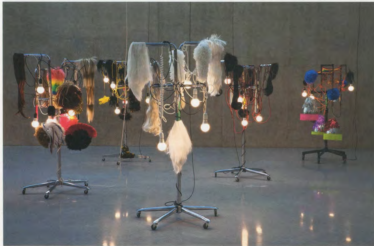
HAEGUE YANG, MEDICINE MEN, 2010, installation view, Kunsthau Bregenz / MEDIZINMÄNNER, Installationsansicht.

Die dreiunddreissig Skulpturen sind unterteilt in zwei Sechsergruppen, zwei Dreiergruppen, zwei Paare und elf Einzelfiguren. 3) Von den früheren Arbeiten unterscheiden sich die Lichtskulpturen nicht nur durch ihre Grösse und den Umfang der künstlerischen Anstrengung, sondern auch durch die unbeschränkte Freiheit der Materialkombinationen – eine schier verschwenderische Fülle. Zum Beispiel bestehen die sechs Skulpturen der FEMALE NATIVES (Weibliche Einheimische, 2010) jeweils aus einer ähnlichen Grundkomposition: einem Kleiderständer mit einer einzigen senkrechten Stützstange und fünfarmigem Drehfusskreuz auf Rollen, der oben in