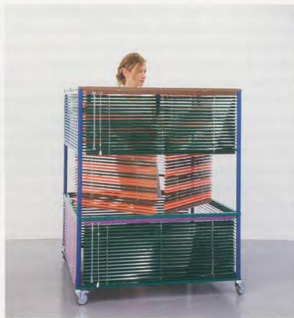
HAEGUE YANG, SQUARE HUNTER , Dress Vehicle, 2011, mobile performative sculpture, aluminum Venetian blinds, powder-coated aluminum frame, casters, magnets, 53 3/4" x 43 x 43" / Kleider-Vehikel, mobile performative Skulptur, Aluminium-Jalousien, pulverbeschichteter Aluminiumrahmen, Rollen, Magnete, 136,5 x 109 x 109 cm.

Aber warum beruft sich Yang auf diese Figur? Die Frage ist äusserst verwirrend, zumal Gurdjieff – von seinen Anhängern vergöttert und von seinen Kritikern als Scharlatan betrachtet – für gewisse Kreise von grosser Bedeutung sein mag, in der allgemeinen Kunstszene jedoch nahezu unbekannt ist. Frank Lloyd Wright, von dem man weiss, dass er von Gurdjieff beeinflusst war, sah in ihm die Figur, die (im