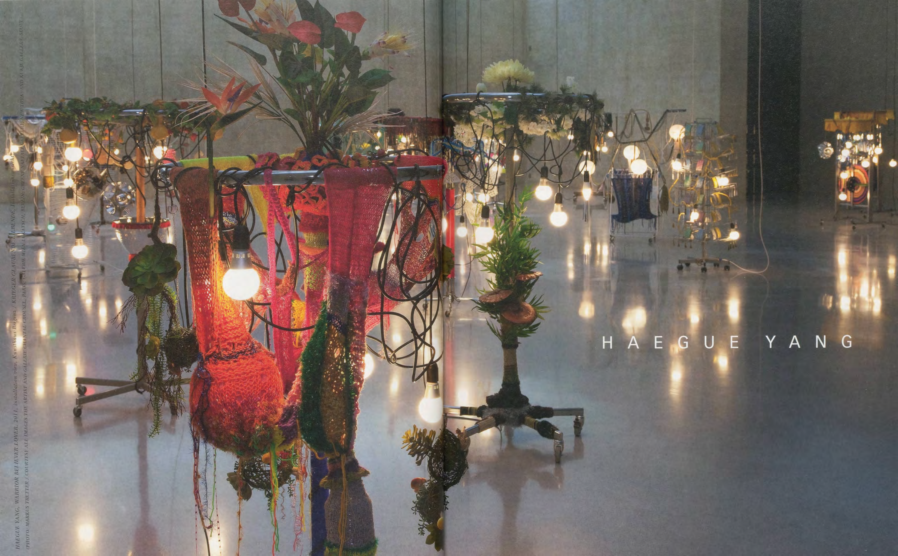
HAEGUE YANG, WARRIOR BELIEVER LOVER, 2011, installation view, Kunsthauß Bregenz / KRIEGER GLAUBENDE LIEBENDE, Installationsskizze