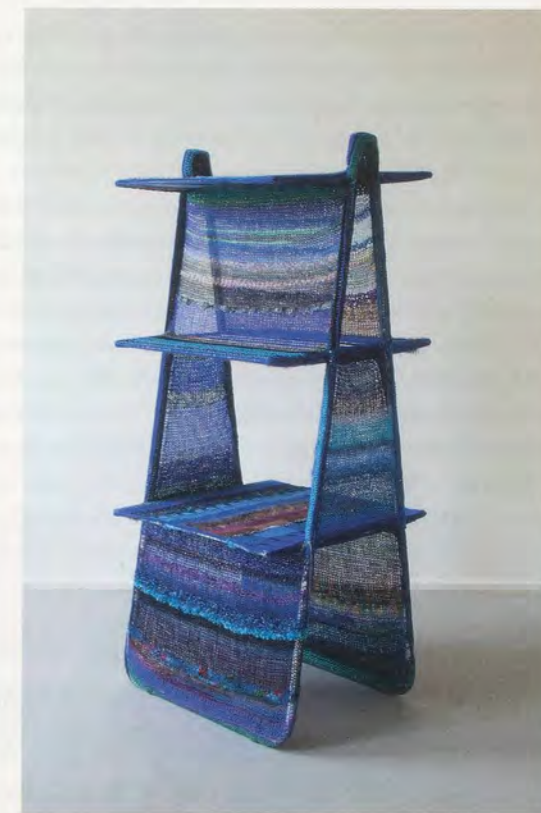
HAEGUE YANG, LA TOUR BLEUE, Non-Indépliable, 2010, drying rack, knitting yarn, 59 x 26 x 24" / Nicht-Unentfaltbare, Wäscheständer, Strickgarn, 150 x 66 x 61 cm.

Unlike Stravinsky's music and Roerich's set and costume designs, we know little about Nijinsky's choreography, no doubt due to the stigmatizing effect of the premiere's scandalous reception and probably also the fact that the dance was so loathed by the dancers in the original production. Fortunately, we have some sense of what the original production looked like thanks to a 1987 reconstruction (by Millicent Hodson with the Joffrey Ballet), which corroborates a scholar's description of the scandalous work: "In violation of centuries of theatrical dance tradition, [The movements are] 'almost bestial,' with knocked knees and turned-in feet—a complete inversion of classical form. With some intervals of serene lyricism, the choreography consisted largely of shudders, jerks,