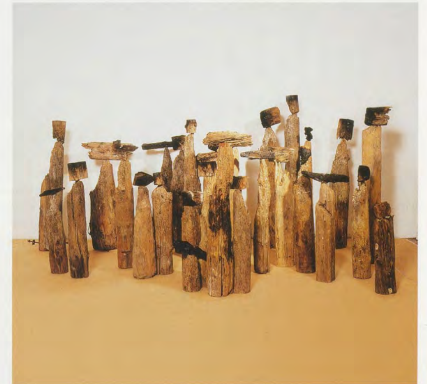
EL ANATSUI, AKUA'S SURVIVING CHILDREN, 1996, wood, metal, dimensions variable / AKUAS ÜBERLEBENDE KINDER, Holz, Metall, Masse variabel.