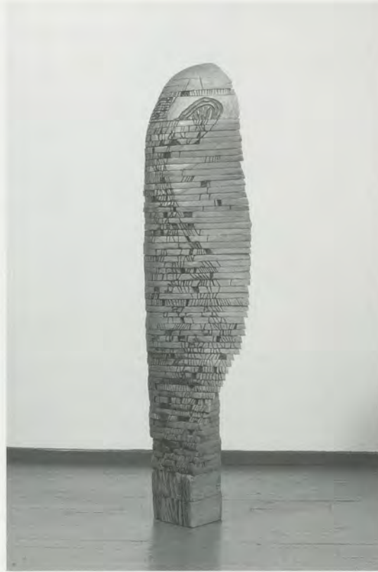
EL ANATSUI, WONDER MASQUERADE, 1990, wood, iron, 67 x 14 1/2" / WUNDER MASKERADE, Holz, Eisen, 170 x 36,8 cm.