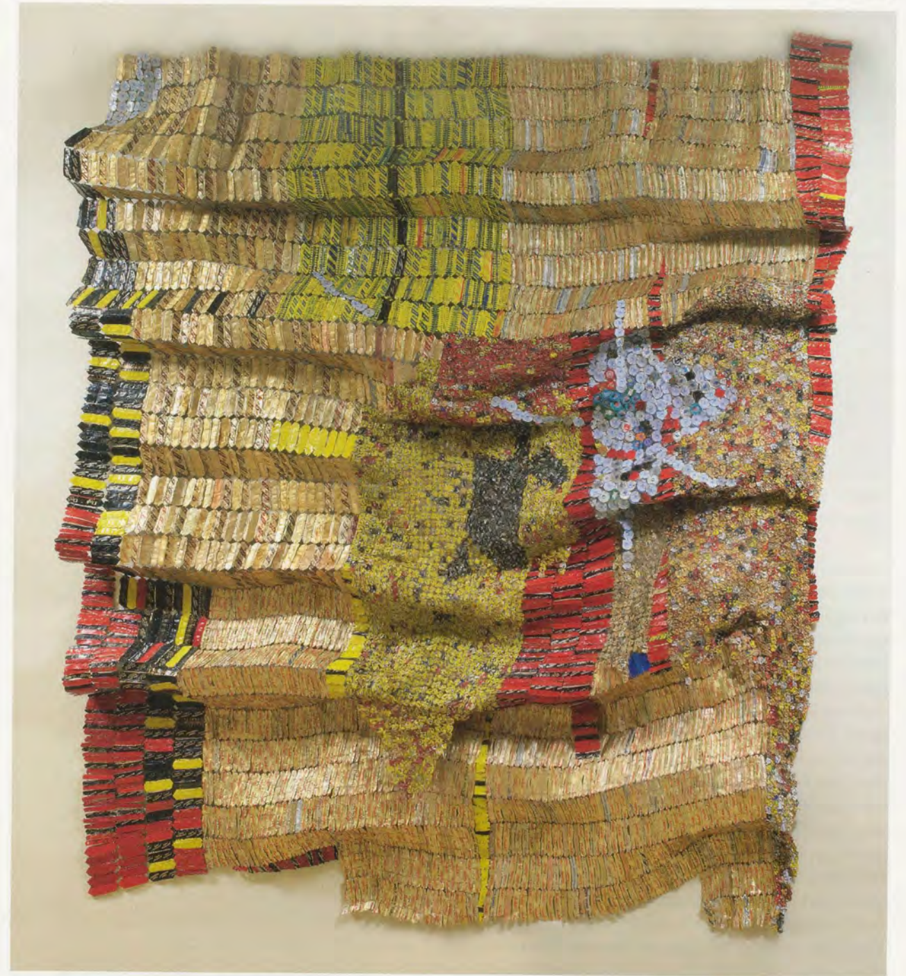
EL ANATSUI, OASIS, 2008, aluminum, copper wire, 106 x 90" / OASE, Aluminium, Kupferdraht, 269,3 x 228,6 cm.

OKWUI ENWEZOR ist Direktor des Haus der Kunst, München, und künstlerischer Leiter der Triennale 2012 im Palais de Tokyo, Paris. In diesem Jahr ist er Kirk Varnedoe Gastprofessor am Institute of Fine Arts, New York University.