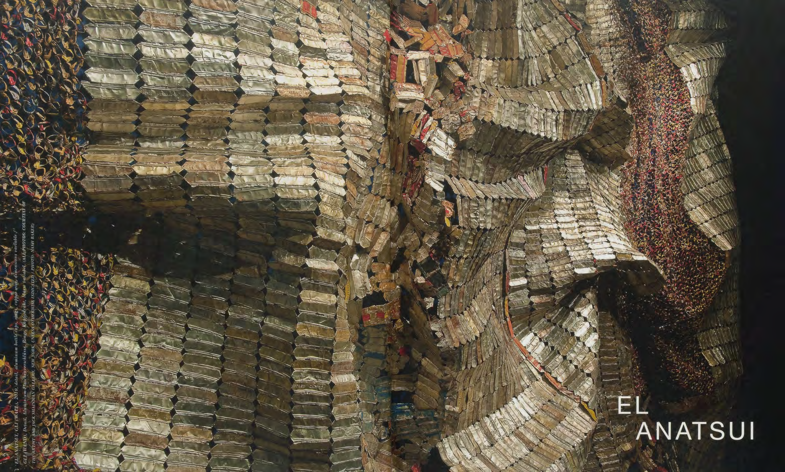
EL ANATSUI, GLI (WALL) , 2010, detail, aluminum bottle caps, rings, copper wire, dimensions variable / GLI (WAND), Detail, Aluminium-Flaschenverschlüsse, Ringe, Kupferdraht, Masse variabel, (ALL PHOTOS: COURTESY OF THE ARTIST AND JACK SHAINMAN GALLERY, NEW YORK, UNLESS OTHERWISE INDICATED / PHOTO: NASH BAKER)