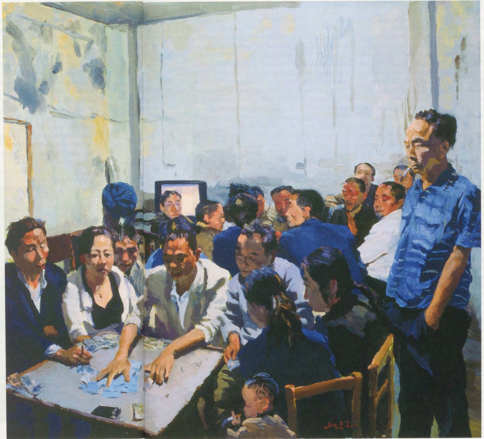
LIU XIAODONG, MAJIANG PARLOR, 2012, oil on canvas, 35 1/2 x 39 3/8" / MAH-JONGG ZIMMER, Öl auf Leinwand, 90 x 100 cm.