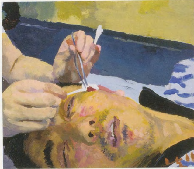
LIU XIAODONG, CHAOTIC MESS, 2011, oil on canvas, 13 x 15" / CHAOTISCHES DURCHEINANDER, Öl auf Leinwand, 33 x 38 cm.