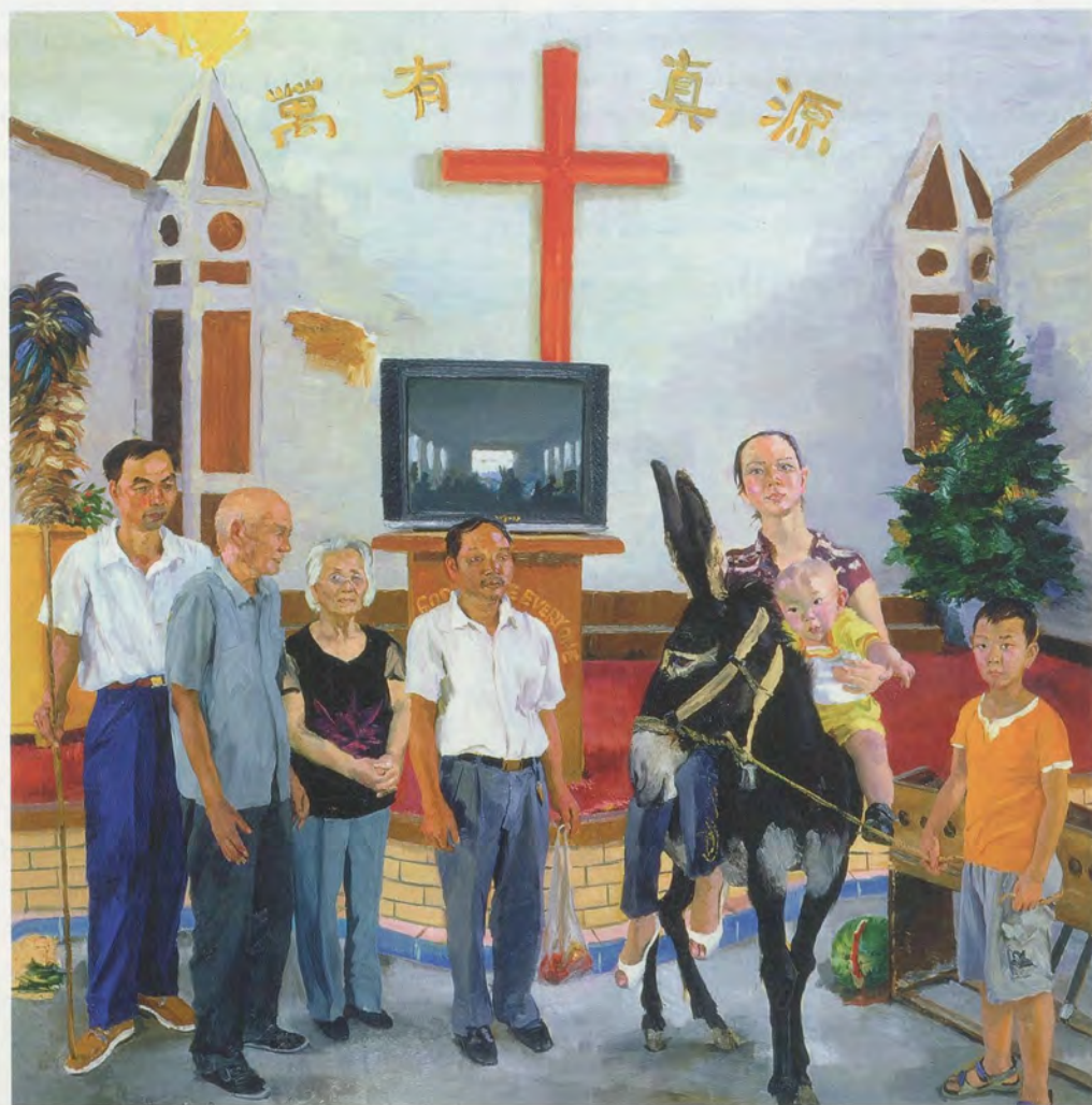
LIU XIAODONG, ZHANG'S FAMILY, 2009, oil on canvas, 114 1/8 x 102 3/8" / ZHANGS FAMILIE, Öl auf Leinwand, 290 x 260 cm.

writing, so I asked them to add it. In the end, I want my subjects to enter into my world in their own way and not merely stand there being painted by me. I am no different from them: me working the canvas with my paintbrush, them working the ground with their hoes; it is very close. Think about it: eagerly cultivating the land and eagerly applying paint—both have the same kind of beauty, and this is the beauty I hope to convey. I like to watch people laboring—planting crops, changing light bulbs, repairing machines. I enjoy watching this. People are beautiful when they work.