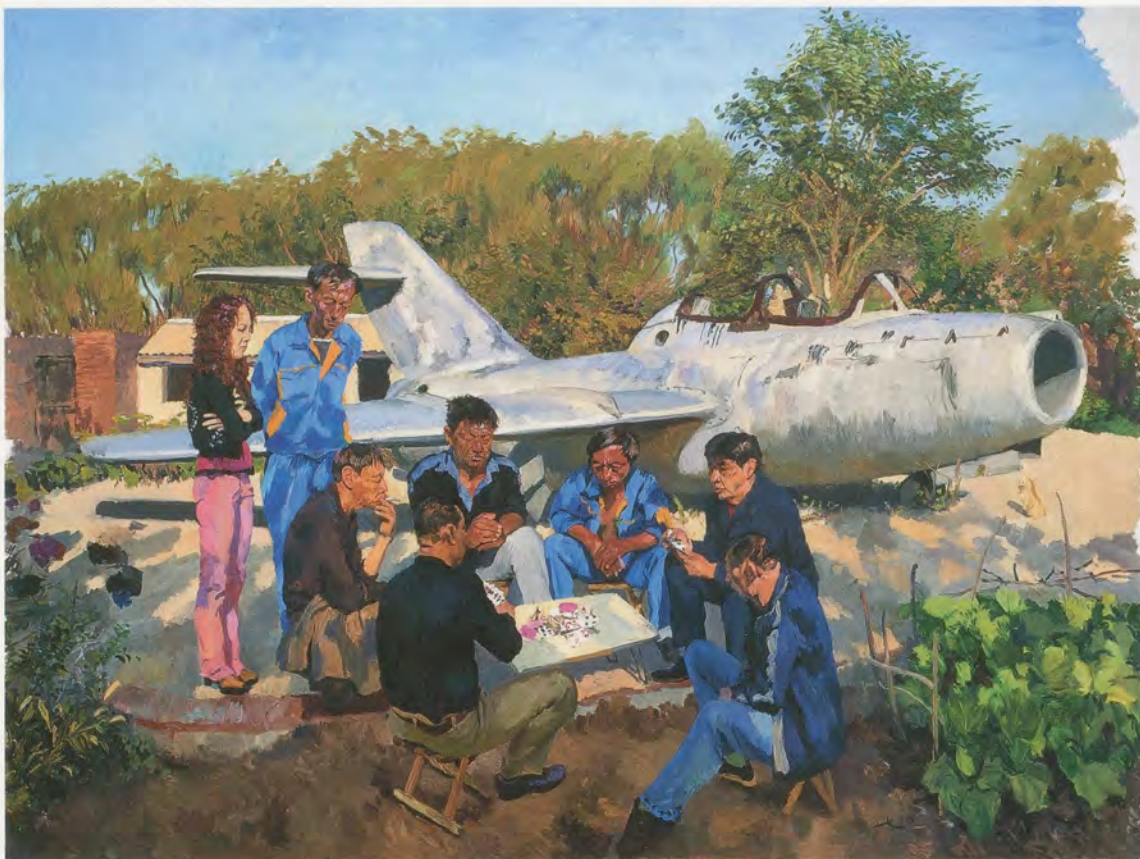
LIU XIAODONG, JINCHENG AIRPORT, 2010, oil on canvas, 118 1/8 x 157 1/2" / FLUGHAFEN JINCHENG, Öl auf Leinwand, 300 x 400 cm.

als Frauen. Der einfache Grund dafür ist, dass weibliche Formen in der Kunstgeschichte überwiegen; darum habe ich mich entschieden, Männer zu malen. In der traditionellen Malerei gibt es viele Dinge, die man nicht mehr malen kann, und ich habe immer am liebsten das gemalt, was es zuvor in den Bildern nicht gab. Dies bedeutet, dass meine Arbeit gleichzeitig eine Achtung und eine Unzufriedenheit gegenüber der Geschichte der Malerei reflektiert, und was noch viel wichtiger ist: das Leben zum Ausdruck bringt und nicht bloss Methodenforschung betreibt. Wir sind mit so vielen unlösbaren Problemen konfrontiert, die wir nur in der Kunst zum Ausdruck bringen können. Ich setze die Malerei ein, um diese