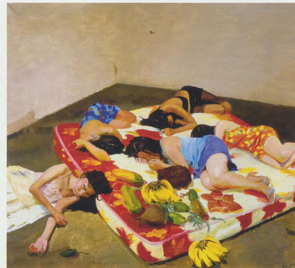
LIU XIAODONG, FLORAL BED, 2006, oil on canvas, 35 1/2 x 39 1/8 / GEBLÜHMTES BETT, Öl auf Leinwand, 90 x 100 cm.

(Aus dem Chinesischen von Eva Lüdi Kong)