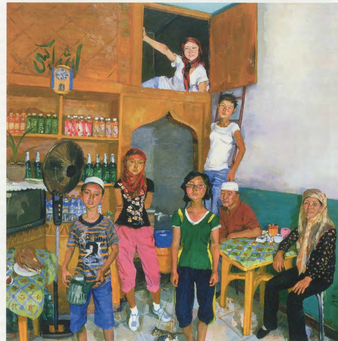
LIU XIAODONG, HE'S FAMILY , 2009, oil on canvas, 114 1/8 x 102 3/8" / HES FAMILIE , Öl auf Leinwand, 290 x 260 cm.

LX: The painted and the painter are the same. For that project, I felt that the canvas needed their