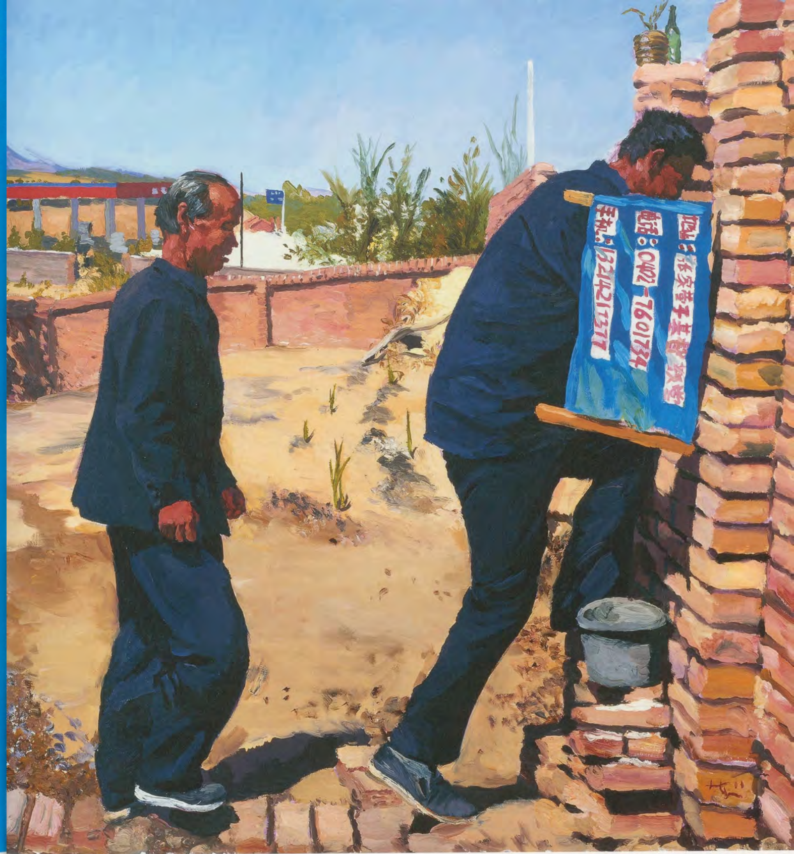
LIU XIAODONG, TWO PLACID MEN, 2011, oil on canvas, 59 x 55 1/8" / ZWEI RUHIGE MÄNNER, Öl auf Leinwand, 150 x 140 cm.