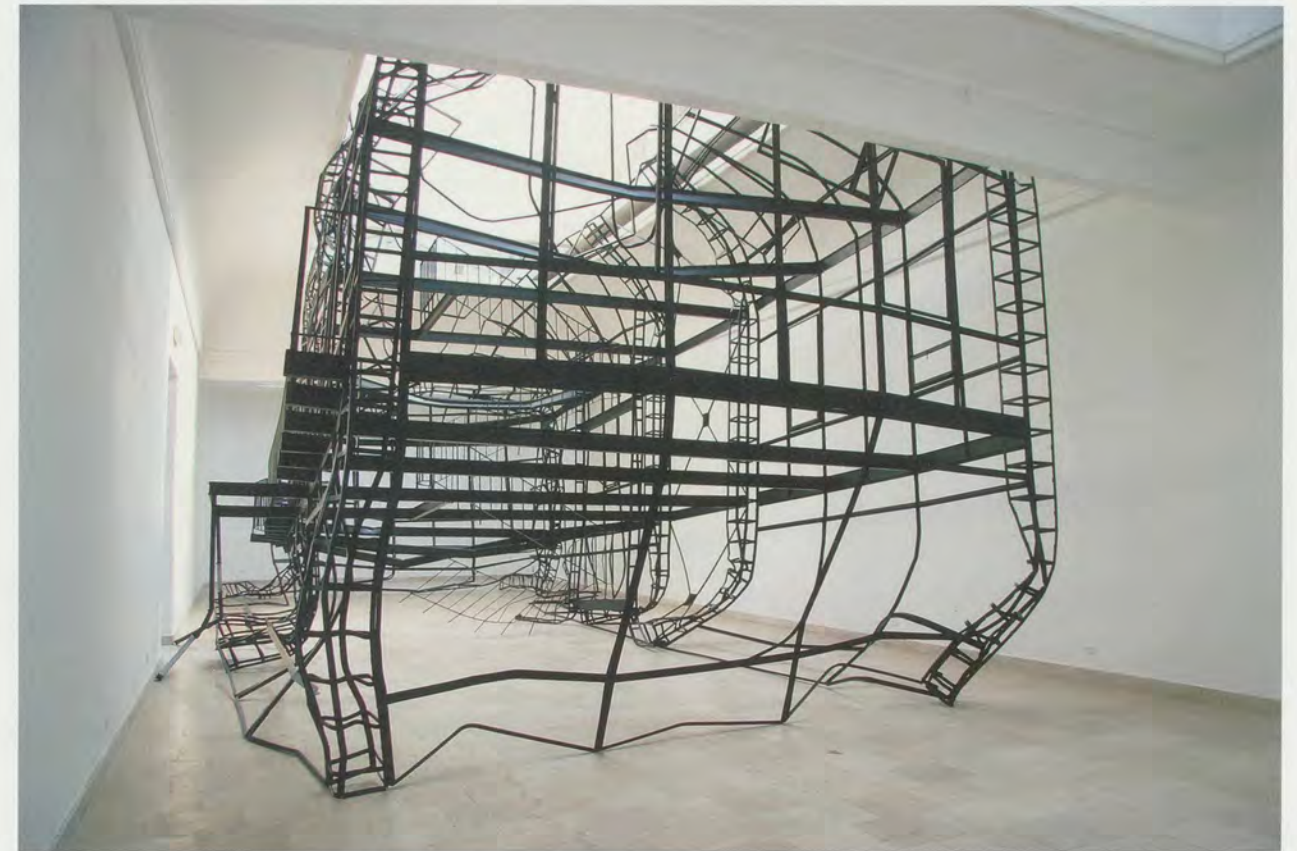
MONIKA SOSNOWSKA, 1:1, 2007, Polish Pavilion, Venice Biennale.

Die Kunst von Monika Sosnowska, die seit 2000 in Warschau lebt, ruft auf manchmal strenge, manchmal barocke Art in Erinnerung, dass keine Stadt, kein Gebäude, ja nicht einmal ein einzelner Raum ein autonomes Ding ist, sondern in jedem gegebenen Augenblick von zahlreichen «Mental Spaces» (Sosnowska) besetzt und durchkreuzt wird. Man könnte Warschau – eine Stadt, die in den letzten fünfzig Jahren mehrmals im grossen Massstab, wenn auch etwas chaotisch neu erfunden wurde – als be-