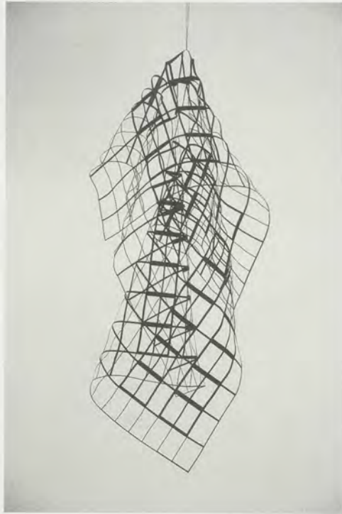
MONIKA SOSNOWSKA, THE SKIN, 2012, model / DIE HAUT, Modell.