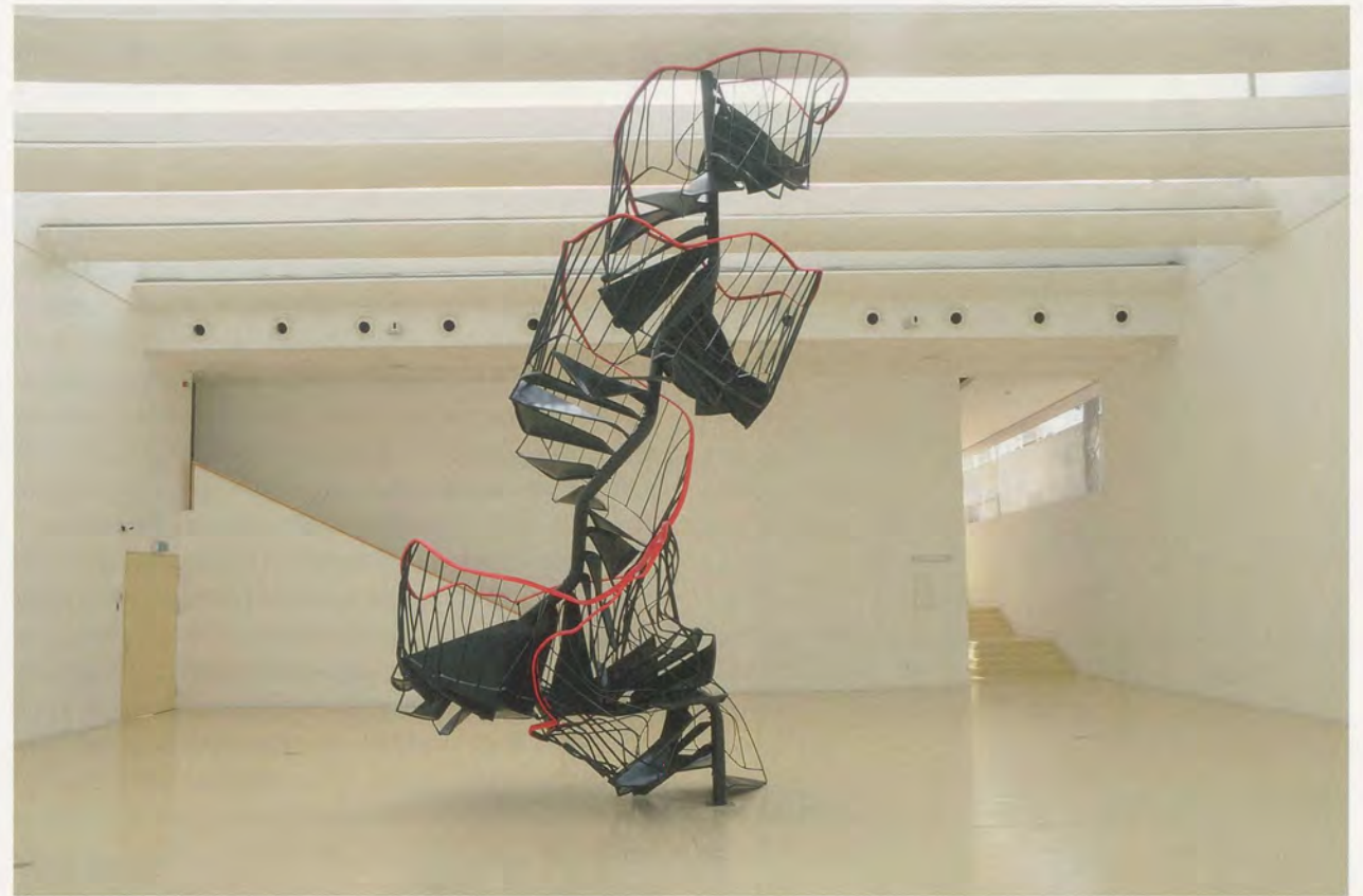
MONIKA SOSNOWSKA, THE STAIRWAY / DIE TREPPE, 2010, Herzliya Museum of Contemporary Art.

may find ourselves standing in, or strolling through, several of these cities at once: They don't just abut one another but live and breathe in the same space.