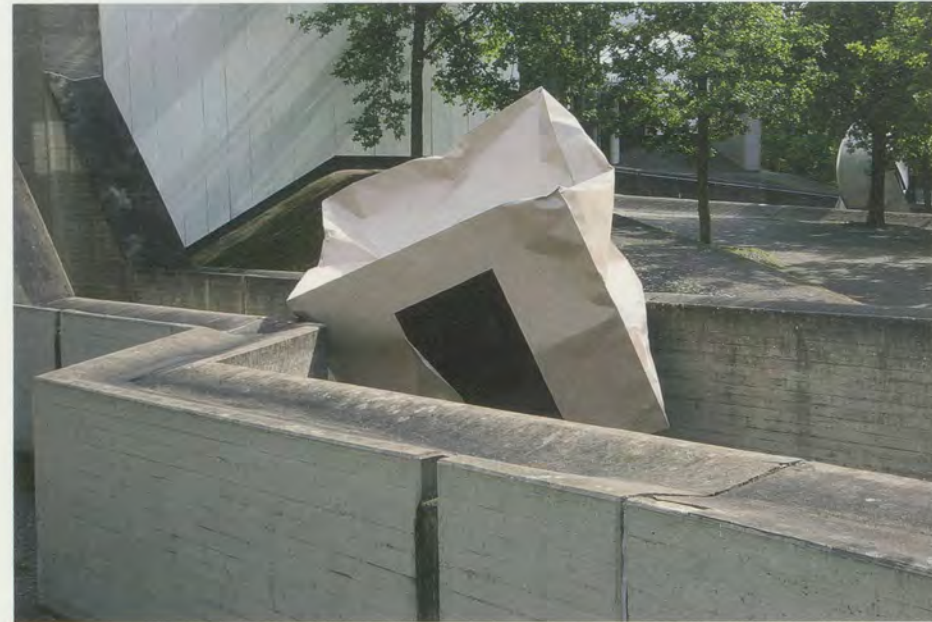
MONIKA SOSNOWSKA, UNTITLED / OHNE TITEL, 2006, Sprengel Museum, Hannover. (PHOTO: MONIKA SOSNOWSKA)