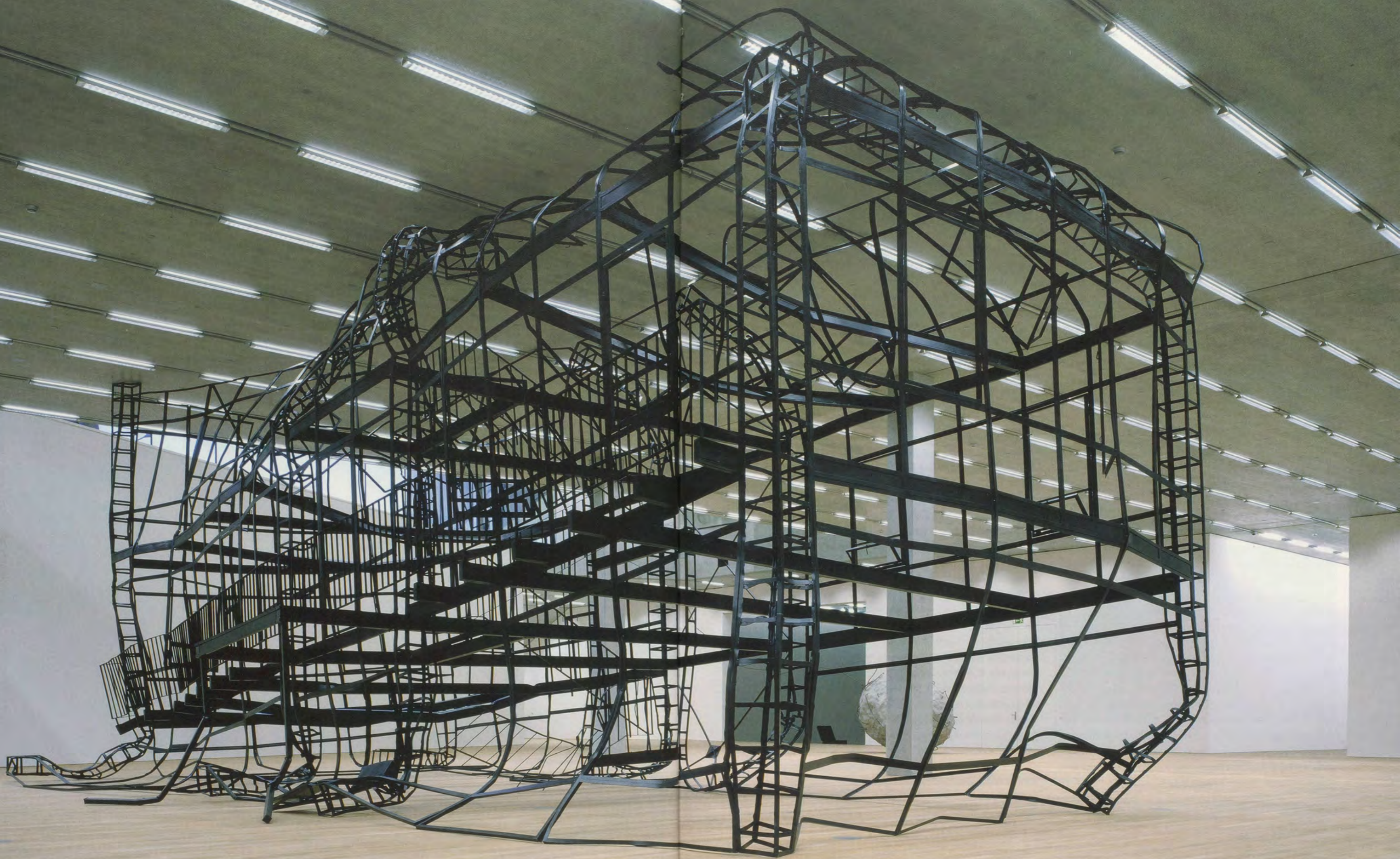
MONIKA SOSNOWSKA, 1:1, 2008, Schaulager, Basel.