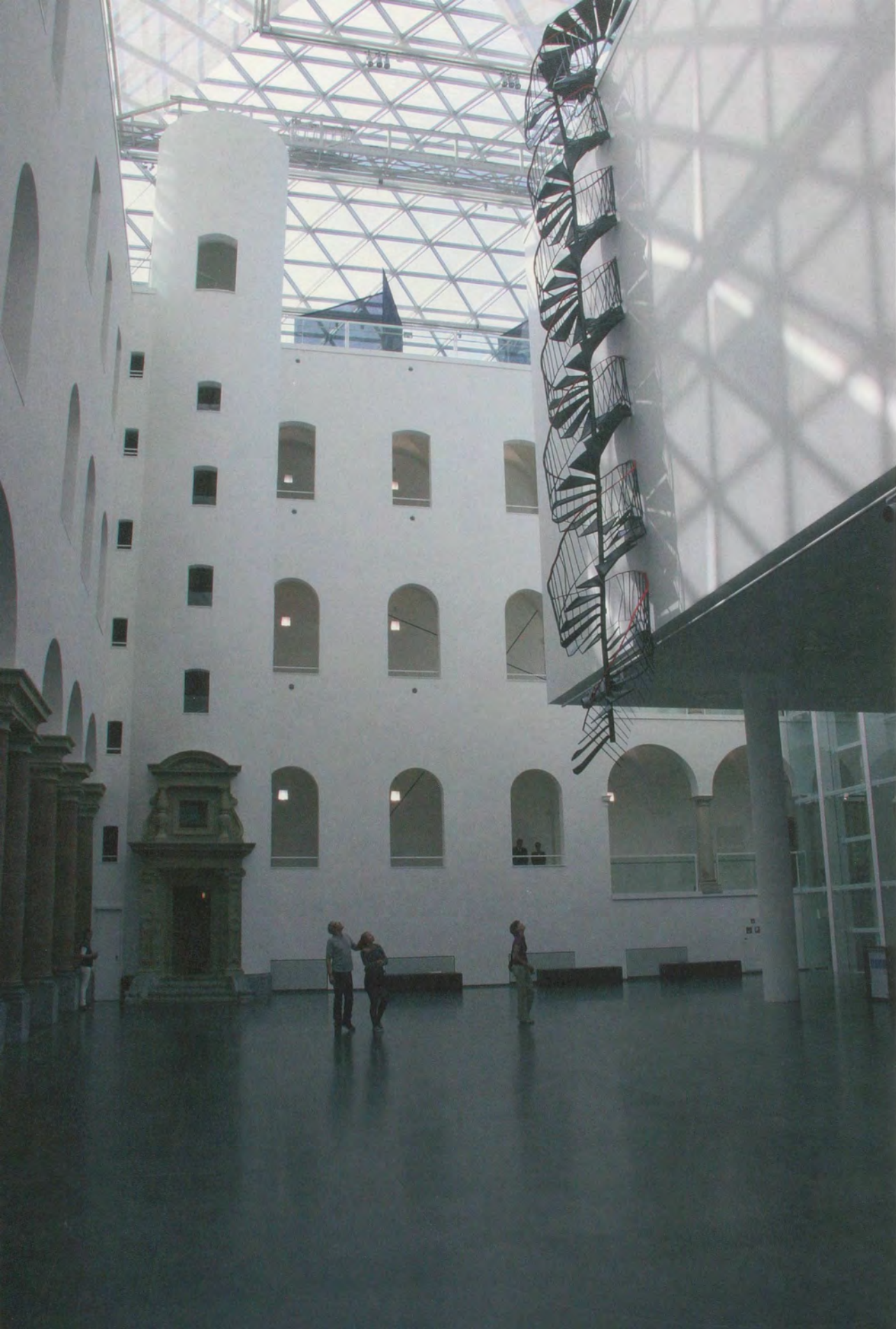
MONIKA SOSNOWSKA, THE STAIRCASE / DIE TREPPE, 2010, K21, Düsseldorf.