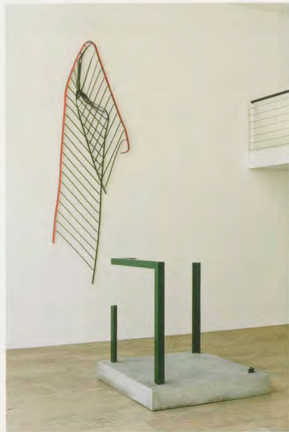
MONIKA SOSNOWSKA, THE BALUSTRADE / DIE BALUSTRADE , 2009, Capitain Petzel, Berlin.

more amenable habitat. Such works—one thinks too of the torqued and splayed iterations of her HANDRAIL (2008)—suggest a bristling sort of architecture, ever ready to disarticulate itself and reinstate itself elsewhere, like a house spider that reminds us our dwellings are not as impregnable to nature as we might like.