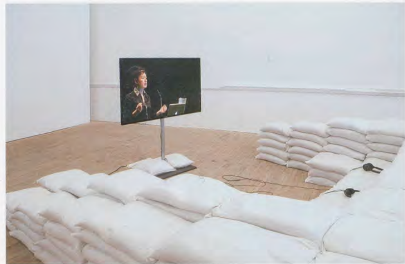
HITO STEYERL, I DREAMED A DREAM: POLITICS IN THE AGE OF MASS ART PRODUCTION , 2013, two-channel HD video, 29 min, installation view Artists Space, New York / ICH TRÄUMTE EINEN TRAUM: POLITIK IM ZEITALTER DER MASSENKUNST-PRODUKTION, 2-Kanal-HD-Video, Installationsansicht.

Textverarbeitungssoftware der Schriftsteller, die Bildbearbeitungssoftware der Filmemacher und die Graphikdesignsoftware der bildenden Künstler sind nur Varianten desselben Phänomens; die Schreibmaschine, die Steenbeck und der Zeichentisch sind allesamt von Tastatur, Maus und Bildschirm abgelöst worden. Tatsächlich wird das Zusammenspiel von Steyerl-als-Autorin, Steyerl-als-Filmemacherin und Steyerl-als-Künstlerin in einer Serie von Videos deutlich, die aus Aufzeichnungen von Live-Vorlesungen zusammengeschnitten sind: IS THE MUSEUM A BATTLEFIELD? (Ist das Museum ein Schlachtfeld?, 2013), I DREAMED A DREAM (Ich träumte einen Traum, 2013) und DUTY-FREE ART (Zollfreie Kunst, 2015). Jedes dieser Videos ist mit Clips und Photos angereichert, die in diesen Vorträgen und Diskussionen Verwendung fanden und jetzt den Videos selbst einverleibt wurden. In Steyerls diesjähriger Einzelausstellung bei Artists Space in New York sorgte die Einbindung dieser Arbeiten für einen Brückenschlag zwischen Videoessays wie LIQUIDITY und HOW NOT TO BE SEEN (Wie man nicht gesehen wird) einerseits und ihren Texten andererseits und spielte dabei zugleich auf die bildende Kunst des klassischen Galerieraumes an – mit einer Installation in Gestalt eines mit Kissen bestückten, wellenähnlichen Raumelements, einer Sitzgruppe aus Sandsäcken sowie einem