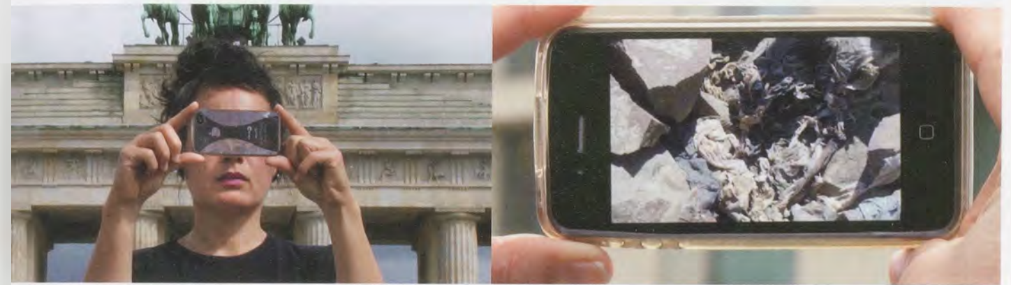
HITO STEYERL, ABSTRACT , 2012, two channel HD video, 7 min. 30 sec. / ABSTRAKT , 2-Kanal-HD-Video.