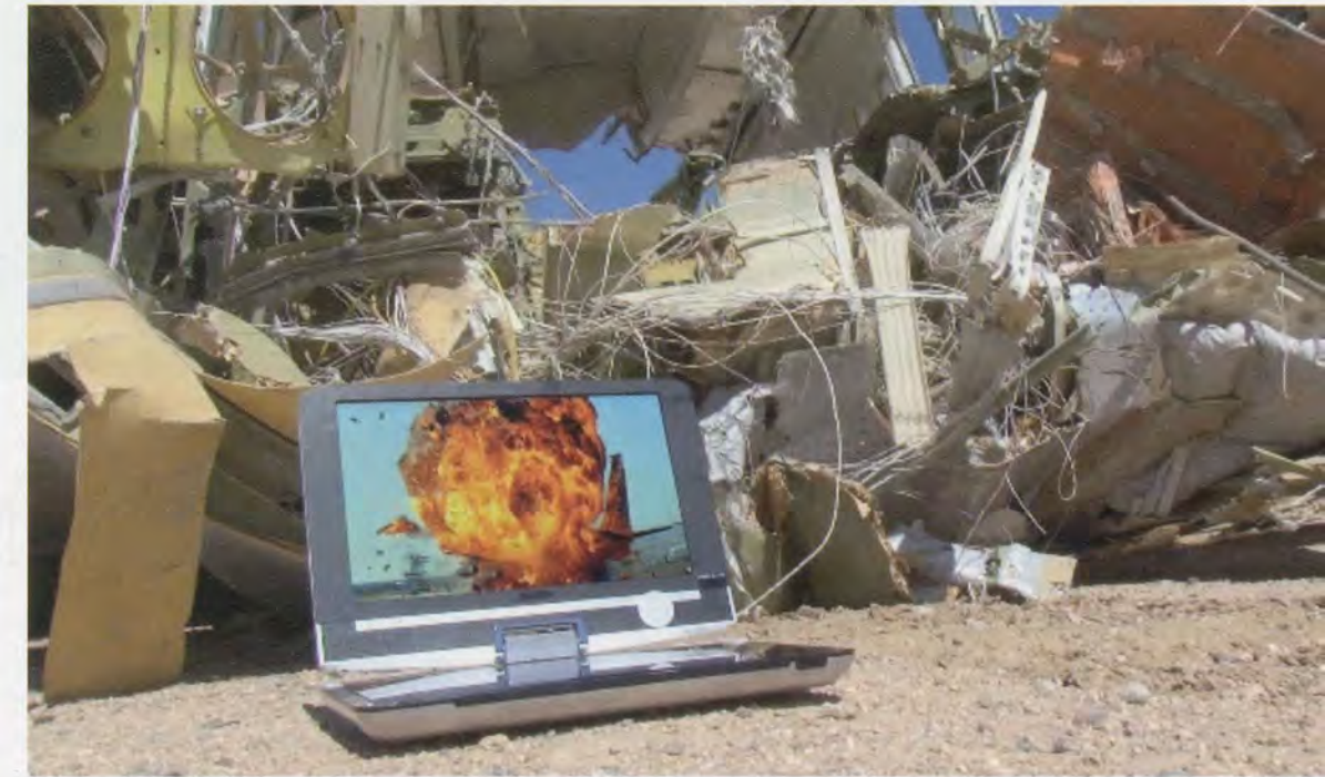
HITO STEYERL, IN FREE FALL , 2010, HD video, 34 min. / IM FREIEN FALL , HD-Video.

8) This scenario was best expressed by Alexander Horwath, director of the Austrian Filmmuseum, in a roundtable at the Short Film Festival Oberhausen in 2007. He described it as "a very old problem which artists' films—frequently called 'avant-garde films' or, in certain times 'underground films,' or which may best be called 'independent films'—have consciously dealt with at least since the 1960s. They practiced a radical and play-