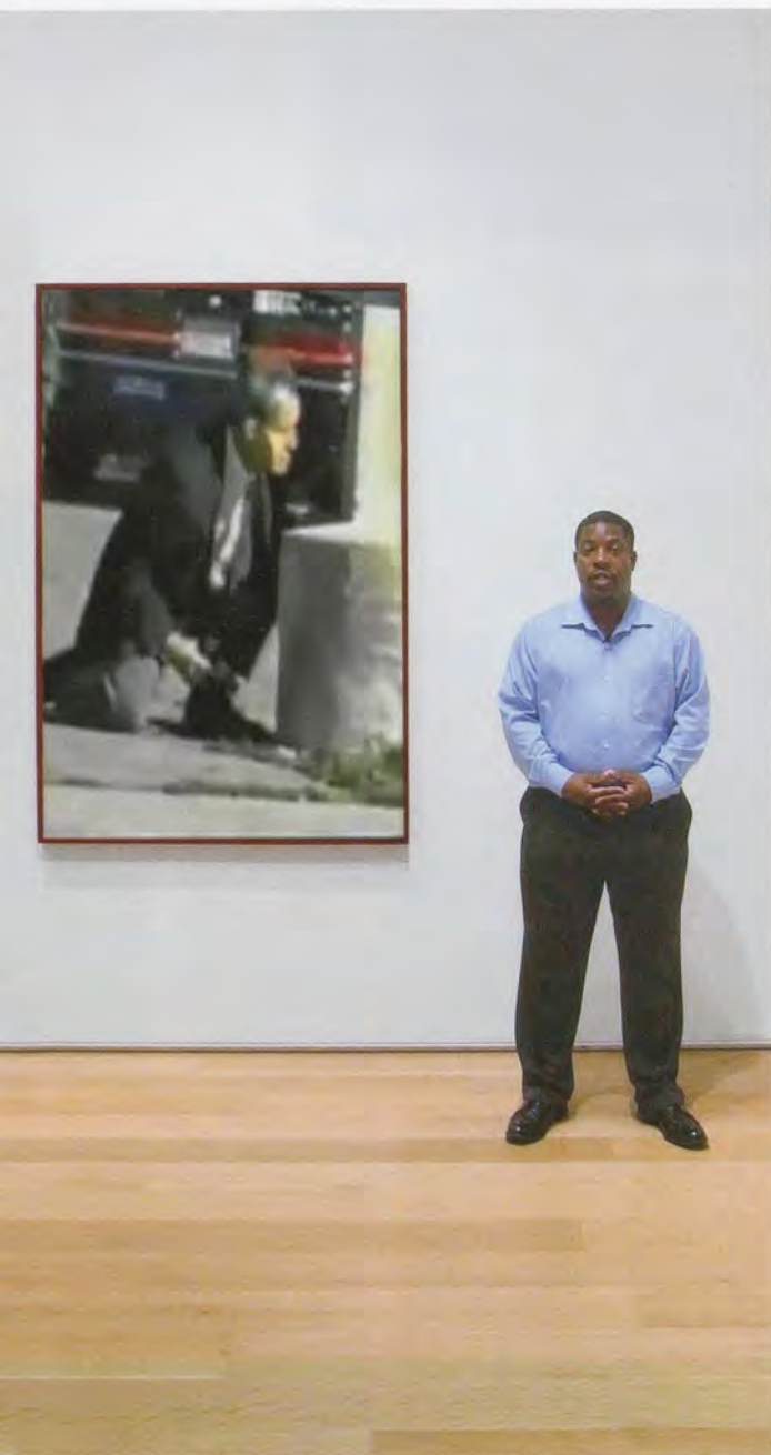
HITO STEYERL, GUARDS, 2012, HD video, 20 min. / WÄCHTER, HD-Video.

useful in liberation struggles, “the misery-voyeuristic picture forms developed by this ‘redemption’ idea are among the most potent documentalities 3) of the present and legitimize both military and economic invasions.” She thus concludes that “there is hardly a visibility that is not steeped in power relations—so that we can almost say that what we see has always been provided by power relations. On the other hand, the doubt in these visibilities insists with a vehemence that is capable of constituting its own form of power.” 4) An image may indeed contain a redemptive fragment of reality, Steyerl argues, but its manner of use—how it is employed by dominant structures—becomes the ultimate arbiter of its meaning.