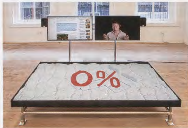
HITO STEYERL, DUTY FREE ART, 2015, three-channel color HD video, 38 min., installation view Artists Space, New York / ZOLLFREIE KUNST, 3-Kanal-HD-Farbvideo, Installationsansicht.

mus aktuell auftritt, noch stärker ins Zentrum. Sie betonen die Zweidimensionalität des Computerbildschirms, wo alles auf der Neukonfiguration von Daten beruht und die einzelnen Elemente vom Künstler ohne Rücksicht auf die ontologischen Zwänge der physischen Welt angeordnet werden können. Der Titel des Werks LIQUIDITY, INC. (Liquidität, Inc. 2014) verweist auf den fließenden, austauschbaren Charakter einer durch vernetzte Systeme vermittelten Existenz, und das Video selbst bedient sich grosszügig aus dem Füllhorn der Postproduktionseffekte, die das Zeitalter des Schneidens auf dem Laptop eröffnet hat: Überlagernder Text in einer irrwitzigen Vielfalt von Schriftsätzen kommt sich krümmend und schlängelnd daher wie eine Powerpoint-Präsentation auf einem Trip; schwindelerregende Collagen von im Farbstanz-Verfahren erzeugten Videobildern; eine Graphik, die dem UX-Design von Tumblr, Google Hangouts und Mozilla Thunderbird nachempfunden ist; und zahlreiche weitere Beispiele bewegter Bilder, die gedehnt, wiederholt, invertiert, beschleunigt, verlangsamt und anderweitig modifiziert werden. Ein Lieblingskunstgriff von Steyerl ist die überlagernde Platzierung eines Videoclips in