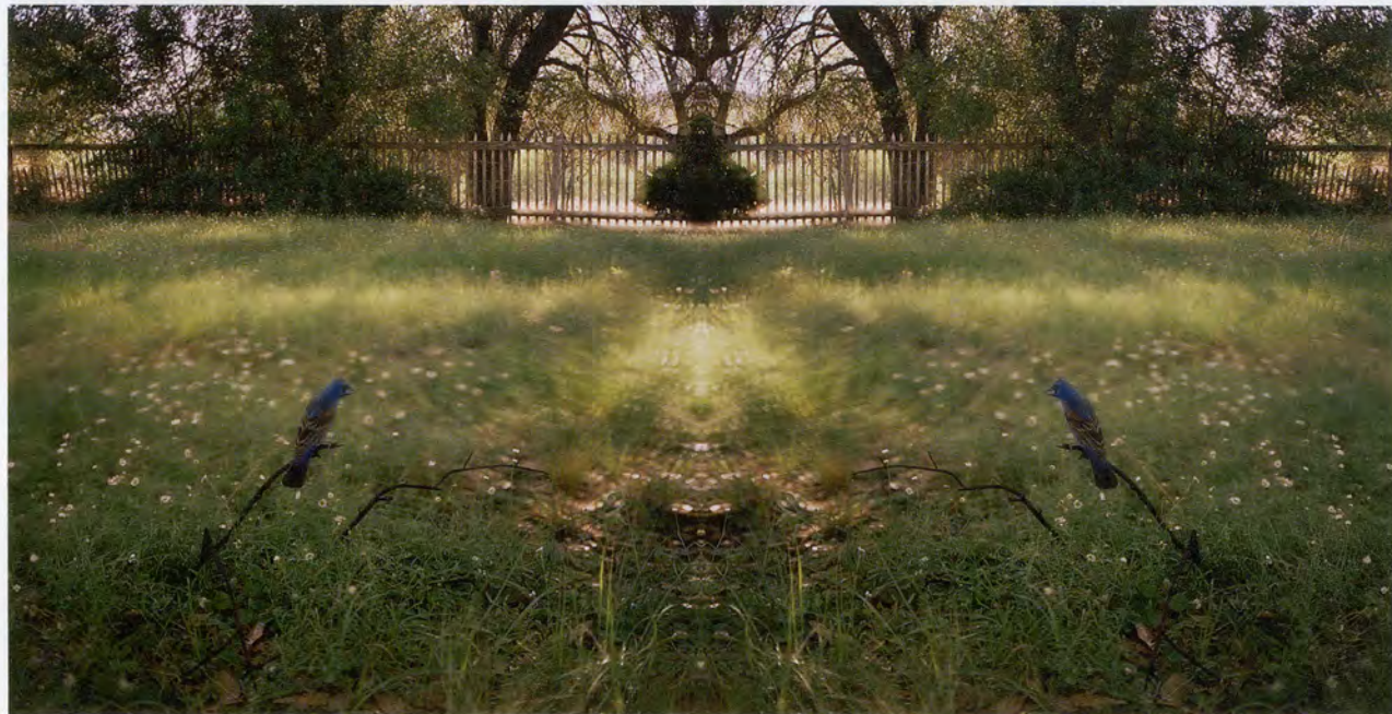
JEAN-LUC MYLAYNE, NO. 407, AVRIL MAI 2006, 153 x 303 cm / 60 1/4 x 119 1/4".

Beinahe ebenso lange, wie Mylayne seine photographischen Wanderzüge unternahm, beschritt Parkett eigenständige und einflussreiche Wege durch die Welt der Kunst. Abseits des ausgetretenen, von fast allen anderen Zeitschriften benutzten Pfads – Rezensionen, Neuigkeiten aus der Szene – pflegte man die Zusammenarbeit mit Künstlern an Büchern und Editionen, die den Charakter der Publikation ganz wesentlich bestimmte. (Mylayne steuerte zwei Parkett -Editionen für die Ausgaben von 1982 und 2001 bei.) Diese für Sammler interessanten Aktivitäten liessen sich ohne Weiteres fortsetzen, werden nun aber zusammen mit dem gedruckten Heft eingestellt. Die