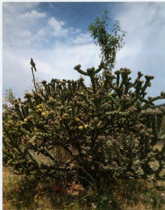
JEAN-LUC MYLAYNE, NO. 342, AVRIL MAI 2005, 228 x 183 cm / 89 3/4 x 72".

able to allow the slide-like superimposition of images that a digital device can easily create, but it cannot interact with the modes of knowledge circulation that predominate in a mobile e-world. Parkett and all print magazines seem like a sediment, a precipitate from the digital swirl.