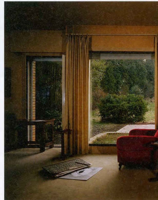
JEAN-LUC MYLAYNE, B1 – B2, NOVEMBRE DÉCEMBRE 2000 – JANVIER 2001, diptych, 153 x 123 cm, 60 1/4 x 48 1/2" each.

die flüchtigen Aktivitäten eines Lebewesens erhaschen, ohne selbst entdeckt zu werden. Mylayne und Mylène halten es genau umgekehrt: Sie machen den Vögeln, mit denen sie arbeiten wollen, offen ihre Anwesenheit bekannt. Die wechselseitige Kommunikation ist ein unverzichtbarer Teil des Prozesses, der mit einem kompletten Kompositionsentwurf beginnt. Danach werden die Voraussetzungen dafür geschaffen, dass ein oder mehrere Vögel freiwillig ihren Platz innerhalb der Komposition einnehmen. Die konzeptuelle Grundstruktur bleibt lesbar in der strikten Präzision des Bildausschnitts und mehr noch im Spiel von Schärfe und Unschärfe (realisiert mit-