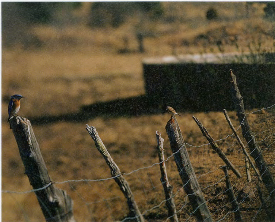
JEAN-LUC MYLAYNE, NO. 354, NOVEMBRE DÉCEMBRE 2005, 123 x 153 cm / 48 1/2 x 60 1/4".

Redaktion entschloss sich zu diesem Schritt in einer Zeit, in der die meisten Künstler und Autoren per Internet kommunizieren. Der Takt von nur zwei Ausgaben jährlich scheint heutzutage nicht mehr auszureichen, um am «Puls der Zeit» zu bleiben. Wir dürfen indessen nie aufhören, nach neuen Wegen des Dialogs zu suchen. Eine Gemeinschaft, die sich nicht bemüht, fremde Sichtweisen zu verstehen, ist dem Untergang geweiht. Auf abstrakter Ebene wird es notwendig sein, die Mechanismen und Strukturen der Kommunikation sichtbar zu machen, um deren Funktionsweise besser zu verstehen. Wir müssen die elementaren Spannungen und Widersprüche innerhalb der mobilen elektronischen Kultur nutzen, um ihr kommunikatives Potenzial freizusetzen, wie ja auch die Kunst der Mylaynes ihren Stoff aus den inneren Gegensätzen schöpft, die das Zeitalter der Globalisierung prägen. Das Künstlerpaar entschied sich für Mobilität ohne Telekommunikation, für Ein-