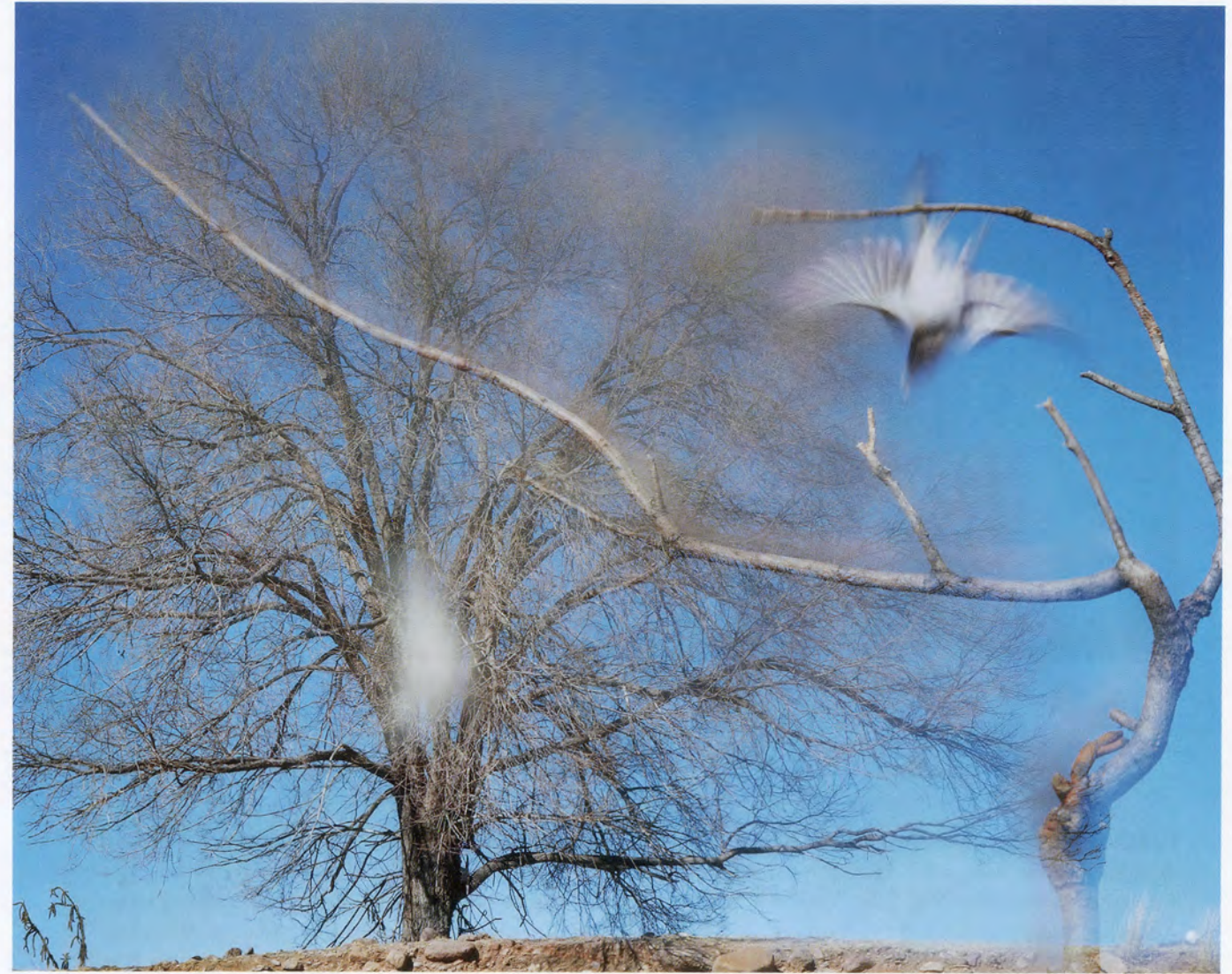
JEAN-LUC MYLAYNE, NO. 560, JANVIER FÉVRIER 2008, 185 x 230 cm / 72 7/8 x 90 1/2".