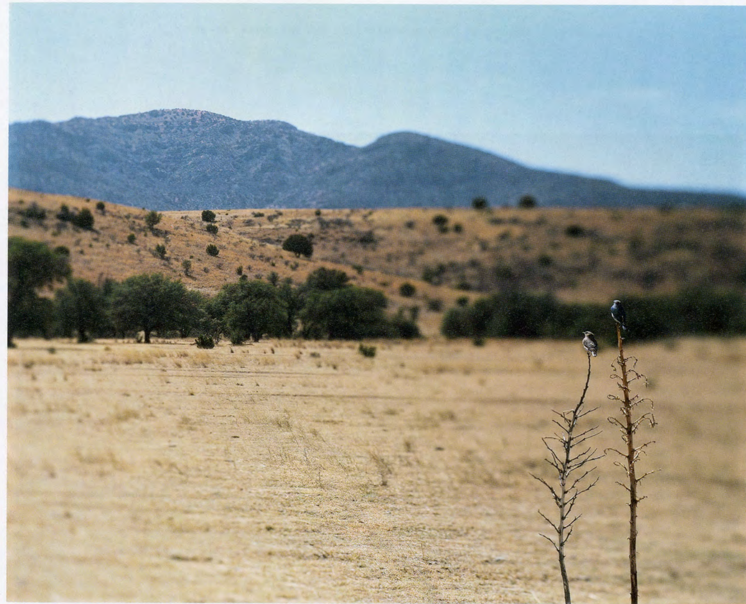
JEAN-LUC MYLAYNE, NO. 498 – NO. 499, JANVIER FÉVRIER MARS 2007, diptych, 180 x 225 cm / 70 7 / 8 x 88 5 / 8 ” each.