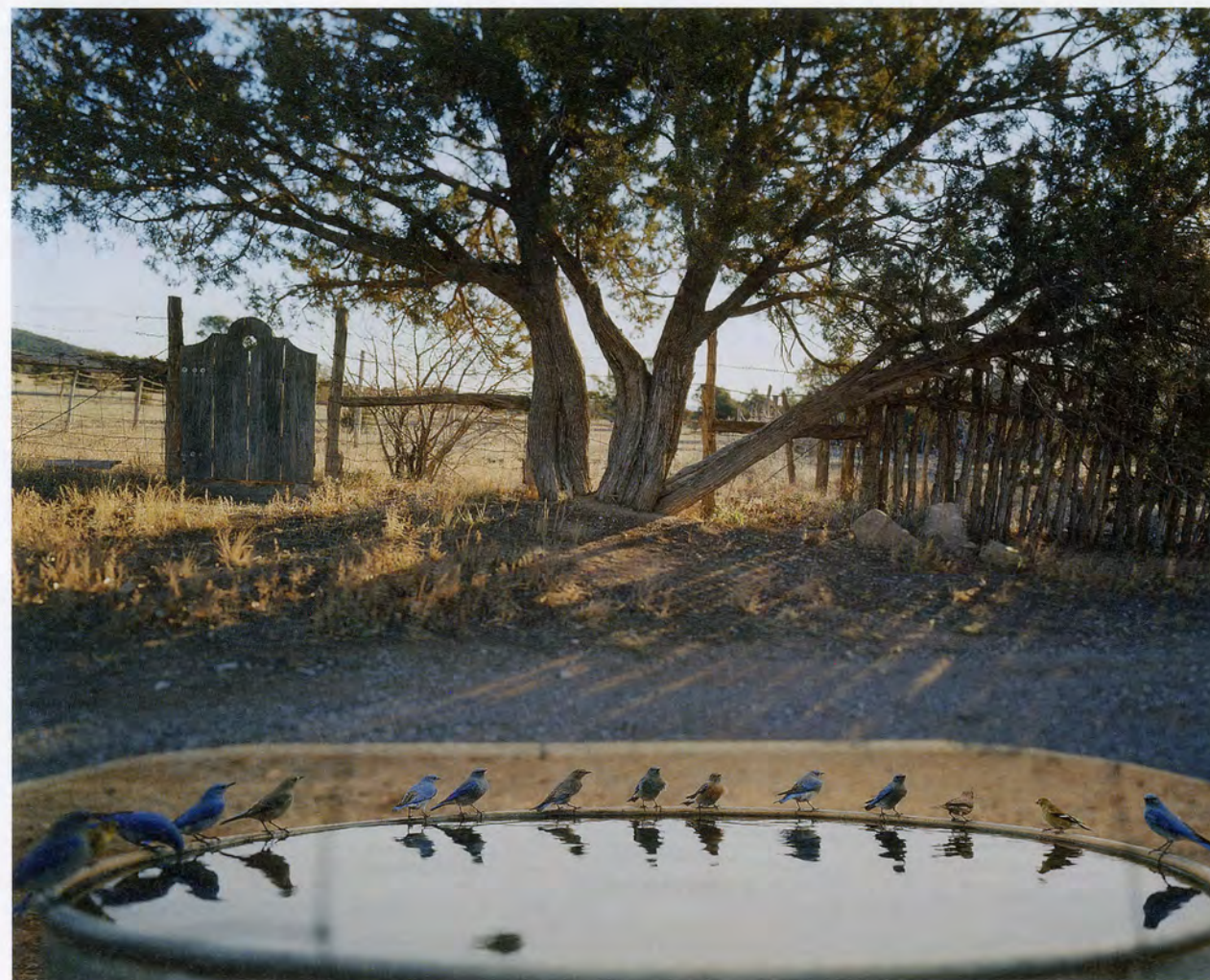
JEAN-LUC MYLAYNE, NO. 190, JANVIER FÉVRIER 2004, 185 x 230 cm / 72 7/8 x 90 1/2".

The Mylaynes found their idiosyncratic way through the conventionally connected world. Decidedly mobile—they "opted long ago for a path determined by the restless, shifting focus of his photographs, namely birds," as Fionn Meade put it in an essay published here in 2009—the couple bought a camper van in the late 1970s and succumbed to a "migratory pull." For years, they had no fixed address and, save for a radio, never owned any transmission devices. They