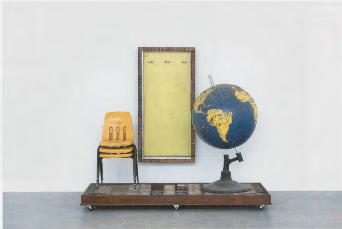
THEASTER GATES, CLASSROOM , 2013, wood, plastic, metal, dimensions variable / KLASSENZIMMER , Holz, Kunststoff, Metall, Masse variabel.

critique of the neoliberal privatization of social welfare that is one of its conditions of possibility. 6)