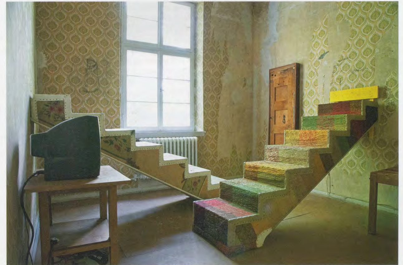
THEASTER GATES, 12 BALLADS FOR HUGUENOT HOUSE , 2012, installation view, Documenta 13, Kassel / 12 BALLADEN FÜR DAS HUGENOTTENHAUS , Installationsansicht.