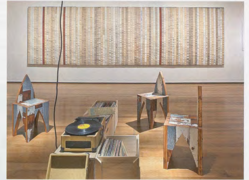
THEASTER GATES, THE LISTENING ROOM, 2012, installation view, Seattle Art Museum / DER HÖRRaum, Installationsansicht.

discover a new form of urban philanthrocapitalism: "Theaster Gates Sells Fire Hoses to Rebuild Chicago Slums." 4)