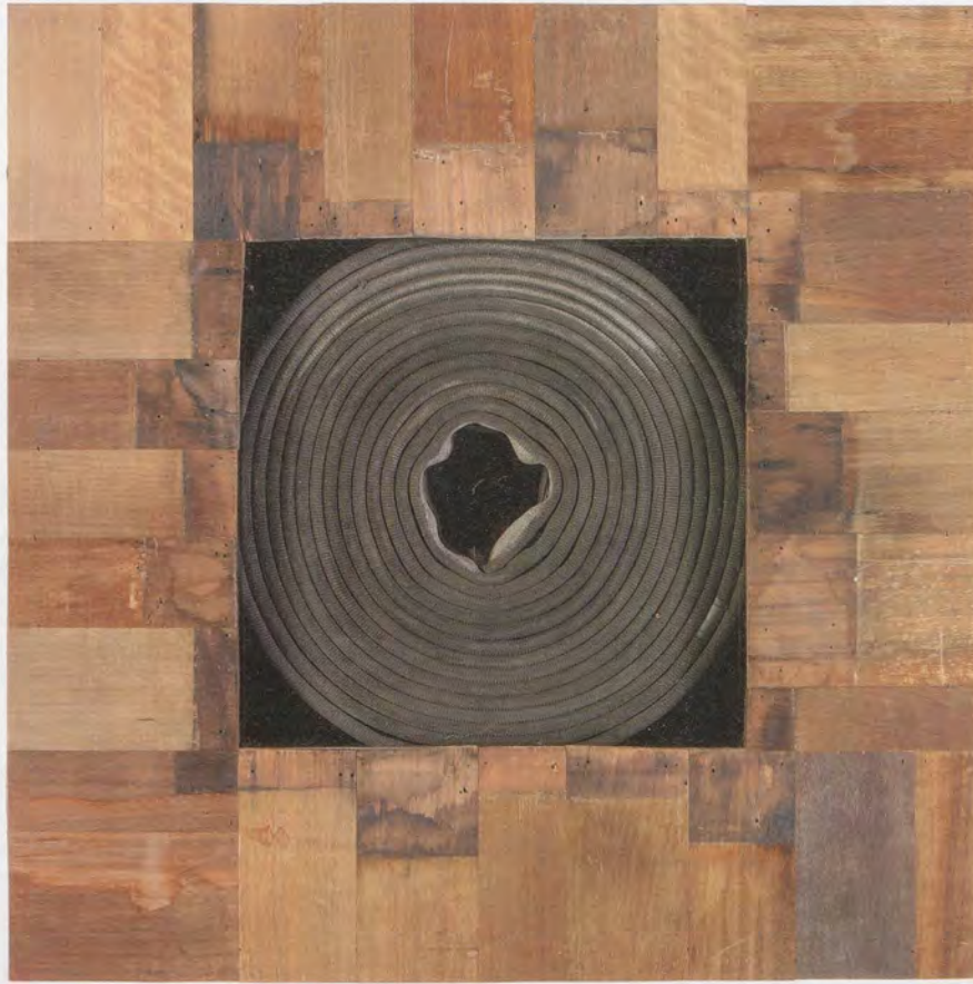
THEASTER GATES, EXECUTIVE SUITE, 2013, wood, decommissioned fire hose, 31 x 31 x 7" / CHEFETAGE, Holz, ausgemusterter Feuerwehrschlauch, 78,7 x 78,7 x 17,8 cm.

meshed with one another, albeit in often disavowed ways: black urban neighborhoods defined by capital extraction, on the one hand, and art collections, art institutions, and cultural foundations built upon capital accumulation, on the other. So how does Gates's circular economy relate to the larger economy, an economy in which no exchange is equal and all exchange must yield an excess? And how does that relationship inform what makes today's artist-led urban development so different and so appealing?