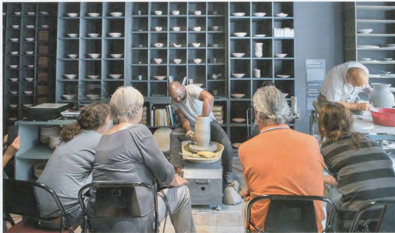
THEASTER GATES, THREE OR FOUR SHADES OF BLUES , 2015, Theaster Gates throws pottery in the installation, Istanbul Biennial / DREI ODER VIER BLUESTÖNE, Theaster Gates an der Töpferscheibe in der Installation.

wichtiger als die Spuren von Gewalt ist die heutige Umlagerung von Ressourcen für die Renovationen. 13) Dasselbe mag auf einen Teil des Archivmaterials zutreffen, das in den Dorchester Projects versammelt ist; so erfolgte beispielsweise die Schliessung von Dr. Wax Records laut Auskunft der Besitzer, weil das Harper Court Shoppingcenter, in dem der Laden untergebracht war, von der University of Chicago gekauft wurde. 14) Die neoliberale Gegenwart ist vielleicht mehr als nur eine Bedingung für Gates' Kreislaufwirtschaft; womöglich regelt sie auf inhaltlicher Ebene die politischen Bedingungen, die in der innerhalb dieser Wirtschaft zirkulierenden Kunst zum Ausdruck kommen.