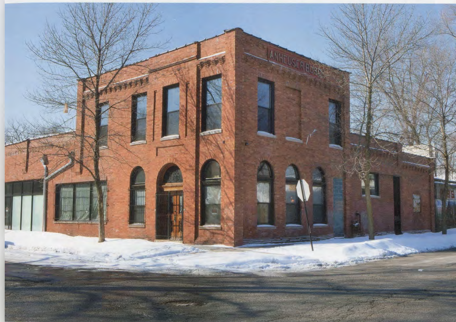
THEASTER GATES, Theaster Gates Studio, Chicago, 2014.

Gates hat sein Projekt, die benachteiligten schwarzen Gemeinden auf Chicagos Südseite mit der institutionellen Kunstwelt zu verbinden, als «Kreislauf-