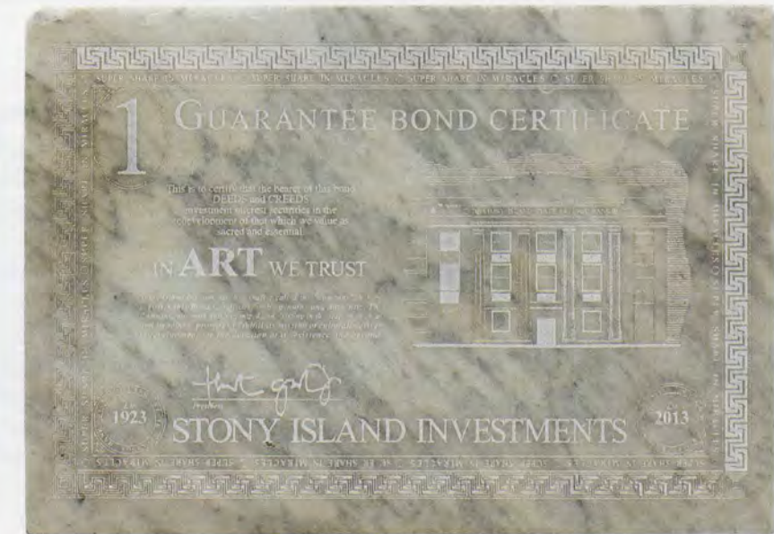
THEASTER GATES, BANK BOND , 2013, marble, 6 1/8 x 8 5/8 x 13/16" / BANKOBLIGATION , Marmor, 15,5 x 21,9 x 2,1 cm.

Bei den Gebäuderenovationen im Rahmen der Dorchester Projects wurden «umfunktionierte Materialien aus ganz Chicago» verwendet. 12 Im Gegensatz zu den Kunstwerken, die diese Renovationen unterstützten, wird die tatsächliche oder symbolische Herkunft dieser Materialien jedoch nicht genannt;