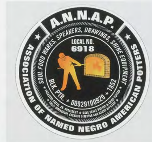
THEASTER GATES, Association of Named Negro American Potters (ANNAP) , 2010, logo / Verband Schwarz-amerikanischer Töpfer, Logo.