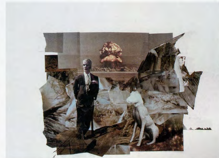
ADRIAN GHENIE, study for THE DEVIL 3 , 2010, collage and acrylic on paper, 12 3/4 x 18 7/8" / Studie für DER TEUFEL 3 , Collage und Acryl auf Papier, 32,7 x 48 cm.