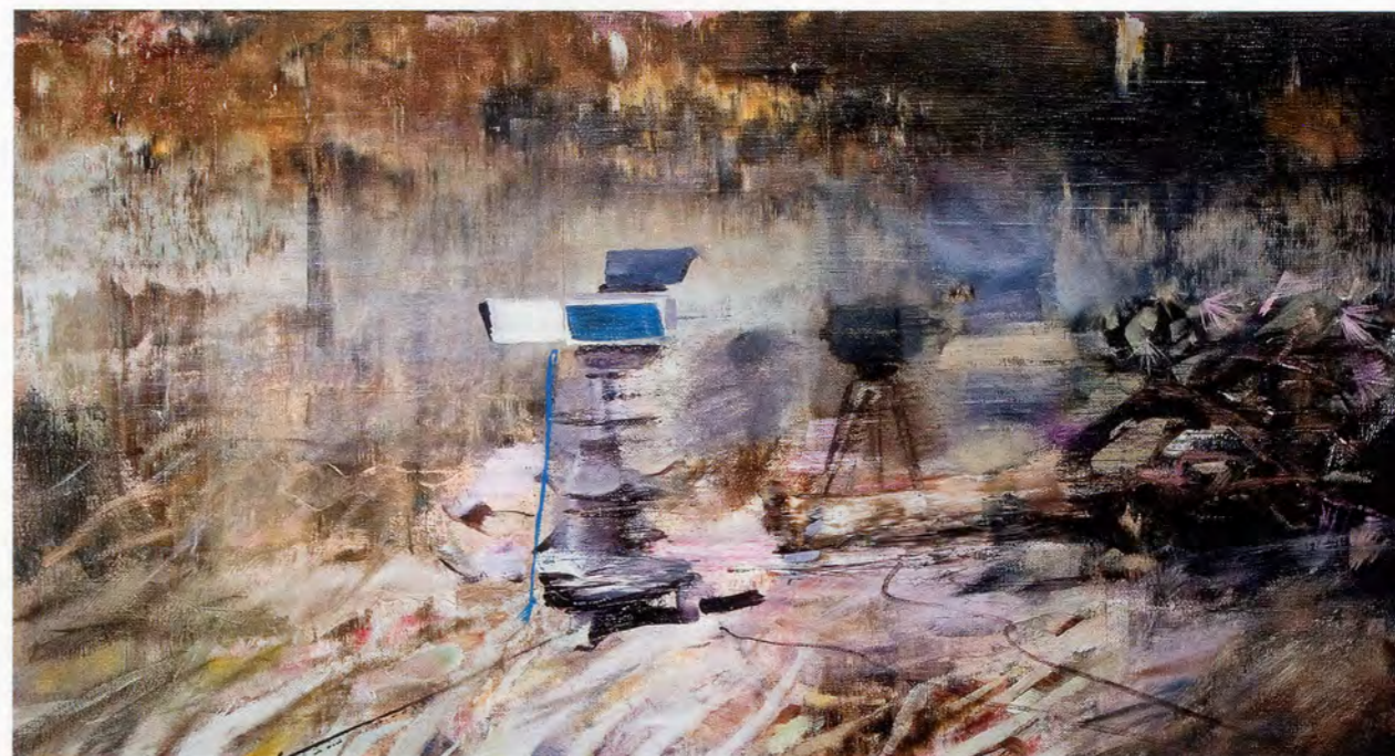
ADRIAN GHENIE, THE BLOW , 2010, oil on canvas, 13 3/4 x 25 3/8" / DER SCHLAG , Öl auf Leinwand, 35 x 65 cm.

Der kollektive Bilderrausch, ausgelöst von der tödlichen Verbrennungswirkung der Atomenergie, die dem Blick der Journalisten standhielt und Tausende von Atomtouristen nach Las Vegas lockte, und die Entfesselung eines so verrückten wie schädlichen Übermasses an Lichtempfindlichkeit, in dem diese Dokumentaristen und Augenzeugen operieren, werden im künstlichen Fleisch der Puppe, die dazu bestimmt war, etwas zu sehen, das für uns unsichtbar ist, eingefangen, geformt und vermessen. Als Rädchen in einer abstrakten Maschine, die Leben schenkt und den Tod quantifiziert, trägt die schief, stumm und todbringend präsente Schaufensterpuppe zum dunklen Glühen der Avisualität bei, jener angsterfüllten, von dem Filmtheoretiker Akira Mizuta Lippit diskutierten Beziehung, die das atomare Unbewusste strukturiert. Gestützt auf den frühen Film und das japanische Kino nach Hiroshima analysiert Lippit Avisualität als ein abgründiges Nichtsehen, das durch die Offenbarungen der Moderne schießt. Diese Substanz, so Lippit, zersetzt nicht nur die Grenzbereiche der sichtbaren Welt, sondern verkompliziert oder verzerrt durch eine neue Optik der Ursachen und Wirkungen, eine pulsierende Synthese von Grelle