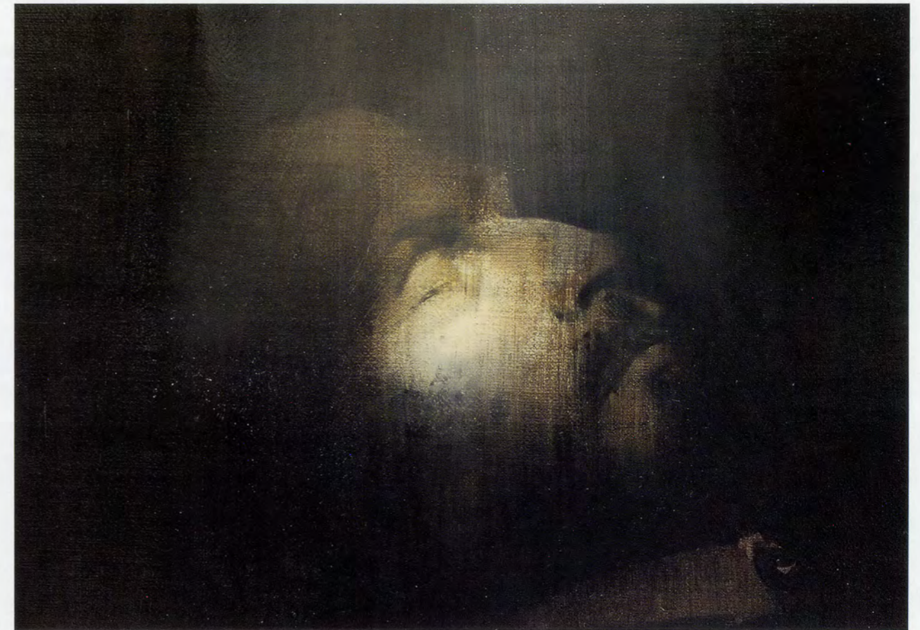
ADRIAN GHENIE, THE LEADER , 2008, oil and acrylic on canvas, 8 5/8 x 12" / DER FÜHRER , Öl und Acryl auf Leinwand, 22 x 30,5 cm.

assemblage of joints and limbs into a visual equivalent for a polity. Decades of replacing dead tissue have altered the body's original composition to the extent that it now inhabits a spectral terrain between carion and representation, a cyborg-icon whose heart and brain are extended through political and medical protocols. A member of the preservation team employs the phrase "living sculpture" to convey this paradox, "as if to say this is a sculpture of the body that is constructed of the body itself. " 2) For his body to appear unaffected by the passage of time, it must constantly change. Evidencing a different paradigm from Ernst Kantorowicz's classic distinction between, and blur-