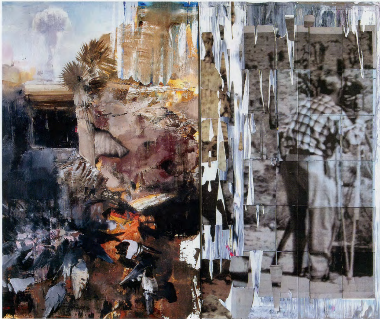
ADRIAN GHENIE, STIGMATA 2, 2010, oil, acrylic and collage on canvas, 78 3/4 x 94 1/2" / Öl, Acryl und Collage auf Leinwand, 200 x 240 cm.