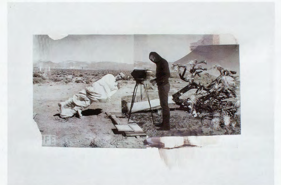
ADRIAN GHENIE, study for THE BLOW, 2010, collage and acrylic on paper, 13 x 19" / Studie zu DER SCHLAG, Collage und Acryl auf Papier, 32,8 x 48,2 cm.