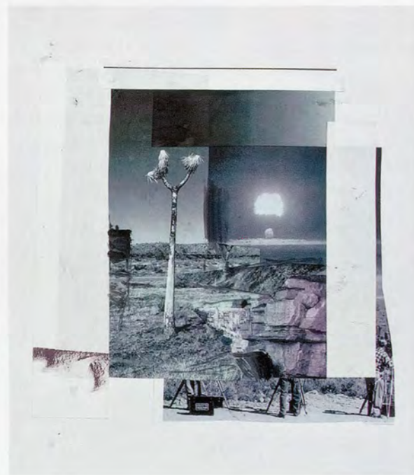
ADRIAN GHENIE, study for THE STIGMATA , 2010, collage and acrylic on paper, 27 1/2 x 20 3/4" / Studie für DIE STIGMATA , Collage und Acryl auf Papier, 70 x 52,7 cm.

The collective image-rapture induced by the lethal combustion of atomic energy that held the gaze of journalists and brought thousands of atomic tourists to Las Vegas, the unleashing of a crazed, noxious excess of photo-sensitivity in which these documentarians and witnesses operate, are captured, shaped, and measured in the plastic flesh of the dummy, made to see something we cannot. A cog in an abstract ma-