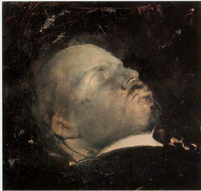
ADRIAN GHENIE, TURNING BLUE , 2008, oil and acrylic on canvas, 12 1/4 x 12 1/4" / BLAUVERFÄRBUNG , Öl und Acryl auf Leinwand, 31 x 31 cm.