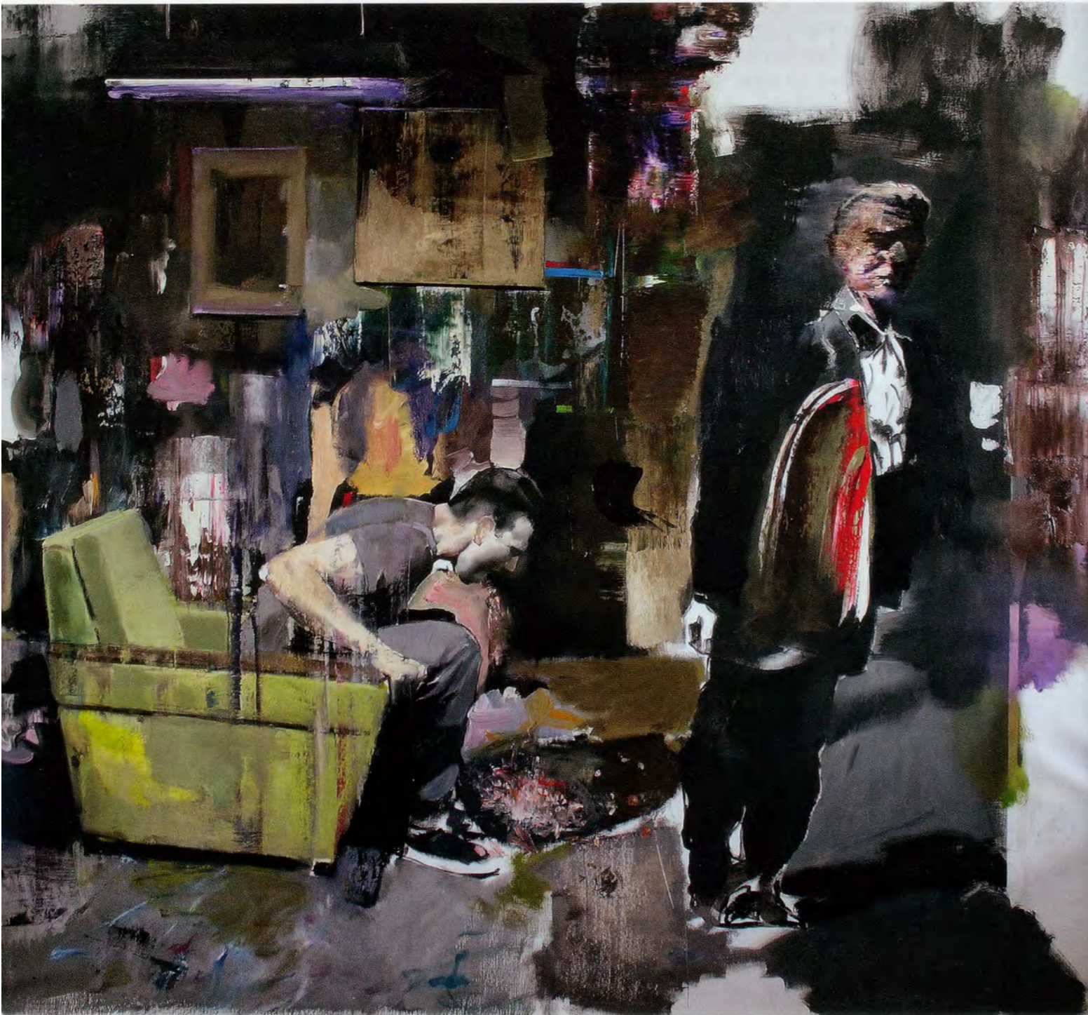
ADRIAN GHENIE, THE DEVIL 1 , 2010, oil on canvas, 80 3/4 x 90 1/2" / DER TEUFEL 1 , Öl auf Leinwand, 205 x 230 cm.

The relationship between inanimate and living forms takes a different trajectory in THE DEVIL (2008). Ghenie borrows his lopsided protagonist from a black-and-white image by Life magazine photographer Loomis Dean, one of numerous American photojournalists invited to document the aftermath of nuclear experiments at the Nevada Test Site. An entire town was built at Yucca Flat and peopled with hundreds of store mannequins to study the effects of a blast on everything from houses to clothes to canned food. The News Nob, a strategic spot positioned seven miles from the test site itself, was established in 1952 as a designated area for journalists to witness the detonations. In tandem with aerial photography of craterous depressions or clouds dissolving into their own brightness, photojournalistic routine at the News Nob established an iconography of sorts: the categories into which an indirect gaze onto the blast would fall, the postures and positions, protocols, instruments, and crepuscular photogenics by which an event whose intensity defies capabilities of technical registration and mortally threatens the naked eye could be obliquely apprehended, segmented into points of view, and seemingly domesticated. Dean's own experience leads to an insistent focus on portraiture, on the make-believe of familial and domestic devastation played out by the mannequins. Take the