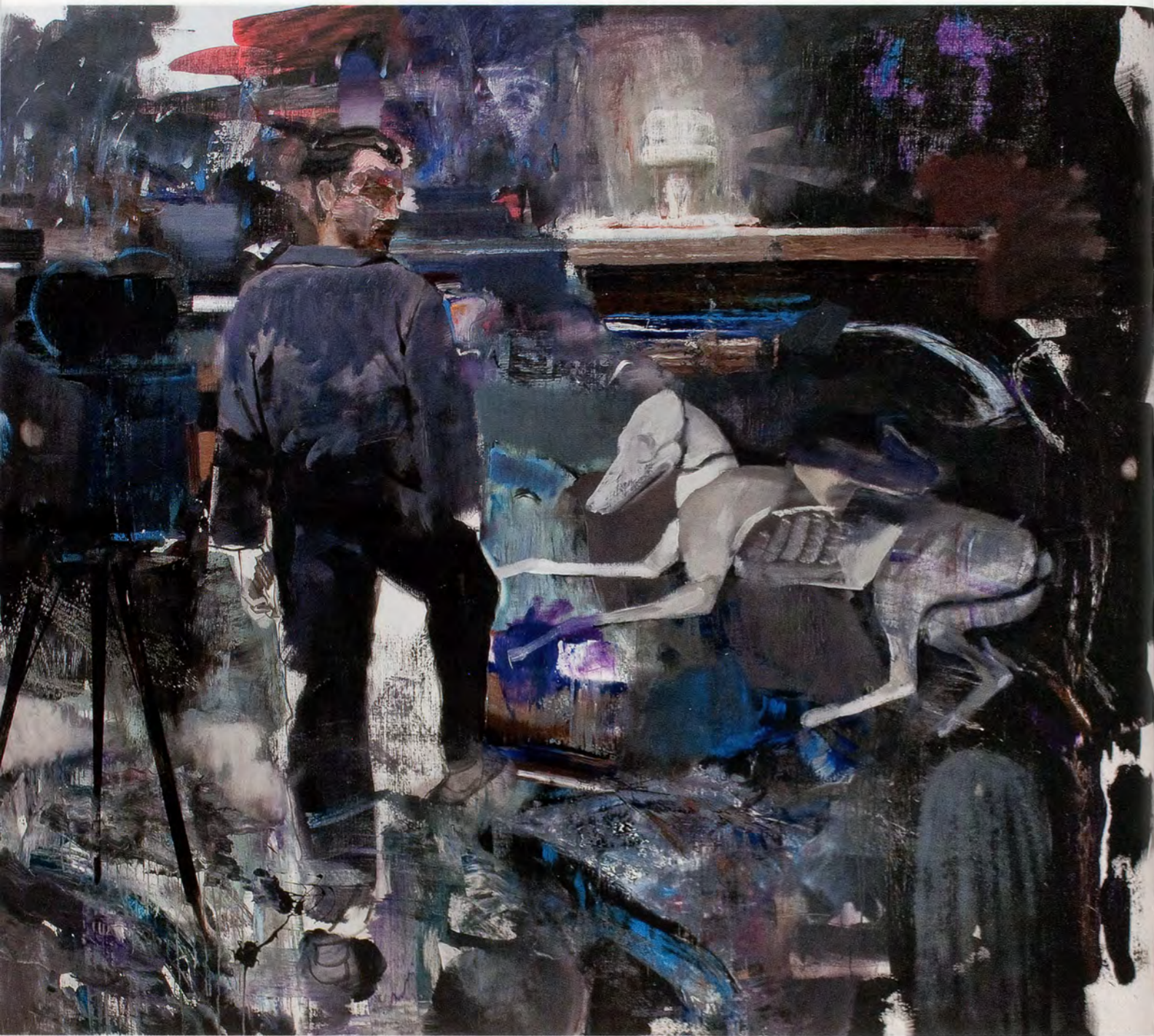
ADRIAN GHENIE, THE DEVIL 2 , 2010, oil on canvas, 78 3/4 x 90 1/2" / DER TEUFEL 2 , Öl auf Leinwand, 200 x 230 cm.

chain of pathogens, infection, and ejecta. In place of the semblance of an exchange, painter and model exist in separate domains within the painting's suggestion of three-dimensional collage. Ghenie has a keen interest in the scenographic dispositifs of religious art, in which context this image could have been an annunciation or a temptation. But these tropes are deployed here to opposite effect: Rather than delineate the crossing of borders between earthly and otherworldly realms, the scene is resolved as one of mutual obliviousness and severed contact. Revulsion reduces the self to nothing more than the skin that separates convulsed innards from inimical surroundings, an impoverished interiority that works as counterpart to the silent, battered guest, incapable of enunciating an identity. The demonic element indicated by the title might indeed be circling the eyeless, desensitized space between them: a negative sublime, an emptying-out and withdrawal of the self from the innumerable, immense, and ever grimmer statistics of modernity that it can no longer compute or bear.