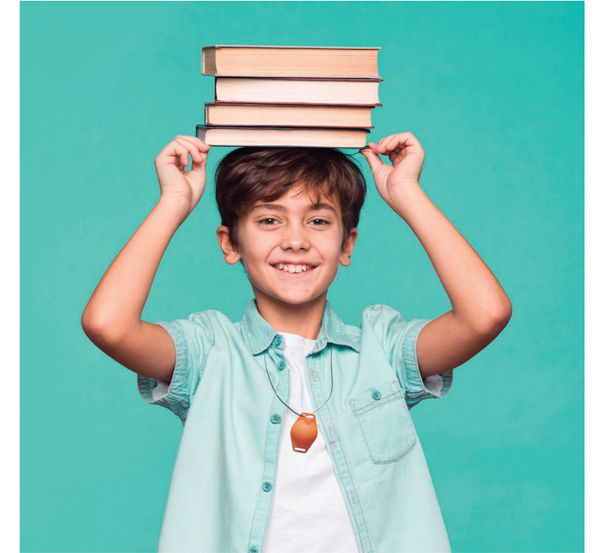
Uso do módulo como pendente/ Pendant version.