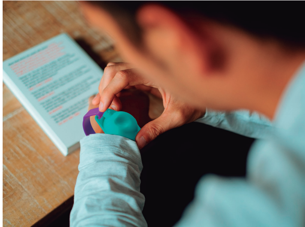
Uso como pulseira simulando encaixe do pino/ As a wrist piece, safety cap fitting.