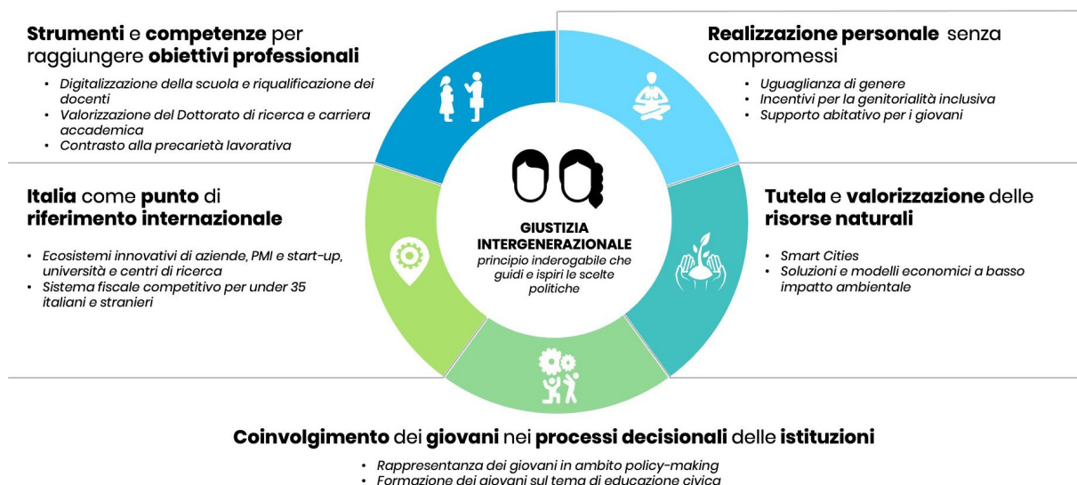
Figura 1 – Le 5 battaglie dei giovani