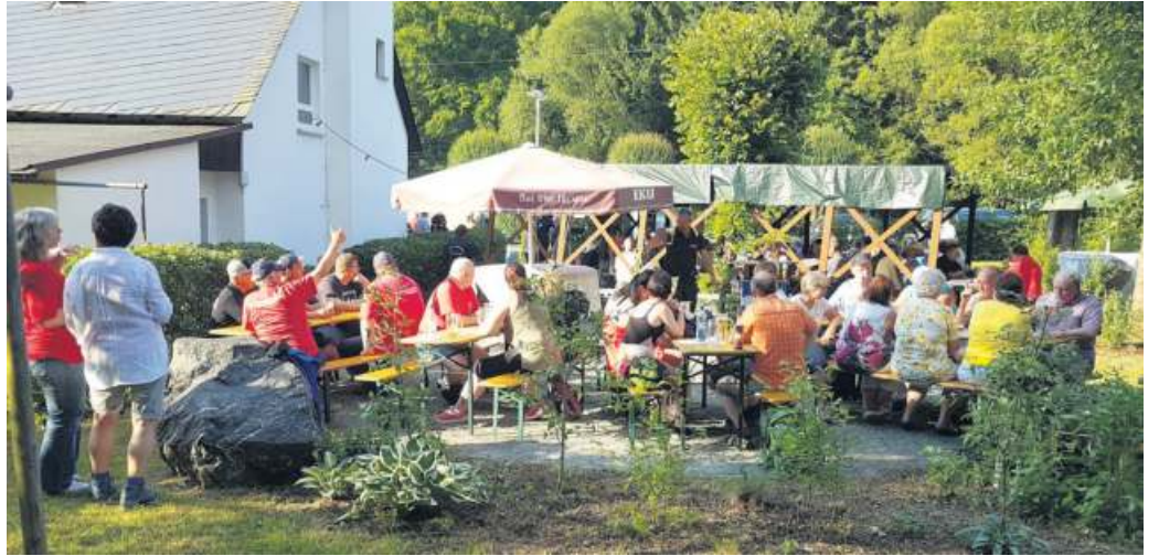
Im Bereich des Gerätehauses veranstaltete der Feuerwehrverein Dürrenwaid ein Gartenfest, das auf eine erfreuliche Resonanz stieß.

dem thüringischen Neundorf, die damit ihre Verbundenheit zu den Dürrenwaidern Kollegen dokumentierten. Selbstverständlich waren auch Kameraden der Stützpunktwehr Geroldsgrün, mit der die Dürrenwaidern Wehrleute als Wache 2 im aktiven Bereich eine Einheit bilden, vertreten. Gut gelaunt und gesellig zeigten sich die Gäste, die von den eifrigeren Helfern bestens versorgt wurden. Für die musikalische Umrahmung hatte Reme Micheal aus Steinbach gesorgt. hf