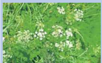
Bärwurz-Wanderung am 6. August