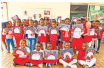
Spendentag beim dm-Drogeriemarkt Naila am 15. Juli