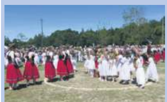
Lichtenberg feiert Heimat- und Wiesenfest