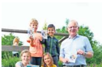
Das Geroldgrüner Ferienprogramm ist da!

Haben Sie ein Foto, das Sie gerne hier zeigen möchten? Eine E-Mail an redfrankenwald@kurier.de genügt, und Ihr Bild wird vielleicht im Interkommunalen Amtsblatt abgedruckt. Das Thema wählen Sie. Bitte fügen Sie Ihren Namen, Ihren Wohnort und eine kleine Bildbeschreibung hinzu.