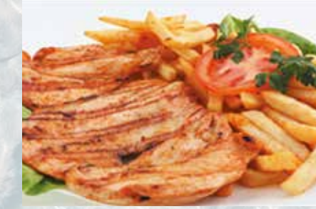
-Pechuga de pollo con patatas y ensalada Chicken breast, chips & salad