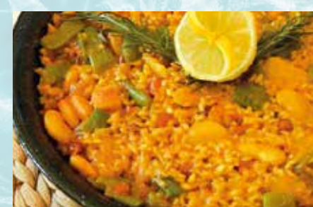
-Paella Vegetariana sólo con verduras (mín. 2 pers.) Vegetable Paella