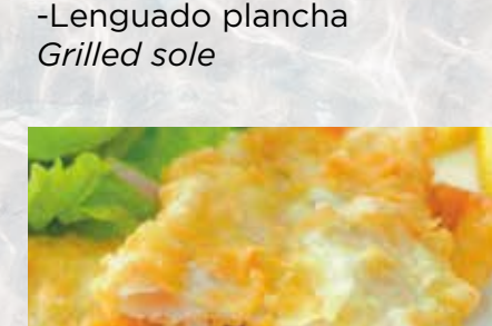
-Merluza a la romana Hake in batter