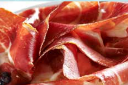
-Jamón Serrano Cured Ham