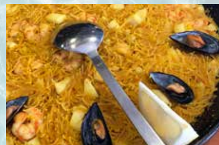
-Fideuà de fideos finos Fine noodles paella (mín. 2 pers.)