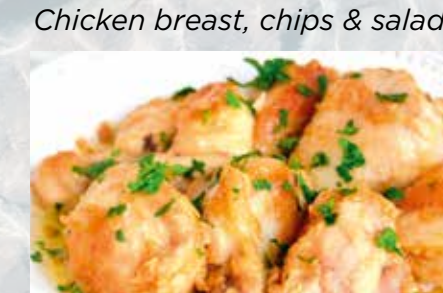
-Pollo al ajillo (por encargo mín. 2 pers.) Chicken in garlic (by order mín. 2 pers.)