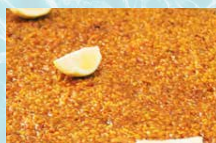
-Arroz a banda Rice taste fish (mín. 2 pers.)