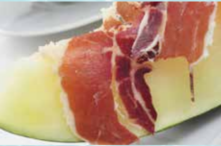
-Melón con jamón Melon with cured ham