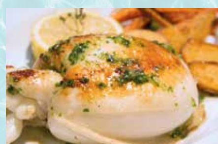
-Sepia a la plancha Grilled cuttlefish