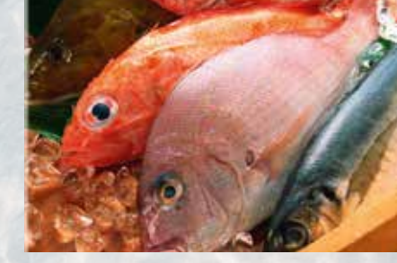
-Pescado del Día Fish of the day