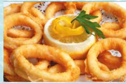
-Calamares a la romana Romana Squids in batter