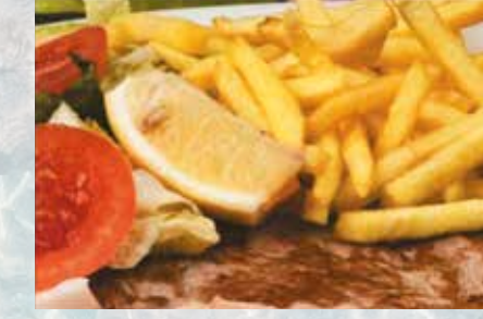
-Filete de ternera Beef steak