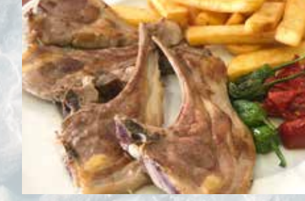
-Chuletas de cordero Lamb chops