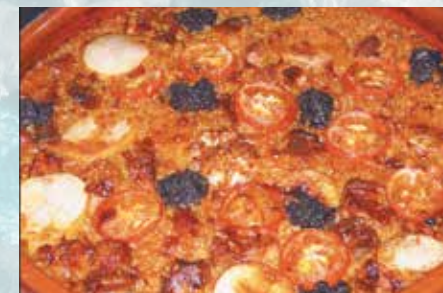
-Arroz al horno Rice in the oven (mín. 2 pers.)