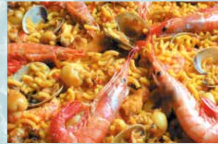
-Fideuà Noodles paella (mín. 2 pers.)