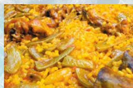
-Paella de pollo Chicken paella (mín. 2 pers.)