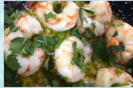
-Gambas al ajillo Prawns Garlic