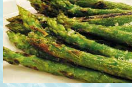
-Espárragos plancha Grilled asparagus