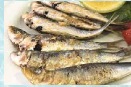
-Sardina plancha Grilled sardines