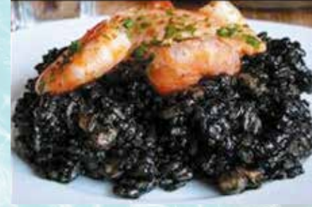
-Arroz negro Black rice (mín. 2 pers.)