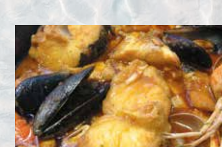
-Zarzuela de pescado Fish Casserole (mín. 2 pers.)