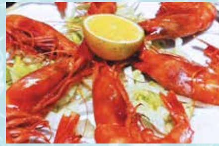
-Gambas plancha Grilled prawns