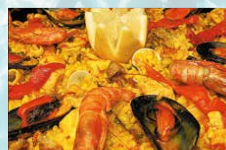
-Paella de marisco Seafood paella (mín. 2 pers.)