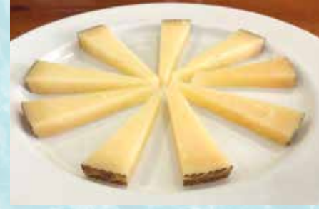
-Queso Manchego Manchegan Cheese