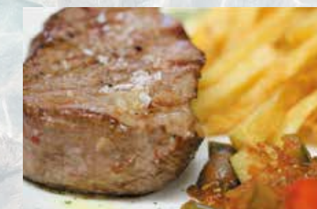
-Solomillo plancha Grilled sirloin