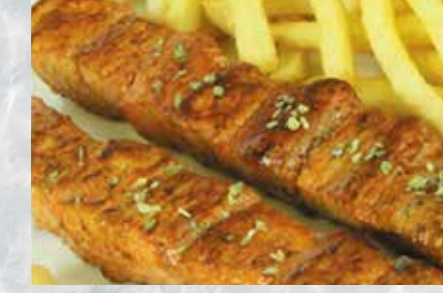
-Pincho moruno con patatas Sish kebab meat & chips