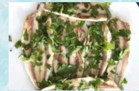
-Boquerones en vinagre Whitebait in vinegar