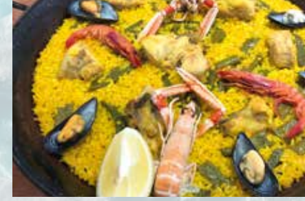
-Paella mixta Mixed paella (mín. 2 pers.)