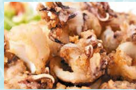
-Chopitos fritos Fried little squids