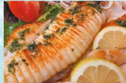
-Calamar plancha Grilled squid