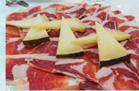
-Jamón y Queso Cured Ham and Cheese