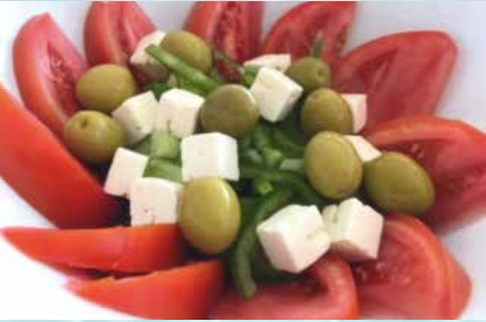
-Ensalada Feta Feta cheese salad