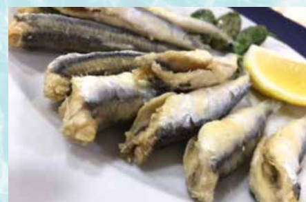
-Boquerones fritos Fried whitebait