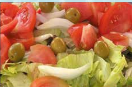
-Ensalada Valenciana Valencian Salad