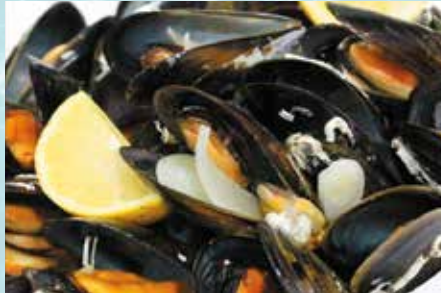
-Mejillones al vapor Steamed mussels