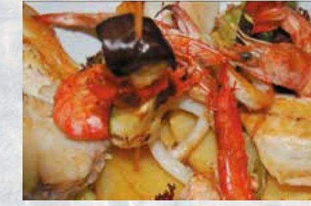
-Parrillada de pescado Special fish mix grill