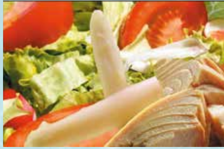
-Ensalada Mixta Mixed Salad