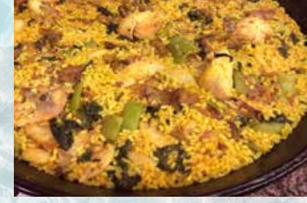
-Paella M a Elena / Pollo con verduras (mín. 2 pers.) Vegetables and chicken Paella