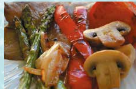
-Verduras a la plancha Grilled veggies