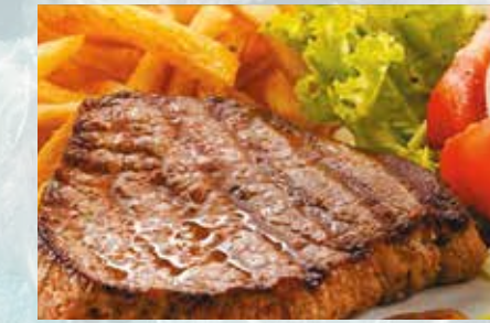
-Entrecot de ternera Beef entrecot