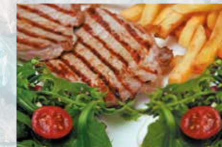
-Lomo con patatas, ensalada Pork loin, chips & salad