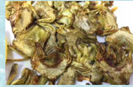
-Alcachofas a la plancha Grilled Artichokes