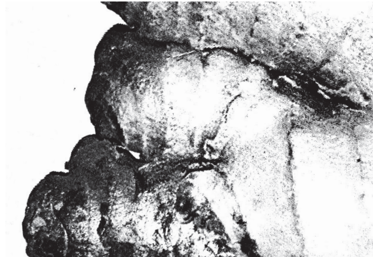
Bières/Vins +16 ans, Alcools forts/Spiritueux +18 ans