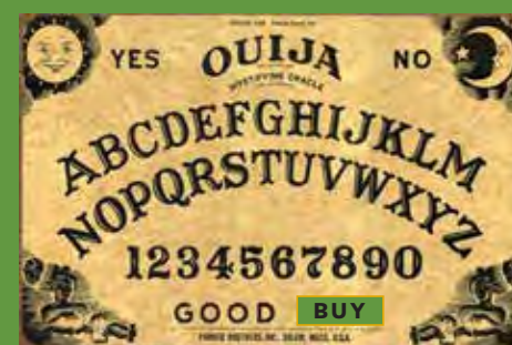
HERRAMIENTA HISTÓRICA DE COMPRA DE OGC