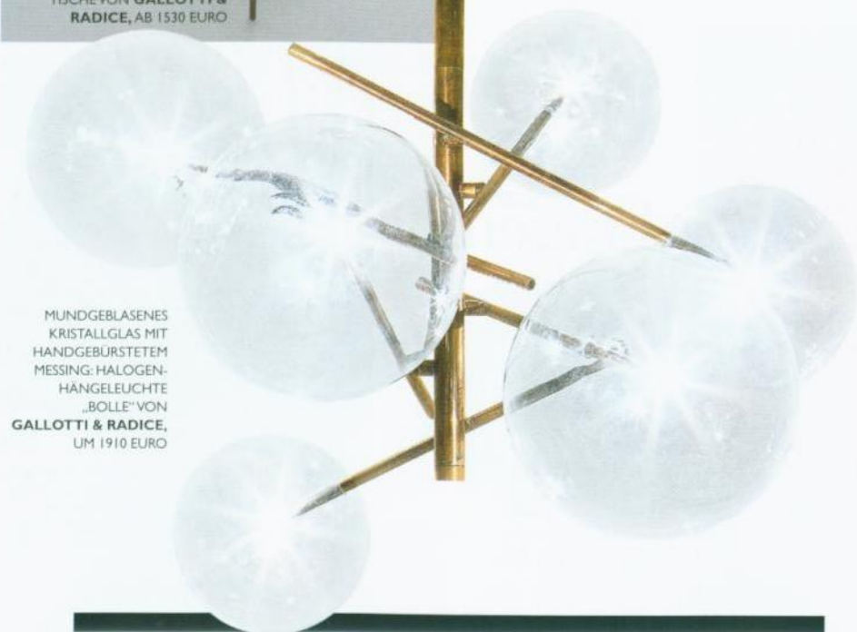
MUNDGEBLASENES KRISTALLGLAS MIT HANDGEBÜRSTETEM MESSING: HALOGEN-HÄNGELEUCHE „BOLLE“ VON GALLOTTI & RADICE, UM 1910 EURO

Jetzt darf es auch bei modernen Möbeln wieder golden schimmern und glänzen. Elegant wirkt das vor allem an klaren, minimalistischen Formen. Der italienische Möbelhersteller Gallotti & Radice zeigt an Coffee Tables und Leuchten, wie man es richtig macht: Die Hauptrolle spielen erstklassige Materialien wie getöntes Kristallglas, auf Hochglanz lackierte Hölzer und handgebürstete oder -brünierte Edelmetalle wie Kupfer und Messing. Unser Favorit: die „Golden Moon“-Tischserie mit abnehmbaren Messingschalen (links).