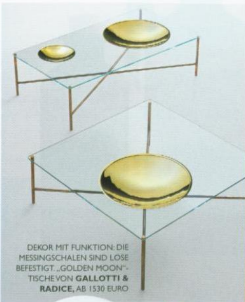
DEKOR MIT FUNKTION: DIE MESSINGSCHALEN SIND LOSE BEFESTIGT. „GOLDEN MOON“-TISCHE VON GALLOTTI & RADICE, AB 1530 EURO