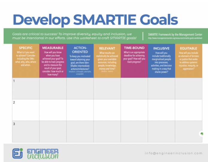
[Imagem] A SMARTIE goal worksheet.

Agora você está pronto para entrar no planejamento estratégico. Construa seu plano estratégico de longo prazo a curto prazo em incrementos de cinco, três e um ano, mas não se preocupe em pensar muito à frente. Trabalhe com sua equipe para definir OKRs de um ano e, em seguida, divida-os em OKRs trimestrais, mensais e até mesmo OKRs de sprint. Trabalhar de forma incremental ajudará sua equipe a se adaptar à medida que as condições de negócio mudam. Você revisitará a definição de metas regularmente. Lembre-se: seu planejamento mantém todos focados e alinhados e ajuda a equipe a se adaptar sem se desviar de sua missão, valores e objetivos.