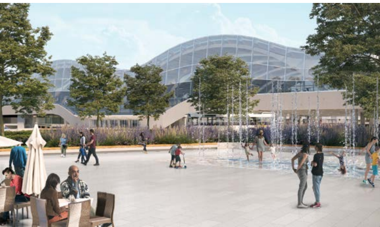
'Mechelen in beweging' - stationsbuurt