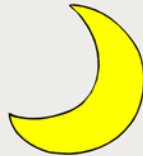
Canciones de cuna