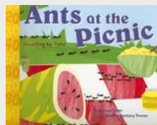
Libros de ficción