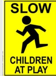
Señales de tránsito