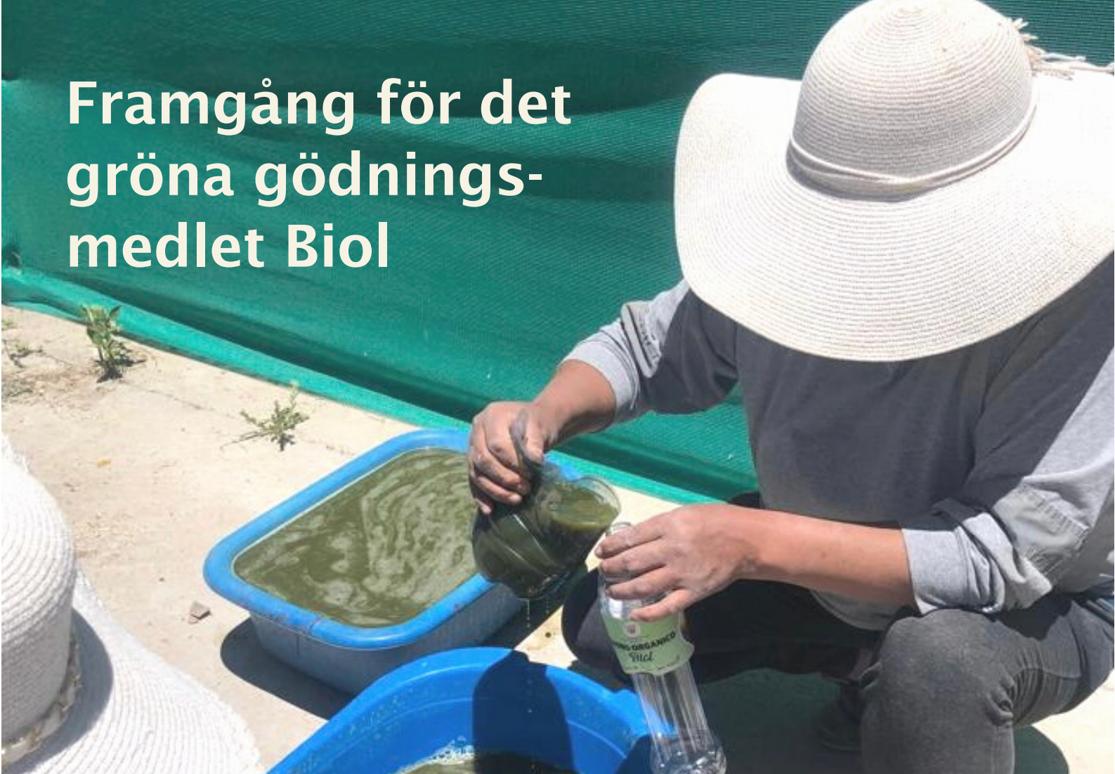
Färdig Biol hålls över i flaskor för försäljning.

På landsbygden i Peru lever en majoritet av invånarna med jordbruket som huvudsakliga inkomstkälla. Det organiska gödningsmedlet Biol har visat sig vara ett bra alternativ till konventionella gödningsmedel för att öka produktiviteten i odlingarna. Biolen är mer hälsosam och en viktig förutsättning för en övergång till ett mer hållbart jordbrukande i landet.