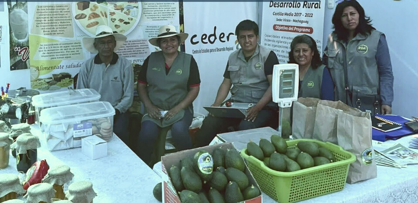
Ekologiska avocador får samsas med ekologisk honung, ostar och glass när Svalorna LAs samarbetsorganisation Ceder deltar på mässan

En mötesplats för kunskapsutbyte och inspiration