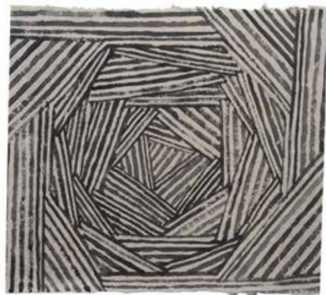
Peter Millett, Roof , 2023. Tinta sobre papel, 22 × 24,5 pulgadas.

Dibujos geométricos: comienza dibujando un rectángulo o un triángulo. Agrega cuadrados y rombos en el interior para organizar las distintas formas. Intenta hacer esto sin planificar con anticipación. Considera agregar triángulos, escalones, rayas, estrellas o líneas entrecruzadas o que se intersecan.