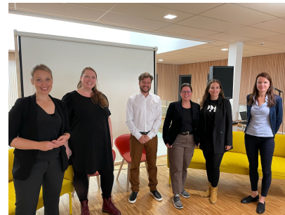
Samarbeid med helseklyngen NSCC og Eitri

Med en medlemsmasse som (snart) nærmer seg 100 virksomheter, og én ansatt - vil smart prioritering for å tilføre verdi for medlemmene være sentralt i 2022. Samtidig vil foreningen også jobbe for å få utvidet administrasjonen på sikt.