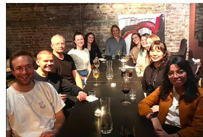
Designforeningene Grafill, Raster, Norske designere og DRB samlet rundt samme bord.