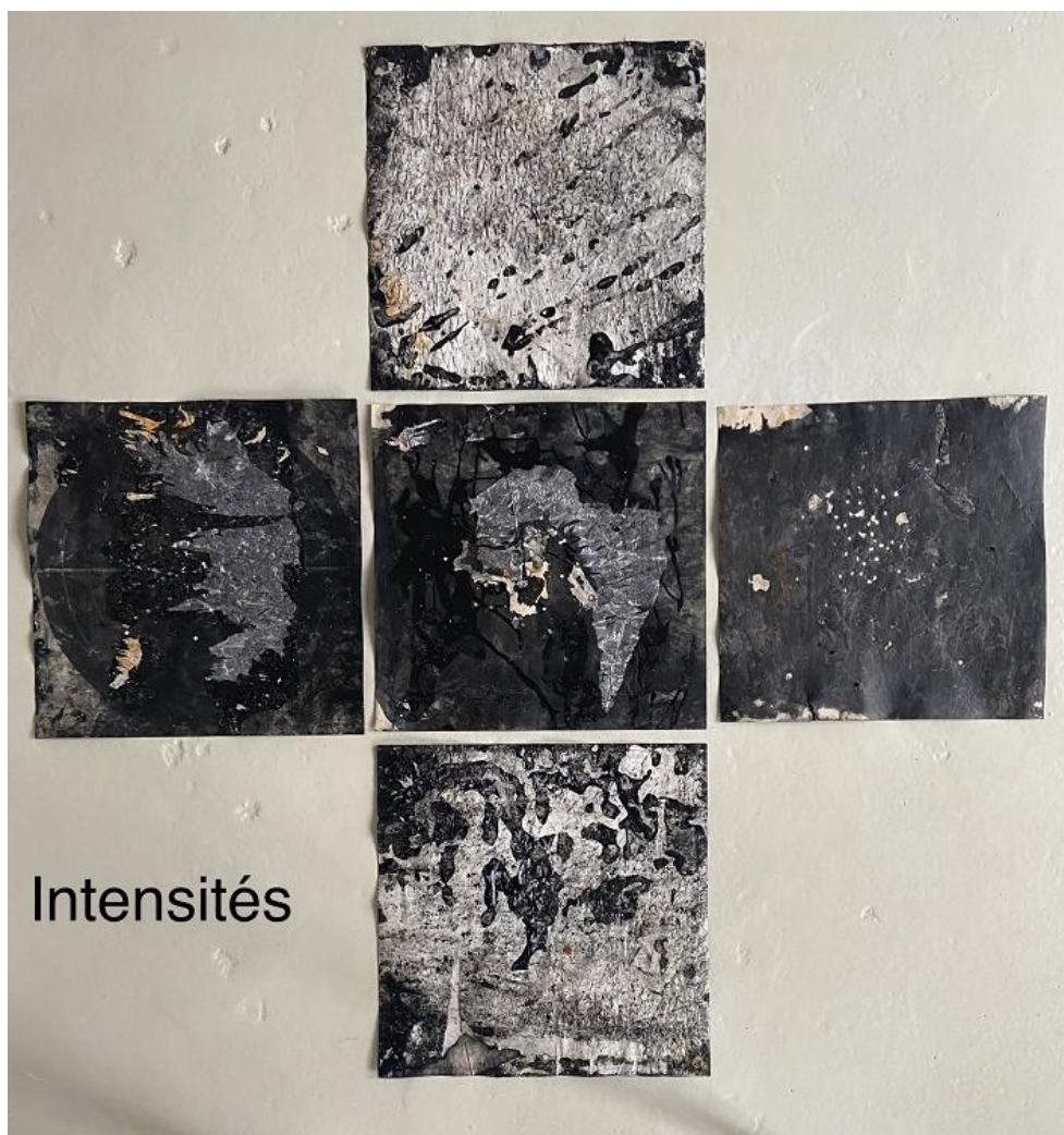
Série Intensité 2022 techniques mixtes sur cible de 50 x 50 cm Cadre porte-cible