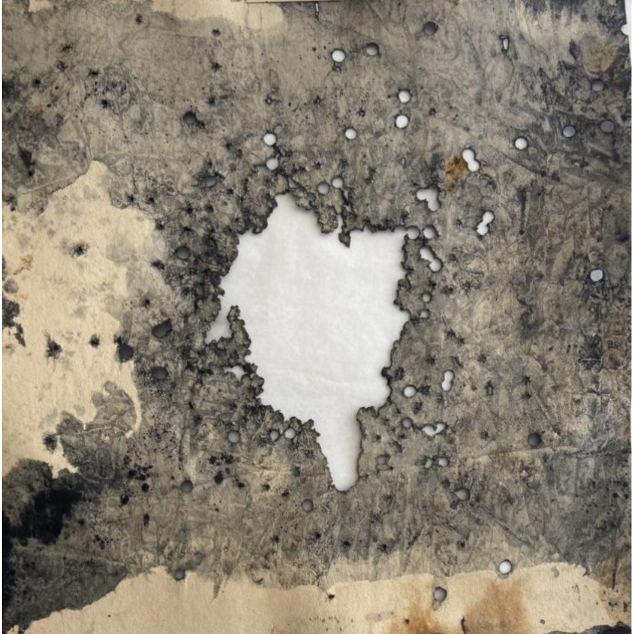
Série cratère, 2022 techniques mixtes sur cible de 50 x 50 cm Cadre plexi – portefeuille