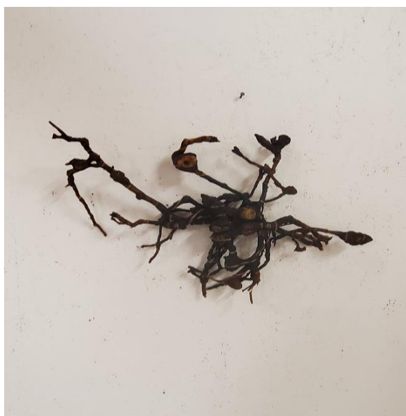
Série arbre-Cible 2014 Racine gravée en cible, 40 x 45 x 15 cm