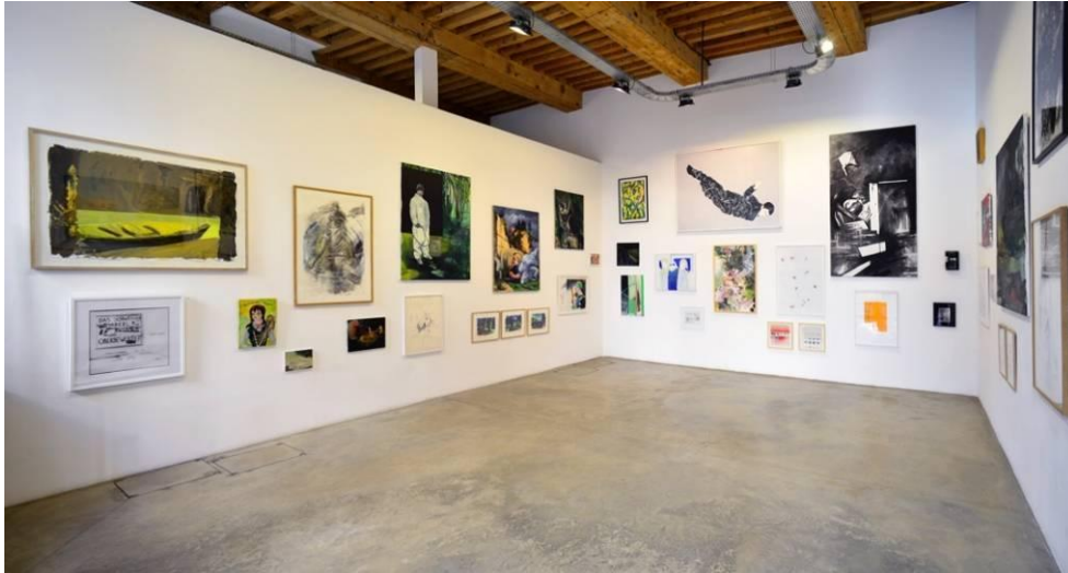
Vue de l'exposition L'œil & le cœur - volet 1 , février 2019, galerie Française Besson.

Active depuis 2004 à Lyon et sur la scène française et internationale, la galerie Française Besson défend et promeut des artistes émergents et confirmés. Particulièrement attachée à défendre la peinture et le dessin sans toutefois s'exclure à d'autres pratiques plastiques contemporaines (sculpture, photographie, vidéo, installations), la galerie organise 6 à 7 expositions personnelles et collectives par an. Chaque année à l'occasion des expositions, la galerie édite un Cahier de Crimée .