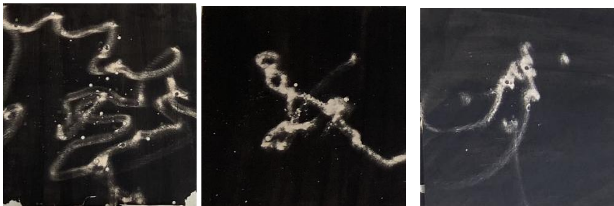
Série Arabesque 2022 techniques mixtes sur cible de 50 x 50 cm Cadre plexi – portefeuille