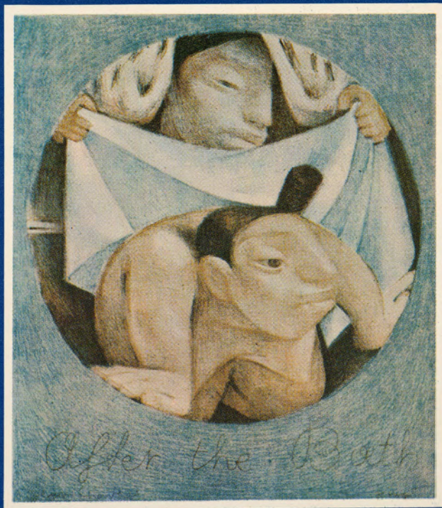
After the Bath