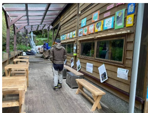
永安國小在山屋辦展覽