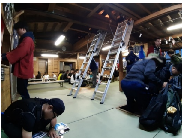
圖 7. 日本山屋內一景

然後，有比較有進步，但是不要再拿爛的出來比了，自滿自爽不會進步。日本山屋雖然私營居多但還背負很多公益性的責任，排雲好的地方，我們要鼓鼓掌，不好的地方，大家可以幫忙檢視一下標案的合理性與侷限在哪？在這個框架上還能怎麼改進，這個或許是比較好的實務操作。只是放大絕的一直說，「要吃好自己背」並不能解決什麼問題。」