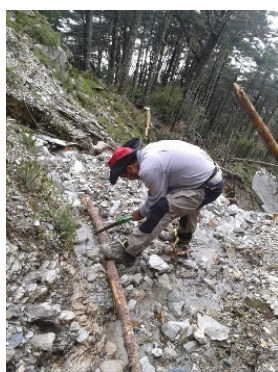
山屋工作人員協助修繕