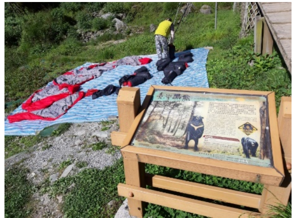
圖 10.日照強烈時， 協作會將睡袋拿出去曝曬消毒。