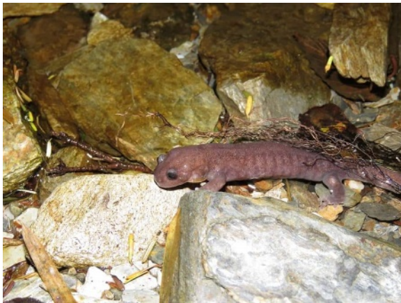
圖 9.水源地有特殊生物棲息 例如：山椒魚。