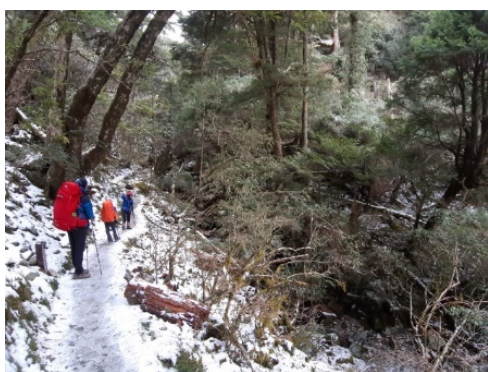
雪季上山須注意安全