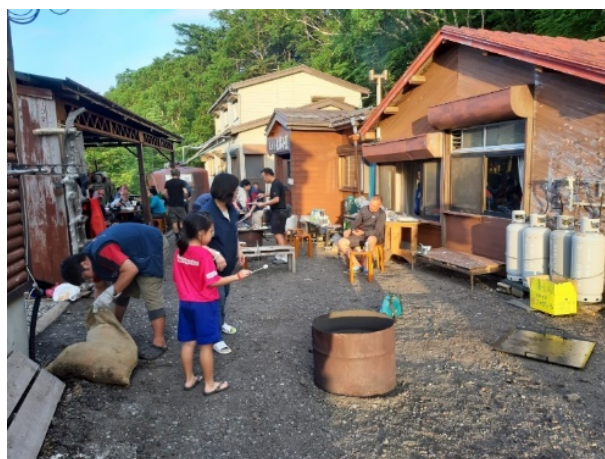
圖 8. 日本富士山佐藤小屋

吃飯是登山日常的大事！但一茶一飯，當思來處不易；粗茶淡飯是理所當然的，登山者理應有此認知。