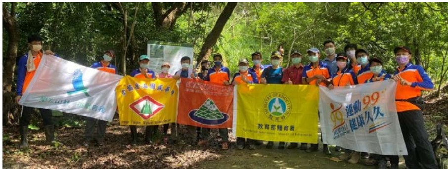
桃園市山岳協會完成北插天山岩戶分遣所線及南插天山線路標施作