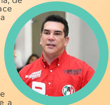
Los resultados nada halagüeños que tuvo el Revolucionario Institucional en este proceso electoral tienen en la cuerda floja al presidente nacional del tricolor, ALEJANDRO MORENO CÁRDENAS . Integrantes del Frente Nacional Democracia y Justicia Social lamentan que a la fecha, de lo que era el PRI hace muchos años ya nada queda y solo gobiernan dos estados. Exigen la inmediata salida de su presidente ALITO MORENO , así como la renovación del comité y otras estructuras a través de una asamblea extraordinaria a la que urgen convocar a la de ya. Con todo y las derrotas consecutivas, las bases del PRI sostienen que el partido tiene mucho que aportar y la historia se los confirma, así que poquito más que presionen y lograrán ‘tumbar’ a ALITO y compañía para darle un nuevo aire al partido.