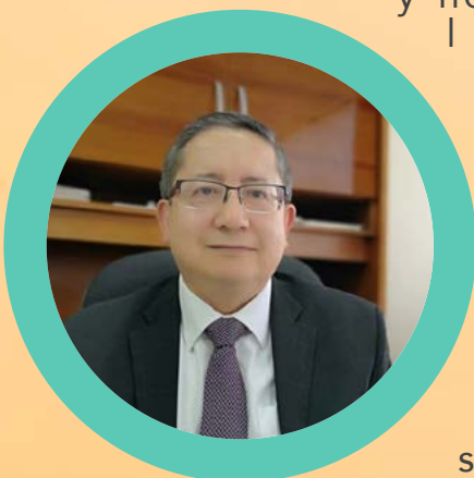
En tanto, al sindicato de docentes y administrativos del Cobaez, la presión de poco más de ocho horas de huelga les funcionó porque estiraron la cuerda y no se les reventó: lograron el compromiso de la Dirección General y del secretario de Finanzas, RICARDO OLIVARES , de que el subsistema también recibirá el incremento salarial del 4.5%, así