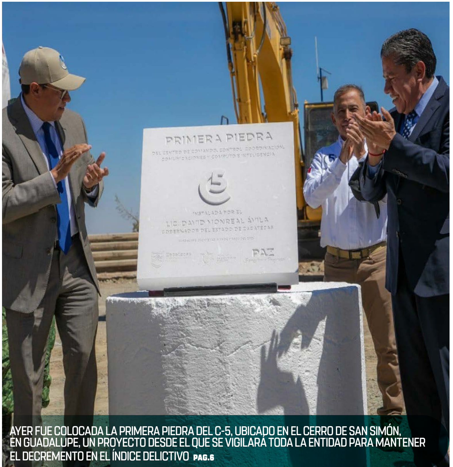
AYER FUE COLOCADA LA PRIMERA PIEDRA DEL C-5, UBICADO EN EL CERRO DE SAN SIMÓN, EN GUADALUPE, UN PROYECTO DESDE EL QUE SE VIGILARÁ TODA LA ENTIDAD PARA MANTENER EL DECREMENTO EN EL ÍNDICE DELICTIVO PAG.6